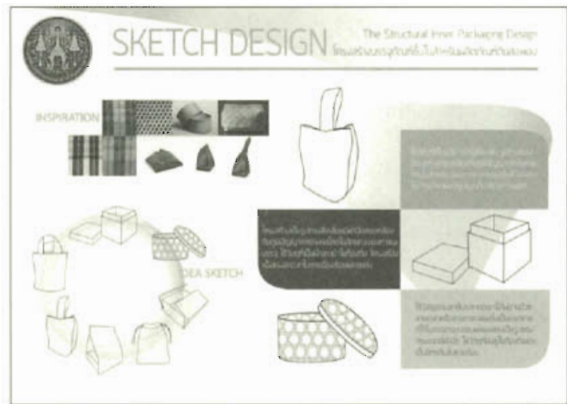
ภาพที่ 1 แสดงภาพ Sketch Design โครงสร้างบรรจุภัณฑ์สำหรับผลิตภัณฑ์ดินสอพอง 1