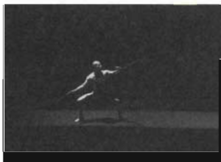
ภาพที่ 6 การฝึกการใช้อาวุธ