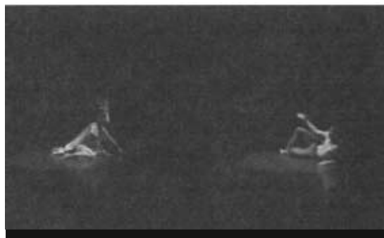
ภาพที่ 2 การนำเสนอช่วงที่ 2 ช่วงรัชกาลที่ 5-7

การผสมผสานระหว่างนาฏศิลป์ไทยและนาฏศิลป์สากล