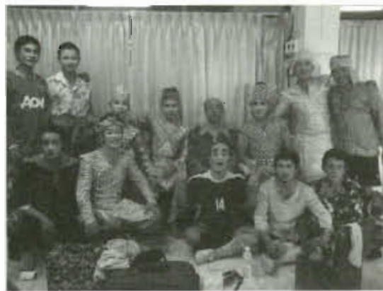
ภาพที่ 10 สายโลหิตแห่งลิเก

3. ด้วยพ่อแม่พี่น้องในครอบครัวแสดงลิเกอยู่ในคณะลิเกมาตั้งแต่ยังเด็ก จึงทำให้มีความคุ้นเคย ชิมชับทั้งพบเห็นสัมผัสโดยตรงและทางอ้อม กระทั่งได้สืบทอดอาชีพนี้จากครอบครัว และครอบครัวยังปลูกฝังไปถึงเรื่องความเคารพบูชาครูผู้ให้วิชาความรู้ในการแสดง นั้นเป็นสิ่งที่สะท้อนให้เห็นความเป็นจริงของผู้ประกอบอาชีพลิเกที่มีสายสัมพันธ์ทางครอบครัว ในการประกอบอาชีพนี้อย่างชัดเจน นี้คือ "สายโลหิตแห่งลิเก" อย่างแท้จริง