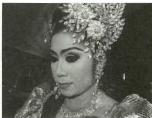
ภาพที่ 8 เจ้าของคณะลิเกตลกสุขเกษมหัวล้าน ภาพที่ 9 นางเอกคณะลิเกตลกสุขเกษมหัวล้าน