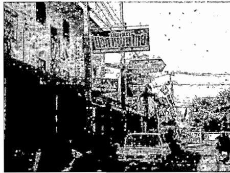
ภาพที่ 5 ชุมชนตรอกลิเก จังหวัดนครสวรรค์ในปัจจุบัน

ทำสำนักงานลิเก อาศัยอยู่บริเวณหน้าวัดนครสวรรค์ ถนนโกสีย์ ไม่มีที่อาศัย เนื่องจากหลังจากเกิดเหตุไฟไหม้เจ้าของที่ดินนั้นได้สร้างตึก อาคารพาณิชย์ เพื่อทำการค้า ธุรกิจ ผู้ประกอบอาชีพลิเกไม่มีเงินเพียงพอที่จะเช่าตึก เช่าอาคารพาณิชย์นั้น จึงได้อพยพโยกย้ายมาจับจอง