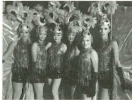
ภาพที่ 6 การแสดงคอนเสิร์ตในรูปแบบลิเก*