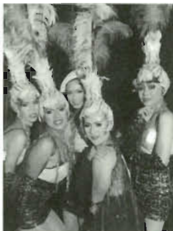
ภาพที่ 11 การแสดงคอนเสิร์ตในรูปแบบลิเก

จากการศึกษาผู้วิจัยได้พบภัยคุกคามที่เป็นปัจจัยหนึ่งที่ทำให้การว่าจ้างการแสดงลิเกถูกลดบทบาทลงด้วยเทคโนโลยีสมัยใหม่ และสื่อยุคใหม่ การแสดงที่บันทึกลงในแผ่นซีดี และดีวีดี รวมถึงการออกอากาศโทรทัศน์ วิทยุ ที่วิทยุท้องถิ่น อินเทอร์เน็ต ละครเวที หรือตลกคาเฟ่ ทำให้ผู้ประกอบการอาชีพลิเกถูกแทนที่ด้วยสิ่งเหล่านี้ ตามยุคสมัยเทคโนโลยี ส่งผลกระทบถึงรายได้ของผู้ประกอบการอาชีพลิเกในชุมชน