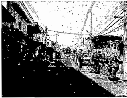
ภาพที่ 3-4 ชุมชนตรอกลิเก จังหวัดนครสวรรค์ในปัจจุบัน