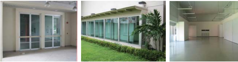
ภาพที่ 1 ภาพห้องนิทรรศการหมุนเวียน หอศิลป์วัฒนธรรมภาคตะวันออกเฉียง

2.1 ผู้สร้างสรรค์จึงเลือกใช้ห้องนิทรรศการหมุนเวียน หอศิลป์และวัฒนธรรมภาคตะวันออกเฉียง ภาคตะวันออกเฉียง มหาวิทยาลัยบูรพา จังหวัดชลบุรี เพราะมีความเหมาะสม คือ มีพื้นที่ขนาดใหญ่และค่อนข้างมืด