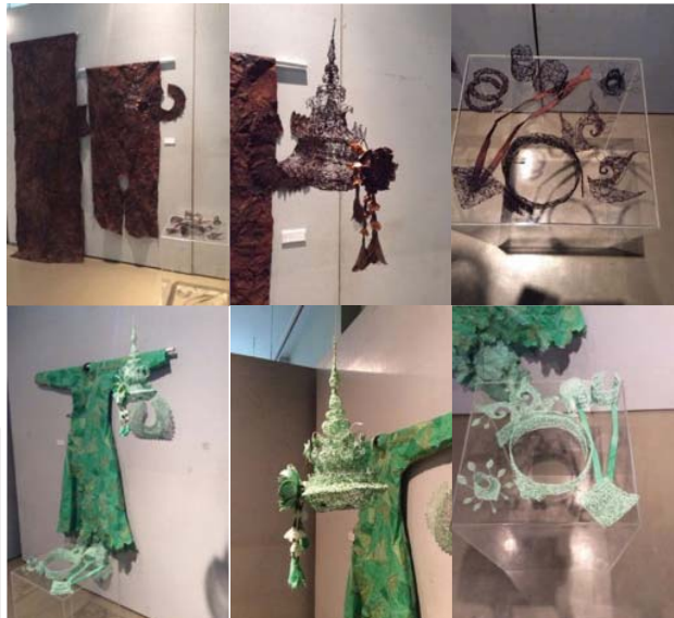
ภาพที่ 8 ภาพกระบวนการจัดวางแสดงผลงานในพื้นที่ส่วนที่ 2