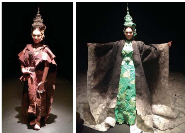
ภาพที่ 4 ภาพเครื่องแต่งกาย การแสดงคุณหญิงกีรัตช่วงป่วยหนัก และคุณหญิงกีรัตแต่งตัวชมความงาม

ชุดเครื่องแต่งกายที่ 2 นั้นนอกจากจะมีชุดสีเขียวแล้วยังมีเสื้อคลุมด้านนอกอีกหนึ่งชิ้น ซึ่งเป็นช่วงที่คุณหญิงกีรัตแต่งตัวต้อนรับชายผู้เป็นที่รักใส่เสื้อสีดำอีกตัวเพื่ออำพรางรูปร่างที่ทรุดโทรม ผู้สร้างสรรคจึงนำวิธีสร้างผ้าในลักษณะเดิมแบบชุดแต่งกายสีเขียว โดยจะนำเอากระดาษสีขาวตัดเป็นรูปดอกไม้ และนำมาประกบกันกับผ้าสีขาวที่มีเนื้อบางโดยตัดเย็บให้เป็นชุดคลุมที่ใหญ่แพร์กระจายออกไป เป็นโทนสีขาวและทำสีช่วงด้านบนด้วยสีดำในส่วนบนของชุด