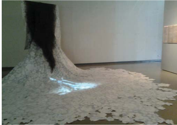
ภาพที่ 9 ภาพกระบวนการจัดวางแสดงผลงานในพื้นที่ส่วนที่ 3