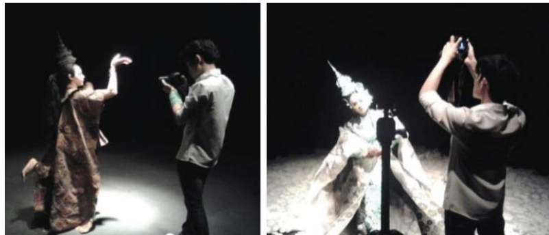
ภาพที่ 5 ภาพกระบวนการถ่ายทำวีดีโอ

ช่วงการบันทึกการแสดงผู้สร้างสรรค์ได้เลือกใช้ห้องทดลองการแสดงโรงละครแบบ Experimental theatre ของคณะดนตรีและการแสดง มหาวิทยาลัยบูรพาในการบันทึกภาพ เพราะโรงละครนี้มีความมืดและขนาดที่พอเหมาะในการที่จะบันทึกภาพในครั้งนี้