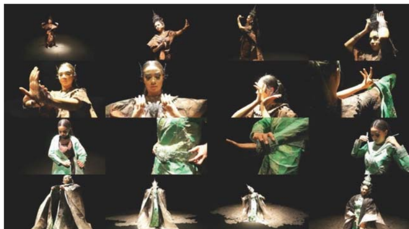
ภาพที่ 6 ภาพกระบวนการตัดต่อภาพทำวีดีโอ

หลังจากกระบวนการถ่ายทำก็นำไปสู่กระบวนการตัดต่อให้ได้ตามกระบวนการที่วางไว้