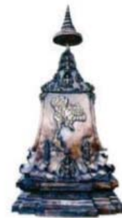
ภาพที่ 8 พระแผนไทย