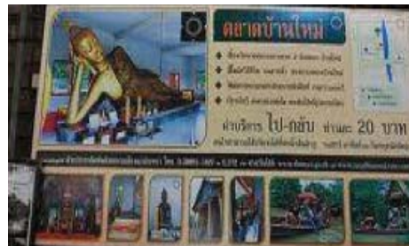
ภาพที่ 1 การประชาสัมพันธ์ล่องเรือ

บทบาทและรูปแบบการจัดการเชิงวัฒนธรรมวัดเทพนิมิตร ผู้นำในการจัดการและพัฒนา ได้แก่คณะพระภิกษุสงฆ์ และคณะกรรมการบริหารวัดในการดูแลและพัฒนาในทุกด้าน โดยได้รับการอนุเคราะห์ทุนทรัพย์จากศิษยานุศิษย์และผู้มีจิตศรัทธาตามแต่โอกาสและกิจกรรมที่ทางวัดร้องขอ โดยทางวัดได้ดำเนินการในด้านต่างๆ ดังนี้