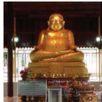
ภาพที่ 10 พระสังกัจจายน์