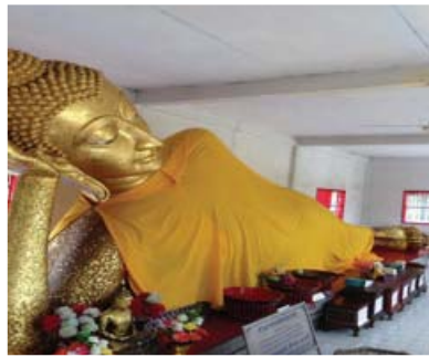
ภาพที่ 4 พระพุทธไสยาสน์

ด้านสิ่งดึงดูดใจของนักท่องเที่ยววัดเทพนิมิตร มีพระพุทธไสยาสน์ องค์ใหญ่ที่สุดในจังหวัดฉะเชิงเทรา พระอุโบสถวัดเทพนิมิตรเป็นสถานที่ศักดิ์สิทธิ์ที่ประชาชนให้ความเลื่อมใสศรัทธา ด้วยมีพระประธาน คือ "หลวงพ่โต" บริเวณหน้าพระอุโบสถซึ่งเป็นที่ประดิษฐานพระบรมรูปหล่อรัชกาลที่ 8 จัดตกแต่งเป็นซุ้มประดับกระจกสีเป็นลวดลายงดงาม