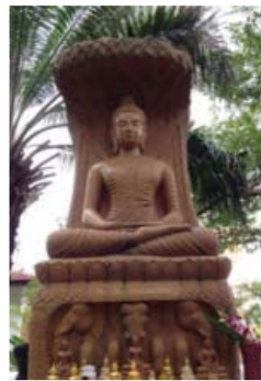
ภาพที่ 7 พระสยามมณฑล

อาคารกุฏิสงฆ์ เป็นอาคารกุฏิใหญ่ สร้างด้วยไม้สักสูง 2 ชั้น หลังคาทรงปั้นหยามะนิลา (Gable hip) กว้าง 8 เมตร ยาว 12.5 เมตร มีมุขยื่นออกมา กว้าง 4 เมตร สร้างใน พ.ศ. 2461 - 2462 พระสยามมณฑล จัดสร้างขึ้นโดยพระอาจารย์สมชาย ปัญญมโน เจ้าอาวาสวัดป่าสว่างบุญ ต.ชะอม อ. แก่งคอย จ.สระบุรี ร่วมกับพุทธศาสนิกชนจัดสร้าง พระศิลาสยามมณฑล จำนวน 80 องค์ สมเด็จพระญาณสังวร สมเด็จพระสังฆราชสกลมหาสังฆปริณายก ทรงเป็นประธานฝ่ายสงฆ์ เพื่อน้อมเกล้าถวายเป็นพระราชกุศลแด่พระบาทสมเด็จพระเจ้าอยู่หัวภูมิพลอดุลยเดชฯ เนื่องในวโรกาสเฉลิมพระชนมพรรษาครบ 72 พรรษา พระแผนไทยสร้างเนื่องในวโรกาสที่พระบาทสมเด็จพระเจ้าอยู่หัวฯ จะทรงเจริญพระชนมพรรษา 84 พรรษา ในปี พ.ศ.2554 ได้จัดสร้างพระสังกัจจายน์ ศาลาประดิษฐานไว้ในบริเวณต่อจากพระพุทธรูปไสยาสน์ หลวงพ่อองค์ดำซึ่งจำลองแบบมาจากเมืองนาลันทา ประเทศอินเดีย