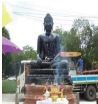
ภาพที่ 9 พ้องค์ดำ