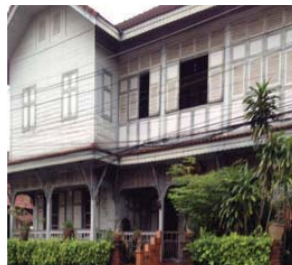
ภาพที่ 6 อาคารกุฏิใหญ่