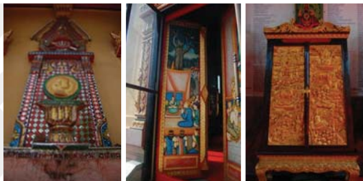
ภาพที่ 5 พระบรมรูปหล่อรัชกาลที่ 8, ประตูและหน้าต่าง

ด้านสิ่งดึงดูดใจของนักท่องเที่ยววัดเทพนิมิตร มีพระพุทธไสยาสน์ องค์ใหญ่ที่สุดในจังหวัดฉะเชิงเทรา พระอุโบสถวัดเทพนิมิตรเป็นสถานที่ศักดิ์สิทธิ์ที่ประชาชนให้ความเลื่อมใสศรัทธา ด้วยมีพระประธาน คือ "หลวงพ่โต" บริเวณหน้าพระอุโบสถซึ่งเป็นที่ประดิษฐานพระบรมรูปหล่อรัชกาลที่ 8 จัดตกแต่งเป็นซุ้มประดับกระจกสีเป็นลวดลายงดงาม