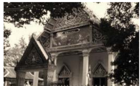
ภาพที่ 2 พระอุโบสถวัดเทพนิมิตร