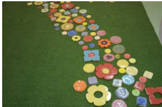
ภาพที่ 9 การจัดวางกระเบื้องปูทางเดิน