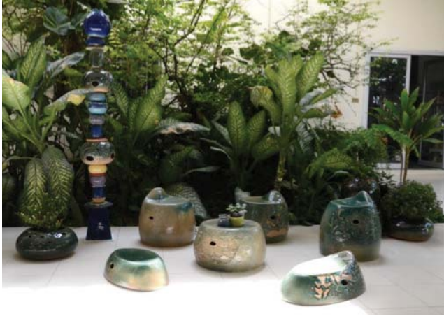
ภาพที่ 7 การจัดวางแก้วอี่เป็นกลุ่มวงกลม