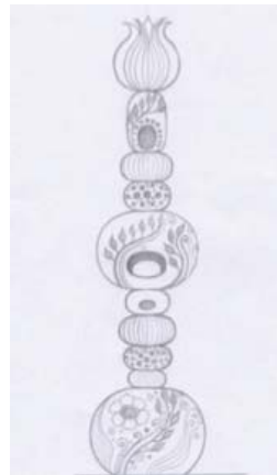
ภาพที่ 3 แบบร่างโคมไฟ

3.3 การร่างแบบโคมไฟ มีความบันดาลใจจากรูปทรงต้นกระบองเพชร โดยตัดทอนรายละเอียดให้ได้รูปทรงที่เรียบง่ายเพื่อส่งเสริมการตกแต่งพื้นผิวให้เห็นเด่นชัด รูปทรงมีขนาดต่างกันเพื่อนำรูปทรงมาประกอบเรียงกันในแนวตั้งให้เกิดความโดดเด่นและมีเอกลักษณ์เฉพาะของรูปแบบโคมไฟในสวนที่จัดแบบธรรมชาติ