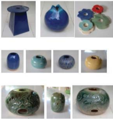
ภาพที่ 10 ส่วนประกอบโคมไฟ