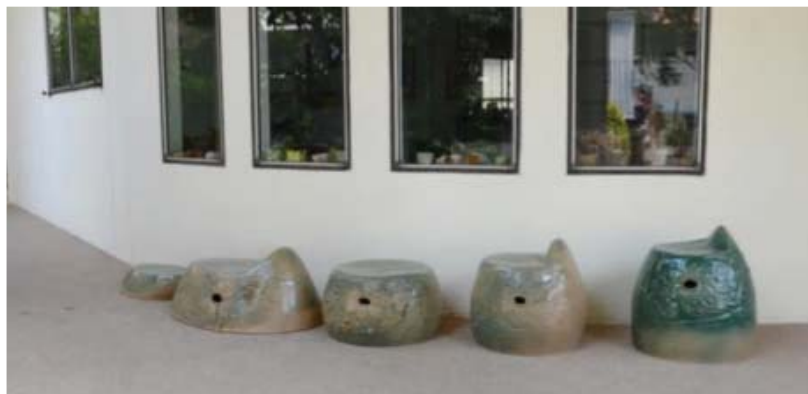
ภาพที่ 6 ผลงานแก้วชุดห้าตัว