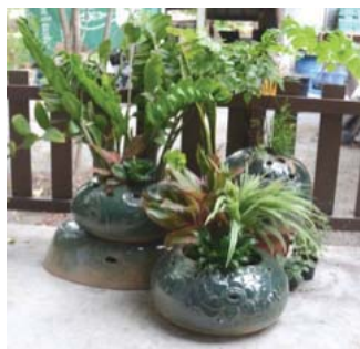
ภาพที่ 12 กระถางปลูกไม้ประดับ