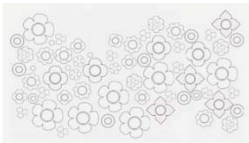
ภาพที่ 2 แบบร่างแผ่นกระเบื้องปูพื้น

3.2 การร่างแบบกระเบื้องปูพื้นทางเดินในสวน มีแนวความคิดในการถ่ายทอดความงามตามธรรมชาติลงบนแผ่นกระเบื้องปูพื้นทางเดินในสวน ให้มีรูปแบบลวดลายสอดคล้องกับรูปแบบการจัดสวนแบบธรรมชาติ โดยนำลวดลายจากตารางมาผสมผสาน และประยุกต์เป็นแผ่นกระเบื้องลายดอกไม้ที่มีลักษณะรูปร่างและขนาดแตกต่างกันหลากหลายแบบ โดยไม่กำหนดรูปแบบ และลวดลายการจัดวางแผ่นกระเบื้อง เน้นการใช้ความรู้ด้านองค์ประกอบศิลป์ในการจัดวางแผ่นกระเบื้องให้เกิดความงามตามความพึงพอใจ พร้อมทั้งสร้างทิศทางการเดินอย่างเป็นอิสระสอดคล้องกับบรรยากาศภายในสวน ซึ่งเน้นจุดเด่นที่ความเคลื่อนไหวเชื่อมโยงกับสภาพแวดล้อมโดยรอบ