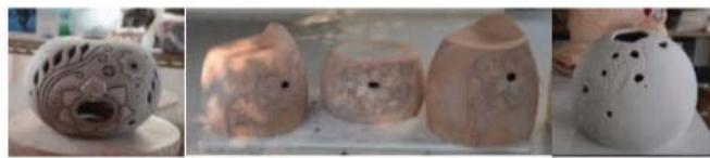
ภาพที่ 5 ภาพบางส่วนของการกระบวนการทางเครื่องปั้นดินเผา