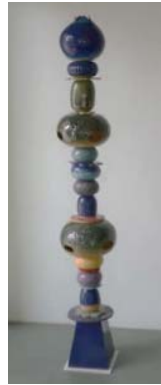
ภาพที่ 11 การติดตั้งโคมไฟ