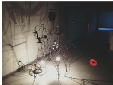
ภาพที่ 6 ชื่อผลงาน รักของแม่