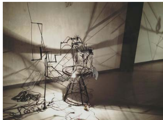
ภาพที่ 2 ผลงาน แย่งชิง