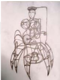
ภาพที่ 5 ภาพร่างผลงานรักของแม่

ผลงานสะท้อนรูปแบบความรักของแม่ที่เป็นความรักความผูกพันที่บริสุทธิ์อย่างแท้จริง คอยทะนุถนอมระแวดระวังสิ่งต่างๆที่อาจเป็นภัยอันตรายไม่ให้เข้ามาใกล้หรือกระทบกระเทือน เพื่อให้ลูกนั้นปลอดภัย ผลงานชุดนี้เลือกใช้เหล็กเส้นเชื่อมต่อกันเป็นโครงสร้างมือของแม่ที่เปรียบเหมือนเขี้ยวเล็บแหลมคม และอาวุธพร้อมที่จะปกป้องลูกจากอันตรายต่างๆที่เข้ามา