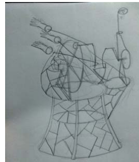
ภาพที่ 1 ภาพร่าง ผลงาน แย่งชิง

รูปทรงของฐานเลือกใช้รูปทรงของนาฬิกาทราย ที่มีความหมายถึงความไม่แน่นอน วัฏจักรของชีวิตที่ต้องดำเนินต่อไป ลายเส้นในฐานผลงานเลือกใช้เส้นเฉียง หรือ เส้นทะแยงมุม ทำให้เกิดความรู้สึกถึงการขัดแย้งของมนุษย์ สัญลักษณ์ที่เลือกใช้ในการสร้างสรรค์ผลงานชุดนี้ที่เกิดจากการวิเคราะห์แนวความคิดในการทำงานตรงกับความรู้สึกที่สุดคือรูปสัญลักษณ์มือและเมื่อรวมเข้ากับการเคลื่อนไหวของมอเตอร์ที่รวดเร็วแล้วจึงทำให้สามารถรับรู้ถึงการแก่งแย่งชิงดีกันของมนุษย์ในสังคม นอกจากนั้น ยังใช้ แสง สี เพื่อให้เกิดการเคลื่อนไหวของเงาทำให้เกิดบรรยากาศที่หลากหลายทำให้เกิดผลงานที่โดดเด่นและน่าสนใจ