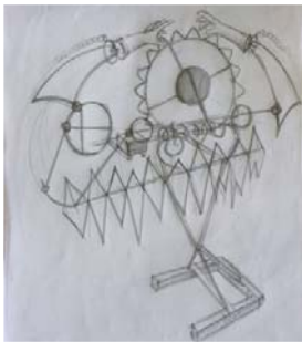
ภาพที่ 3 ภาพร่างผลงานชื่อไชว์ควัว

ผลงานสะท้อนถึง ความรักที่ผิดหวัง มีอุปสรรคขัดขวาง มีฐานเป็นรูปทรงที่มีโครงสร้าง ประกอบกันของเส้นทะแยง ทำให้เกิดความรู้สึกถึงการขัดแย้ง ผลงานชุดนี้ผสมผสานรูปร่างวงกลม ที่ถูกขับเคลื่อนด้วยมอเตอร์ไฟฟ้า และเส้นที่เชื่อมโยงถึงกันเป็นหนามประกอบเข้าเป็นโครง สื่อถึง อุปสรรคต่างๆ มีโซ่มาล่ามไว้เพื่อคอยเหนี่ยวรั้งเอาไว้ สัญลักษณ์ที่เลือกใช้ในการสร้างสรรค์ผลงาน ชุดนี้เกิดจากภาวะหวั่นไหวแนวความคิดในการทำงานสัญลักษณ์ที่เลือกใช้ตรงกับความรู้สึกที่สุดคือ สัญลักษณ์มือ 2 มือ ที่เคลื่อนไหวเข้า ออกหากันของหญิง ชาย ที่พยายามดิ้นรนที่จะได้อยู่ร่วมกัน นอกจากนั้นยังใช้ แสง สี เพื่อให้เกิดการเคลื่อนไหวของแสง และ เงา ทำให้เกิดบรรยากาศที่หลากหลายทำให้เกิดผลงานที่โดดเด่นและน่าสนใจ