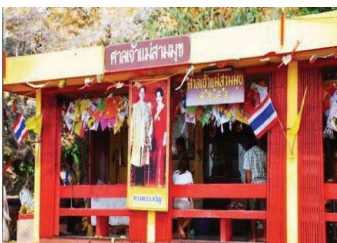
ภาพที่ 15 ศาลเจ้าแม่สามมุข จังหวัดชลบุรี

ตำนานเจ้าแม่สามมุขแสดงบทบาทความสำคัญของตำนานกับภูมินามในจังหวัด ชลบุรี สมัยอยุธยา เมืองบางปลาสร้อย วัฒนธรรมคนไทยเชื้อสายจีนมีความสัมพันธ์กันเนื่องจากการสร้างศาลเจ้าแม่สามมุขทั้งไทยและจีนอยู่ในบริเวณเดียวกัน เมืองท่าชายทะเล วัฒนธรรมตะวันตก และสมัยรัตนโกสินทร์