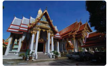
ภาพที่ 4 วัดศรีมหาราชา จังหวัดชลบุรี

3. ตำนานพระนางแหลมเทียนและพระเจ้าอุทอง 16 ปราภฏในตำนานอำเภอสัตหีบ ตามตำนานเล่าว่ามีกษัตริย์องค์หนึ่งชื่อพระเจ้าอุทอง ได้เสด็จมาในป่าพร้อมมหาดเล็กคนหนึ่งได้พบ บ่อน้ำสองบ่อ บ่อหนึ่งเป็นน้ำกรด อีกบ่อหนึ่งเป็นน้ำทิพย์ ปราภฏคำอธิบายที่ปากบ่อว่า ผู้ใดลงไป ใน บ่อน้ำกรด เมื่อตายจะมีฟองขึ้นมา เมื่อตักฟองนั้นมาใส่ในบ่อน้ำทิพย์ ผู้นั้นจะกลับมีชีวิตและมีรูป งามกว่าเดิม พระเจ้าอุทองจึงตกลงกับมหาดเล็กจะลงไปบ่อน้ำกรดก่อน แล้วให้มหาดเล็กตักฟอง ไปใส่ในบ่อน้ำทิพย์ ก็ฟื้นคืนชีพกลับเป็นผู้มีรูปร่างงาม ครั้นเมื่อมหาดเล็กลงไปบ่อน้ำกรดบ้างพระเจ้า อุทองกลับไม่ช่วยแล้วเดินทางจากไป