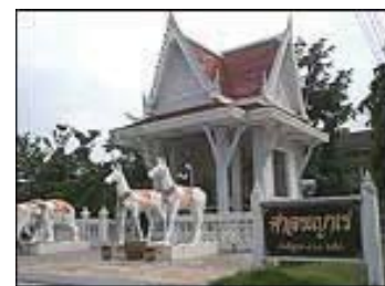
ภาพที่ 12 ศาลพระยาเระ จังหวัดชลบุรี

7. ตำนานเมืองศรีพะโล ตำนานเมืองศรีพะโลกล่าวว่าเป็นเมืองทำมีเรือสำเภาของต่างชาติมาติดต่อค้าขายเป็นประจำ เรือสินค้ามักถูกเศรษฐีเจ้าเมืองใช้อุบายคดโกงเอาสินค้าไป โดยให้คนของตนแอบนำของมีค่าไปซ่อนไว้ในเรือสินค้า แล้วกล่าวหาว่าพ่อค้าขายของนั้นไป แล้วขอ