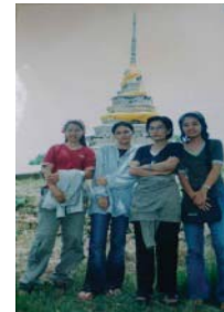
ภาพที่ 10 เนินดินเมืองพระรถ จังหวัดชลบุรี

6. ตำนานเมืองพระยาเระ ตำนานเมืองพญาเระ มีตำนานเล่าว่าพระยาโคกราชมหันต์ ปกครองอินทรีปัตถนครในอารยธรรมขอม ตั้งอยู่ทางทิศใต้ของอาณาจักรโคตรบูรณ และพระยาแกรก ทางฝั่งตะวันออกของอ่าวไทยและใกล้กับละโว้และพิมาย เป็นเมืองทำดีทะเลใกล้กับปากน้ำบางปะกง สันนิษฐานว่าอาจเกี่ยวข้องกับเมืองพระรถหรือเมืองศรีพะโล นครอินทรีปัตถาเริ่มสร้างแล้วก็มาร้าง แล้วเริ่มมาสร้างใหม่โดยพระเจ้าสุทนต์น29 เมื่อประมาณปี พ.ศ.1300 แล้วก็ร้างอีก เพราะน้ำท่วมและถูกพระเจ้าอนุรุทแห่งพุกามในอารยมอญรุกราน ซากเมืองชั่วคราวค้นพบอยู่ที่ริมหมู่บ้านคลองหลวง ขุดพบศพอายุ 1,300 ปีและพบเมืองพระยาเระซึ่งมีอายุเก่าแก่กว่าเมืองพระรถและเมืองศรีพะโลมาก เมืองพระยาเระมีซากเมืองอยู่ห่างจากตลาดดอนพนมประมาณ 6 กิโลเมตรตามข้อสันนิษฐานพระยาเระรวบรวมพลเมืองมาสร้างยังไม่ทันเสร็จ ก็เกิดโรคระบาดบ้าง น้ำท่วมบ้าง จึงกลายเป็นเมืองร้างไป 30 ตำนานเมืองพระยาเระแสดงความสำคัญของตำนานกับภูมินามในจังหวัดชลบุรี เมืองอินทรีปัตถาและวัฒนธรรมขอม เมืองพระรถ อาณาจักรโคตรบูรณ พระยาแกรก พระเจ้าอนุรุทแห่งพุกามและเมืองศรีพะโล