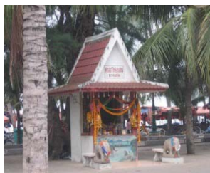
ภาพที่ 16 ศาลเจ้าพ่อแสน จังหวัดชลบุรี