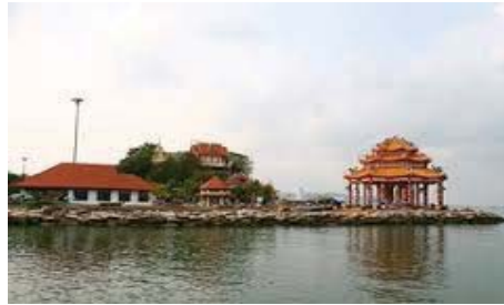
ภาพที่ 3 วัดศรีมหาราชาเกาะลลয় จังหวัดชลบุรี

ตำนานเมืองนครศรีธรรมราชและเมืองเพชรบุรี ได้บันทึกเรื่องราวของเจ้าศรีมหาราชาไว้ อย่างต่อเนื่องมากที่สุด ในส่วนที่เกี่ยวข้องกับวัฒนธรรมมอญ ลังกา และขอมกล่าวถึงในตำนาน พระธาตุเมืองนครศรีธรรมราช และตำนานเมืองนครศรีธรรมราชได้กล่าวถึง “ผชาวอริยพงศ์จาก เมืองหงสาวดีซึ่งใช้ลำภาจะไปลังกา ลำภาแตกมาขึ้นฝั่งที่ปากพอง ภูเขาศรีธรรมมาโคกราชจึงให้ กลับไปยังหงสาวดี นิมนต์สงฆ์มาขังนครศรีธรรมราชสององค์คือ มหาปเรียนทศศรี และมหาเถรสัง จานุเทพเพื่อช่วยก่อสร้างพระธาตุ เมื่อเสร็จแล้วได้ไปนิมนต์สงฆ์มาจากลังกาทำพิธีฉลองพระธาตุ” ตำนานยังได้กล่าวถึงความสัมพันธ์กับนครอินทปัตบุรี โดยที่ภูเขาศรีธรรมมาโคกราช ภูเขาจันทร์ภาณุ และภูเขาพงศ์สุวาระ ซึ่งข้างต้นดงหนี่ใช้ท่ามาจากนครอินทปัตบุรี 15 นอกจากนี้จะกล่าวถึง อาณาจักร ศรีอยุธยาแล้วยังมีความสัมพันธ์กับวัฒนธรรมคนไทยเชื้อสายจีนและเมืองท่าชายทะเลรอบอ่าวไทย