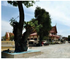
ภาพที่ 14 วัดศรีพะโล จังหวัดชลบุรี

8. ตำนานเจ้าแม่สามमुख ตำนานเกี่ยวกับสาวชาวบ้านชื่อสามมุขอาศัยอยู่กับยาย ที่บ้านบางปลาสร้อย พบรักกับชายหนุ่มชื่อแสนลูกกำนันโดยมีสาวเป็นสื่อรัก เนื่องจากสาวสามมุข เก็บกวาดที่แสนเล่นไว้ได้ เพราะความแตกต่างระหว่างชนชั้นและฐานะทำให้เกิดโศกนาฏกรรม สามมุข ต้องโดดหน้าผาตายเพราะแสนไปแต่งงานกับหญิงอื่น 33