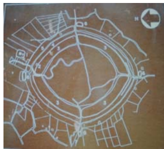
ภาพที่ 7 แผนผังเมืองดงละคร จังหวัดนครนายก

มีอาชีพตัดพื้นหาเถาวัลย์ขาย วันหนึ่งไปหาของป่าพบเถาวัลย์มากมายจึงตามเถาวัลย์ไปจนหลงเข้าไปยังเมืองลับแลหาทางกลับออกมาไม่ได้ ได้พบสาวสวยและได้อยู่กินกันจนมาลูก และดำรงชีวิตอยู่ในเมืองลับแล ซึ่งมีความอุดมสมบูรณ์ ผู้คนมีศีลธรรมถือปฏิบัติเคร่งครัดโดยเฉพาะศีลข้อมุสา วันหนึ่งภรรยาไม่อยู่ต้องดูแลลูก เมื่อลูกร้องปლობเท่าไรไม่ฟังจึงปลั่งปากหลอกลูกว่า “นั่นแม่มาแล้ว” เพื่อให้ลูกหยุดร้อง ครั้นภรรยากลับมาทราบความว่าสามีได้ทำผิดกฎเกณฑ์ของเมือง จึงจำใจให้สามีออกจากเมือง โดยภรรยามอบห่อผ้าให้สองห่อพร้อมกำชับให้แก้ห่อผ้าก็ต่อเมื่อถึงบ้านเรือนตนแล้ว เมื่อออกจากเมืองมาแวะใกล้หนองน้ำแห่งหนึ่งอยากรู้ว่าเมียให้อะไรมาจึงแก้ห่อผ้าดูเห็นเป็นทรายจึงเททิ้ง แล้วดูใจคิดจึงเหลืออีกห่อหนึ่งมาเปิดที่บ้านพบว่า เป็นทองคำ จึงได้นำทองไปขายเลี้ยงตัวและมารดาตลอดชีวิต ได้สร้างวัดขึ้นบริเวณที่ตนแก้ห่อผ้าพบทรายแล้วเททิ้ง เรียกวัดหนองทองทรายซึ่งปัจจุบันอยู่ทางทิศตะวันตกเฉียงใต้ของดงละคร 25 ตำนานเมืองดงละครแสดงความสำคัญของตำนานกับภูมินามในจังหวัดนครนายก วัฒนธรรมขอมที่เมืองอินทปัตถา อาณาจักรศรีอยุธยา เมืองศรีมโหสถ สมัยรัตนโกสินทร์ และเมืองท่าชายทะเลในภาคตะวันออก