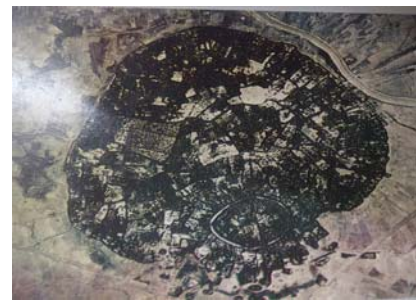
ภาพที่ 8 การขุดแต่งเมืองดงละคร จังหวัดนครนายก

5. ตำนานเมืองพระรถ พระรถมาจากชื่อพระรถเสน โอรสพระเจ้ารถสิทธิ์แห่งกุตารนคร เกิดจากนางเกาน้องคนสุดท้ายในเรื่องนางสิบสอง ตามตำนานเล่าว่าเดิมนางสิบสองเป็นลูกเศรษฐีแห่งบ้านสมิทคาม ได้นำลูกสาวทั้งสิบสองคนไปทิ้งไว้ในป่า ลูกทั้งสิบสองได้ระเห่ร่อนไปจนถึงเมืองนางยักษ์สันธมาร จึงได้นำนางสิบสองไปเลี้ยงดูอย่างน้องสาวโดยปิดบังไม่ให้อำนาจยักษ์ ต่อมาเมื่อนางสิบสองรู้เข้าจึงหนีไปจนถึงเมืองกุตารนครและได้เป็นมเหสีของพระเจ้ารถสิทธิ์ทั้งสิบสองคน ฝ่ายนางยักษ์โกรธนางสิบสองมากจึงได้แปลงกายเป็นหญิงงาม จนได้เป็นมเหสีของพระเจ้ารถสิทธิ์ จากนั้นได้หาทางกำจัดนางสิบสอง โดยส่งไปขังไว้ในถ้ำกลางป่า ในขณะที่มีครุภักแล้ว ส่วนตนเองแกล้งทำเป็นป่วยต้องกินลูกตานางสิบสองจึงจะหาย นางสิบสองจึงถูกควักลูกตาทั้งสองข้าง ยกเว้นนางเกาน้องคนสุดท้าย ถูกควักตาเพียงข้างเดียว ด้วยความอดอยากพี่น้องทั้งสิบเอ็ดคน ต้องกินเนื้อลูกตนเองแต่นางเกาเก็บส่วนแบ่งของตนไว้ พอตนเองคลอลูกก็พยายามเลี้ยงลูกจนโต พอ