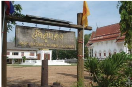
ภาพที่ 4 วัดอู่ทอง จังหวัดปราจีนบุรี

4. ตำนานเมืองดงละคร กรมศิลปากรได้ประกาศขึ้นทะเบียน เป็นโบราณสถานแห่งชาติเมื่อวันที่ 8 มีนาคม พ.ศ.2478 ตั้งอยู่ที่ตำบลดงละครเดิมเรียกกันว่า “เมืองลับแล” เป็นสถานที่ตั้งเมืองโบราณสมัยขอมมีอำนาจ มีแนวกำแพงเป็นเนินดินและคูเมืองปรากฏอยู่ ชาวบ้านเรียกกันว่า “สันคูเมือง” มีคูน้ำล้อมรอบซึ่งเป็นแบบเมืองทวารวดีทางภาคกลางของไทย ความรุ่งเรืองที่เด่นชัดแบ่งเป็นสองช่วง ช่วงแรกเริ่มในราวพุทธศตวรรษที่ 14-16 เป็นวัฒนธรรมแบบทวารวดี ช่วงที่สองราวพุทธศตวรรษที่ 17-19 เป็นวัฒนธรรมขอมและวัฒนธรรมก่อนกรุงศรีอยุธยา สันนิษฐานว่า น่าจะมีความสำคัญเกี่ยวข้องกับเมืองศรีมโหสถซึ่งอยู่ห่างกันประมาณ 55 กิโลเมตร เมืองดงละครนี้มีลักษณะเป็นเมืองท่ามีความสัมพันธ์กับชุมชนเมืองชายทะเลอื่นๆ ตำนานเมืองลับแลนั้นยังเล่ากันว่าเมืองนี้เคยเป็นเมืองของราชินีขอมซึ่งเป็นที่รื้อฐาน ผู้อื่นไม่สามารถเข้าออกได้ ประกอบกับลักษณะของบริเวณเมืองมีไม้ใหญ่ขึ้นอยู่ทั่วไป ใครเข้าไปแล้วอาจหาทางออกไม่ได้ จะต้องวนเวียนอยู่ในดงนั่นเอง และในวันโกนวันพระจะได้ยินเสียงกระຈပ်ปี ซอ ปีพาทย์ มโหรีขับกล่อม คล้ายกับมีการเล่นละครในวัง ชาวบ้านจึงเรียกกันว่า “ดงละคร” หรืออีกนัยหนึ่ง คำว่า “ดงละคร” นั้นอาจเพี้ยนมาจาก “ดงนคร” 23 นอกจากนี้ยังได้กล่าวถึงความสัมพันธ์ของเมืองดงละครในพงศาวดารเมืองเหนือเมื่อครั้งนครธรรมเป็นเมืองหลวง ต่อมาเมื่ออำนาจของนครธรรมเสื่อมลงหัวเมืองในไทยก็ตั้งตัวเป็นใหญ่ สมัยอยุธยาและรัตนโกสินทร์ 24