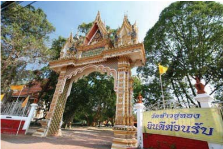
ภาพที่ 5 วัดทำอู่ทอง จังหวัดปราจีนบุรี

ปราจีนบุรี เป็นวัดเก่ามีอายุประมาณ 600 ปีสร้างเพื่อนมัสการพระพุทธเจ้าทั้ง 4 องค์ทรงพระนามว่า พระกกุสันธุพุทธเจ้า พระโกนาคมพุทธเจ้า พระกัสสปพระพุทธเจ้า พระศากยมนีโคดมพุทธเจ้า โดยมีตำนานเล่าว่า ตายายจากสุพรรณบุรีใช้เกวียนเดินทางมาถึงตำบลโคกไม้ลายแล้วสร้างวัดตั้งแต่สมัยพระเจ้าอู่ทอง เมื่อสร้างวัดเสร็จได้ส่งข่าวไปบอกพระเจ้าอู่ทอง พระเจ้าอู่ทองศรัทธาให้เงินเพิ่มอีก 10 เท่าตัว ตายายเลยตั้งชื่อวัดเป็นเกียรติแก่พระเจ้าอู่ทอง 22 ตำนานพระนางแหลมเทียนและพระเจ้าอู่ทองยังมีความสัมพันธ์กับตำนานเมืองนครศรีธรรมราช พงศาวดารกรุงศรีอยุธยา ตำนานเมืองโคตรตะบอง และวัฒนธรรมคนไทยเชื้อสายจีนดังที่กล่าวถึงแล้วข้างต้น