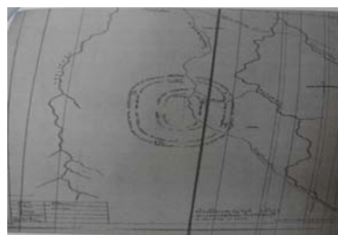
ภาพที่ 11 แผนผังเมืองพระยาเระ จังหวัดชลบุรี

6. ตำนานเมืองพระยาเระ ตำนานเมืองพญาเระ มีตำนานเล่าว่าพระยาโคกราชมหันต์ ปกครองอินทรีปัตถนครในอารยธรรมขอม ตั้งอยู่ทางทิศใต้ของอาณาจักรโคตรบูรณ และพระยาแกรก ทางฝั่งตะวันออกของอ่าวไทยและใกล้กับละโว้และพิมาย เป็นเมืองทำดีทะเลใกล้กับปากน้ำบางปะกง สันนิษฐานว่าอาจเกี่ยวข้องกับเมืองพระรถหรือเมืองศรีพะโล นครอินทรีปัตถาเริ่มสร้างแล้วก็มาร้าง แล้วเริ่มมาสร้างใหม่โดยพระเจ้าสุทนต์น29 เมื่อประมาณปี พ.ศ.1300 แล้วก็ร้างอีก เพราะน้ำท่วมและถูกพระเจ้าอนุรุทแห่งพุกามในอารยมอญรุกราน ซากเมืองชั่วคราวค้นพบอยู่ที่ริมหมู่บ้านคลองหลวง ขุดพบศพอายุ 1,300 ปีและพบเมืองพระยาเระซึ่งมีอายุเก่าแก่กว่าเมืองพระรถและเมืองศรีพะโลมาก เมืองพระยาเระมีซากเมืองอยู่ห่างจากตลาดดอนพนมประมาณ 6 กิโลเมตรตามข้อสันนิษฐานพระยาเระรวบรวมพลเมืองมาสร้างยังไม่ทันเสร็จ ก็เกิดโรคระบาดบ้าง น้ำท่วมบ้าง จึงกลายเป็นเมืองร้างไป 30 ตำนานเมืองพระยาเระแสดงความสำคัญของตำนานกับภูมินามในจังหวัดชลบุรี เมืองอินทรีปัตถาและวัฒนธรรมขอม เมืองพระรถ อาณาจักรโคตรบูรณ พระยาแกรก พระเจ้าอนุรุทแห่งพุกามและเมืองศรีพะโล