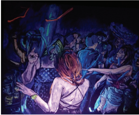
ภาพที่ 4 : “พลังแห่งแสงยามคำคืน 2”

ในผลงานชิ้นที่ 2 นี้ข้าพเจ้าได้นำเสนอรูปทรงของผู้คนที่กำลังแสดงออกทางท่าทางที่ทำให้ผู้ชมรับรู้ถึงเคลื่อนไหวมากกว่าชิ้นที่ 1. โดยนำเสนอที่ตัวผู้คนเป็นหลัก ลวดเรื่องของวัตถุสิ่งแวดล้อมออกไปโดยจะเหลือไว้เพียงแค่แสงกับกลุ่มผู้คน ซึ่งสอดคล้องกับวัตถุประสงค์ทางแนวความคิด เส้นที่แสดงขอบเขตของรูปทรง เป็นเส้นแสดงขอบเขตของพื้นที่ว่างกับรูปทรง คือเส้นรอบนอกรูปทรงของผู้คนและรูปทรงของวัตถุของสภาพแวดล้อม เส้นที่แสดงแกนโครงสร้าง เป็นเส้นที่มองไม่เห็นด้วยตาเป็นเส้นที่ต้องใช้จินตนาการเป็นตัวกำหนดเส้นแกนของรูปทรงคนให้ดูเคลื่อนไหวที่ไม่หยุดนิ่งแสดงถึงความเคลื่อนไหวของแสงที่สะท้อนกระทบตัวคน สีในการสร้างสรรค์ผลงานชิ้นที่ 2 นี้ สีที่ปรากฏจะนำมาจากการด้วยการระบายด้วยสีสะท้อนแสงลงบนแผ่นไม้ที่ทาสีขาวโดยส่วนที่ระบายสีสะท้อนแสงนั้นจะมุ่งเน้นการแสดงความเป็นสีที่มีการสะท้อนของแสงจากรูปทรงของมนุษย์ เพื่อสร้างบรรยากาศและมิติในผลงาน คำนำหน้าก่อนแกในผลงานชิ้นนี้ ยังคงเน้นคำนำหน้าที่แตกต่างกันระหว่างรูปทรงกับพื้นที่ว่าง เพื่อให้เกิดความเด่นของรูปทรงและเกิดความเคลื่อนไหวในผลงาน ลักษณะพื้นผิวของผลงานชิ้นนี้ที่สร้างขึ้นด้วยสีสะท้อนแสง โดยแสงที่ผิวของคน จะมีการทับซ้อนกันของสีสร้างความรู้สึกรู้สึกให้มีการเคลื่อนไหวของผิวมนุษย์