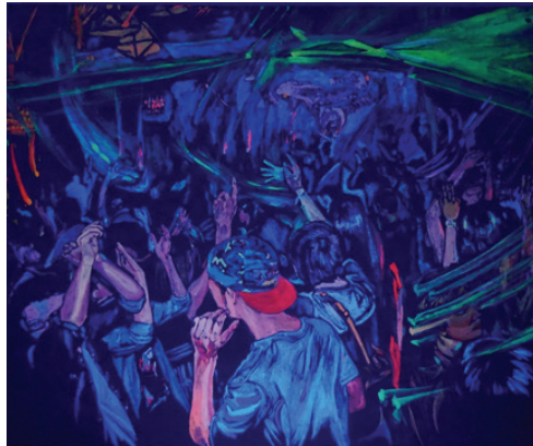
ภาพที่ 7 : “พลังแห่งแสงยามค่ำคืน 5”

ในผลงานชิ้นที่ 5 นี้ การใช้รูปทรงของผลงานมีความสอดคล้องกับการใช้รูปทรงของผลงานชุดที่ 3 คือมีการใช้รูปทรงคนเป็นหลัก และมีการใช้รูปทรงของแสงไฟเป็นรูปทรงรอง ในผลงานชิ้นนี้มีความหลากหลายของรูปทรงของแสงไฟที่สะท้อนกัน เช่น แสงไฟจากไฟเลเซอร์ ไฟคอม ไฟประดับสี อยู่ในรอบบริเวณ ขณะที่คนกำลังตีมี เพลิดเพลิน สนุกกับเสียงเพลงตามจังหวะ ของแสงที่สาดส่อง สะท้อนกันบริเวณรอบ ให้ความสนุกสนานและเกิดความเคลื่อนไหวในผลงาน เส้นแสดงขอบเขตของรูปทรงและแสงไฟสะท้อน เป็นเส้นที่แสดงขอบเขตพื้นที่ว่างกับรูปทรง คือเส้นรอบนอกของรูปทรงหลักคือ รูปทรงของคน และรูปทรงรองคือรูปทรงของแสงไฟสะท้อนที่อยู่ในระยะหลังและระยะที่ไกลออกไปจากจุดเด่น เช่น แสงที่กระทบสะท้อนกันตัวผู้คนและแสงของไฟที่สะท้อนกันไปมา เส้นแกนที่แสดงโครงสร้าง เป็นเส้นที่ไม่ได้มองเห็นด้วยตา เป็นเส้นที่เกิดจากจินตนาการด้วยการสร้างเส้นแกน ซึ่งในผลงานชิ้นนี้ ประกอบด้วยเส้นแกนโครงสร้างของรูปทรง คือ รูปทรงคนที่มีลักษณะเป็นเส้นตรงในแนวตั้งที่ทับซ้อนกัน สีในผลงานยังคงเน้นการแสดงออกของแสงสี ที่สะท้อนกระทบกับมนุษย์และวัตถุ ในสถานบันเทิง เพื่อสร้างความดึงดูด น่าสนใจในผลงานแสดงถึงคนที่กำลังเคลื่อนไหวไปตามจังหวะของเสียงเพลงพร้อมกับแสงที่เคลื่อนไหวไปมา การวิเคราะห์คุณค่าและการแสดงออก