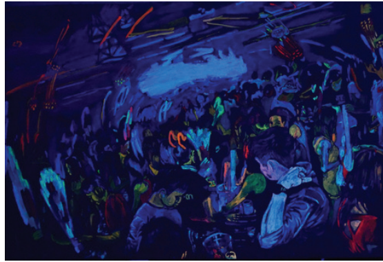
ภาพที่ 3 : “พลังแห่งแสงยามค่ำคืน”

ในผลงานของข้าพเจ้า มีการใช้ทัศนธาตุสำคัญเป็นหลักในการถ่ายทอดความเป็นนามธรรมของแนวความคิด ออกมาเป็นรูปธรรมที่สามารถสัมผัส รับรู้ได้ คือ รูปทรง เส้น สี น้ำหนัก พื้นผิว โดยจะมีการวิเคราะห์ทัศนธาตุเป็นส่วนๆ ดังต่อไปนี้