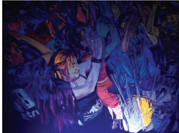
ภาพที่ 5 : “พลังแห่งแสงยามค่ำคืน 3 ”

ในผลงานชิ้นที่ 3 นี้ ข้าพเจ้าได้พัฒนาการใช้รูปทรงจากผลงานชิ้นที่ 2 ซึ่งมีการเน้นให้เห็นภาพคนมากกว่ารูปทรงของวัตถุเพียงอย่างเดียว โดยนำรูปทรงของวัตถุมานำเสนอให้มากขึ้น และแสดงท่าทางของคนมากขึ้น การแสดงออกทางอารมณ์ของคนที่สนุกสนานมากขึ้น เส้นแสดงขอบเขตของรูปทรงเป็นเส้นที่แสดงของเขตของพื้นที่ว่างกับรูปทรง เส้นรอบนอกของรูปทรงคนและรูปทรงของวัตถุ เช่น ถังเครื่องดื่ม แก้ว ชันวางเครื่องดื่ม เส้นแกนที่แสดงโครงสร้าง เป็นเส้นที่มองไม่เห็นด้วยตา เป็นเส้นที่ต้องใช้จินตนาการเป็นตัวกำหนดเส้นแกนโดยในผลงานชิ้นที่ 3 นี้ประกอบด้วยเส้นแกนที่แสดงโครงสร้างของรูปทรงคนซึ่งเป็นรูปทรงหลักที่เป็นเส้นเอียง แสดงถึงความเคลื่อนไหวทำให้เกิดจังหวะ สีในการสร้างสรรค์ผลงาน ยังคงเน้นการแสดงออกของแสงสี ที่สะท้อนกระทบกับมนุษย์และวัตถุ ในสถานบันเทิง เพื่อสร้างความดึงดูด น่าสนใจในผลงาน โดยผลงานชิ้นนี้มีการใช้ค่าที่แตกต่างกันของรูปทรงหลัก คือรูปทรงคน รูปทรงรองคือรูปทรงของวัตถุ กับค่าน้ำหนักของพื้นหลังที่มีระยะไกล ซึ่งมีการสลับค่าน้ำหนักสร้างความเด่น และความกลมกลืนในผลงาน พื้นผิวในผลงานจะใช้สีสร้างพื้นผิวที่จะไม่ทับซ้อนกันมากนักเพื่อให้ผลงานสะท้อนกับแสงได้ดี และชัดเจนมากขึ้น