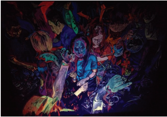
ภาพที่ 6 : “พลังแห่งแสงยามคำคืน 4 ”

ในผลงานชิ้นที่ 4 นี้ การใช้รูปทรงของผลงานมีความสอดคล้องกับการใช้รูปทรงของผลงานชุดที่ 3 คือมีการใช้รูปทรงคนเป็นหลัก และมีการใช้รูปทรงของวัตถุเป็นรูปทรงรอง ในผลงานชิ้นนี้มีความหลากหลายของรูปทรงของวัตถุ เส้นที่แสดงขอบเขตของรูปทรง เป็นเส้นที่แสดงขอบเขตพื้นที่ว่างกับรูปทรง คือเส้นรอบนอกของรูปทรงหลักคือ รูปทรงของคน และรูปทรงรองคือ รูปทรงของคนที่อยู่ในระยะหลังและระยะที่ไกลออกไปจากจุดเด่น เช่น แสงที่กระทบสะท้อนกันตัวผู้คนและแสงของไฟที่สะท้อนกันไปมา เส้นแกนที่แสดงโครงสร้างรูปทรงคนที่มีลักษณะเป็นเส้นตรงในแนวตั้งที่ทับซ้อนกัน แสดงถึงความเคลื่อนไหว สนุกสนานเคลื่อนไหวไปในทางเดียวกัน และอีกส่วนเป็นรูปทรงของมือที่แสดงถึงความเคลื่อนไหว ล่องลอย ไปในทางเดียวกันโดยชิ้นนี้เป็นผลงานเกิดจากการสร้างสรรค์ด้วยการระบายสีสะท้อนแสงเหมือนกับผลงานที่ผ่านมา ยังคงเน้นการแสดงออกของแสงสีที่สะท้อนกระทบกับมนุษย์และวัตถุ ในสถานบันเทิง เพื่อสร้างความดึงดูด น่าสนใจในผลงานแสดงถึงคนที่กำลังเคลื่อนไหวไปตามจังหวะของเสียงเพลงพร้อมกับแสงที่เคลื่อนไหวไปมา โดยเนื้อหาของรูปทรงหลัก คือรูปทรงของผู้คนตรงกลางผลงานจะใช้น้ำหนักที่ชัดเจนกว่า ลดความแรงของค่าน้ำหนักที่อ่อนของรูปทรงผู้หญิงรวมทั้งยังสร้างความกลมกลืนให้กับบรรยากาศของน้ำหนักโดยรวมของผลงาน