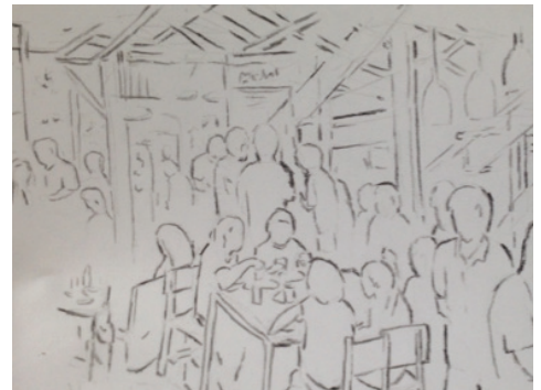
ภาพที่ 1 : การร่างภาพรวมๆ โดยไม่เน้นรายละเอียดมากนักและการกำหนดพื้นที่ในการวางรูปแบบ