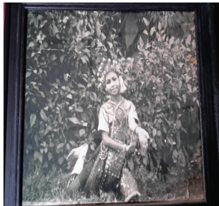
ภาพที่ 3 การแต่งกายละครชาตรี ในชุด “อุยฉายพราหมณ์”

ระยะต่อมาประมาณ พ.ศ.2486 การปักเครื่องละครพัฒนามาใช้ดินข้อดินโปรง ปักลายกนกและลายเครือเถา บางคณะจะมีการปักที่ผ้าสไบด้วย ในขณะนี้การนุ่งผ้าของตัวนางจะเปลี่ยนแบบไปจากการนุ่งโจงกระเบนเป็นนุ่งแบบจีบหน้านาง ส่วนผ้าลายไทยก็เปลี่ยนเป็นผ้าเกี่ยวและผ้าสอดดินจะใช้ผ้ายกเฉพาะงานสำคัญๆ หรืองานใหญ่ๆ บ้างก็ห่มผ้าห่มนางทับเสื้อแขนสั้นตัวในแทนการห่มผ้าสไบทับเสื้อแขนยาว เครื่องประดับศีรษะบางที่ก็สวมรัดเกล้ายอด-จอนหู สำหรับเครื่องแต่งกายตัวพระจะมีการใช้เสื้อปักแขนยาวมีอินทนูที่หัวไหล่และสวมถุงเท้าขาวยาว การแต่งกายทั้งตัวพระ-ตัวนาง จะมีเครื่องประดับจวนครบ เช่น เข็มขัดพร้อมหัวเข็มขัด กำไลข้อมือ กำไลข้อเท้า ทับทรวง สร้อยสังวาล สร้อยสะอั้ง เป็นต้น