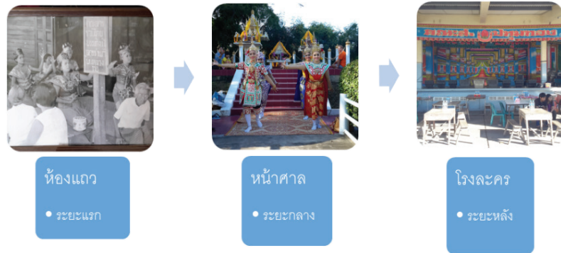
ภาพที่ 4 แสดงการเปลี่ยนด้านสถานที่ในการแสดงละครชาตรีในจังหวัดฉะเชิงเทรา

ในสมัยก่อนมีผู้ว่าจ้างให้ไปทำการแสดงละครชาตรีมาก จึงส่งผลให้มีงานแสดงละครสมำเสมอ บางช่วงที่มีงานมาก คือช่วงหลังออกพรรษา เดือนพฤศจิกายน เดือนธันวาคม เดือนมกราคม ถึงเดือนกุมภาพันธ์จะมีผู้ว่าจ้างให้ไปเล่นละครเกือบทุกวันในพื้นที่เขตจังหวัดใกล้เคียง เช่น จังหวัดชลบุรี จังหวัดปราจีนบุรี จังหวัดนครนายก เนื่องจากจังหวัดเหล่านี้ไม่มีคณะละครชาตรีเก็บเงิน ส่วนใหญ่ที่มีผู้ว่าจ้างให้ไปแสดงเพื่อแสดงแก้สืบบนโดยเฉพาะในจังหวัดฉะเชิงเทรา ชาวบ้านนิยมอาชีพเลี้ยงกุ้งกุลดา เจ้าของฟาร์มกุ้งก็จะทำการบ่นไว้ให้ได้กำไร เมื่อจับกุ้งในแต่ละครั้งและได้กำไรดี ก็จะมีผู้ว่าจ้างคณะละครไปแสดงเพื่อเป็นการแก้สืบบน