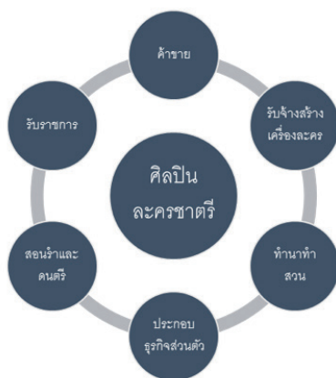
ตารางที่ 2 แสดงการปรับตัวเพื่อสอดคล้องกับสภาพการเปลี่ยนแปลง