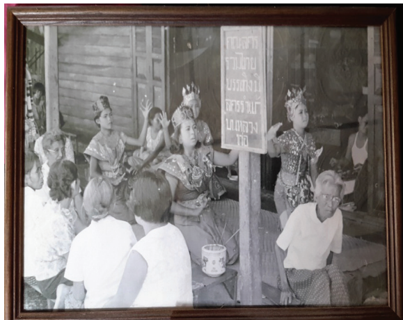
ภาพที่ 1 ภาพการรำแก้สับบนของคณะรวมไทยบันเทิงเมื่อครั้งยังเป็นห้องแถว

1. ความเป็นมาและพัฒนาการของศิลปะการแสดงละครชาตรี จังหวัดฉะเชิงเทรา ศิลปะการแสดงละครชาตรี มีพัฒนาการแรกเริ่มมาจากการรวมตัวของกลุ่มชาวบ้านที่ต้องการรำถวายองค์พระพุทธรูปองค์หนึ่งนั่นคือ “หลวงพ่อโสธร” เป็นการบูชาเมื่อครั้งที่ชาวบ้านร่วมกันนำพระพุทธรูปองค์นี้ขึ้นมาจากแม่น้ำบางปะกง ซึ่งในระยะแรกนั้นเกิดการก่อตั้งเป็นคณะละครชาตรีขึ้นมา คือ คณะพรพิทักษ์ลูกโสธร คณะรวมไทยบันเทิง และคณะร.รัตนศิลป์ ซึ่ง 3 คณะนี้ถือกำเนิดและก่อตั้งในเวลาไล่เลี่ยกันโดยมีการจับฉลากว่าใครจะได้เป็นคณะที่ 1 คณะที่ 2 และคณะที่ 3 ผลจากการจับฉลากปรากฏว่าคณะที่ 1 คือ คณะพรพิทักษ์ลูกโสธร คณะรวมไทยบันเทิงเป็นคณะที่ 2 และ คณะร.รัตนศิลป์เป็นคณะที่ 3 ตามลำดับ ส่วนคณะอื่นๆ คือคณะปราณีเพชรโสธรและคณะประจวบเจริญศิลป์ก็ก่อตั้งขึ้นมาภายหลัง