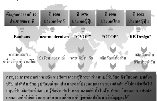
ภาพที่ 2 การบูรณาการอารมณ์ในการออกแบบ (Emotional design)

นอกจากนี้ ผู้วิจัยยังได้ทำการคิดค้นระบบ THRD หมายถึง แนวความคิดใหม่ที่ผู้วิจัยคิดขึ้นประกอบด้วยความหมาย 2 ประการคือ