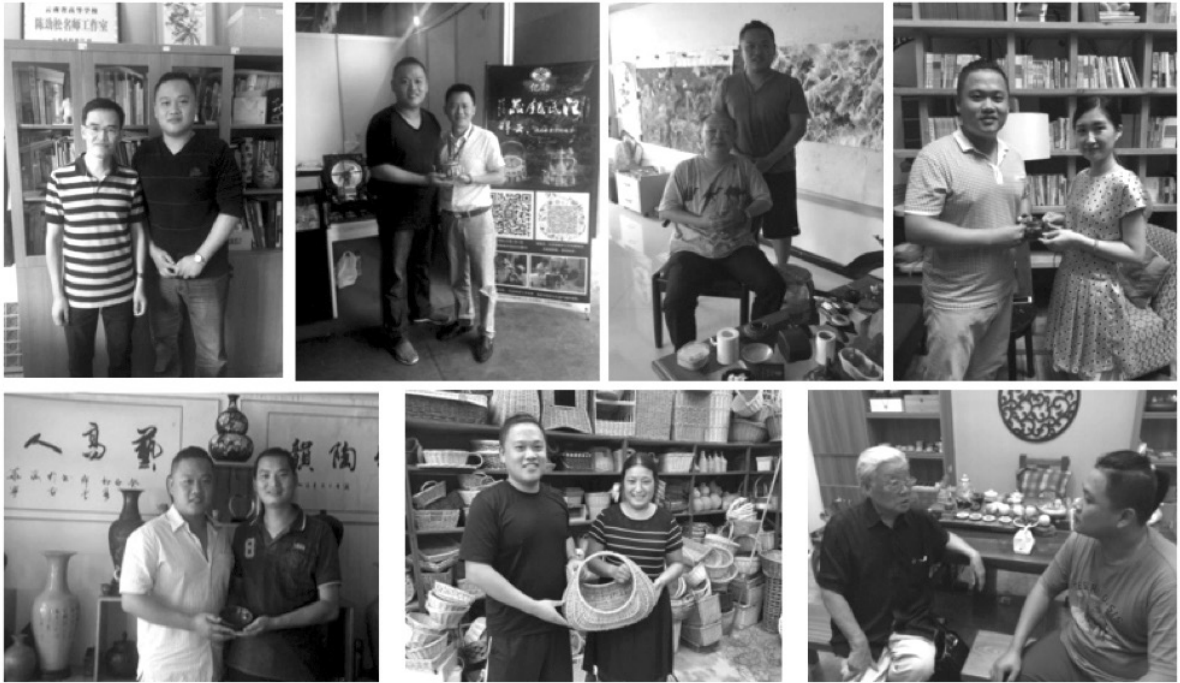
ภาพที่ 3 การสัมภาษณ์ผู้เชี่ยวชาญ

ทักษะหัตถกรรมไม่ให้ศูนย์หาย ลำดับต่อมา เราต้องชักชวนให้นักวิชาการในปัจจุบันเข้ามามีส่วนร่วมในการรณรงค์และอนุรักษ์หัตถกรรมแบบดั้งเดิมให้มากขึ้นโดยใช้ความสามารถทางวิชาการ ประสบการณ์ ปัญญา และความคิดสร้างสรรค์ของนักวิชาการและผู้เชี่ยวชาญเหล่านั้นมาช่วยผลักดันให้หัตถกรรมแบบดั้งเดิมได้รับการฟื้นฟู พัฒนา ปรับปรุงและสืบสานไปพร้อมๆ กับการเจริญเติบโตของเทคโนโลยี ปัจจุบันโลกของเราอยู่ภายใต้กระแสสังคมแบบโลกาภิวัตน์ซึ่งมีการตลาดแบบเปิดกว้างและระบบเศรษฐกิจถูกประสานเป็นหนึ่งเดียวกัน ดังนั้น ผู้วิจัยจึงได้ดำเนินการคิดค้น พัฒนาและออกแบบระบบ THRD เพื่อประยุกต์ใช้ในการอนุรักษ์วัฒนธรรมแบบดั้งเดิมและทดลองใช้งานจริงด้วยการการฟื้นฟูผลิตภัณฑ์ดั้งเดิมใหม่ตามแนวคิด “การออกแบบใหม่” (Re-Design) ด้วยการออกแบบผ่านความรู้สึก โดยเป็นการออกแบบผลิตภัณฑ์ที่ผสมผสานรูปแบบระหว่างเครื่องปั้นดินเผากับชุดที่เผาซึ่งต่างอุดมไปด้วยเอกลักษณ์ของประเทศจีนมีมูลค่าทางจิตวิญญาณและควรค่าแก่การพัฒนา ทั้งนี้ จากการศึกษาเครื่องปั้นดินเผายูนนานและชุดที่เผาเซียงไฮ้เพื่อทดลองระบบ THRD พบว่า เครื่องปั้นดินเผายูนนาน