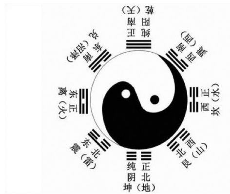
ภาพที่ 3 ภาพยันต์แปดทิศของผู้ชี

การวางผังแบบสมมาตรในศาสนสถานของศาสนาเต๋าได้รับแรงบันดาลใจจากแนวคิดหยินหยางอู่จิง ซึ่งตามแนวคิดนี้เส้นขีดเขียนในภาพยันต์แปดทิศของผู้ชีอยู่ทางใต้ ส่วนเส้นขีดคั่นอยู่ทางเหนือและเส้นจื่ออู่ (เส้นแนวเหนือใต้) เป็นเส้นแนวแกนหลัก (ภาพที่ 3) ดังนั้น ผู้ที่สร้างศาลเจ้ามักจะนิยมวางอาคารที่สำคัญหรือวิหารหลักอยู่บนเส้นแนวแกนหลักเส้นนี้ และให้อาคารเหล่านี้หันหน้าไปทางเหนือตามแนวเหนือใต้ แนวคิดหยินหยางถือทางใต้เป็นหยางและถือทางเหนือเป็นหยิน (Sun Zongwen, 2548, หน้า 42) ส่วนอาคารที่มีความสำคัญรองลงมาจะจัดอยู่ด้านซ้ายและด้านขวาของเส้นแนวแกนหลักตามแนวตะวันออกตะวันตก อาคารที่อยู่ด้านซ้ายและด้านขวาต้องมีรูปแบบและขนาดเดียวกันเพื่อให้สองข้างนี้มีความสมดุลกัน อาคารที่อยู่ด้านซ้ายและด้านขวาเป็นสัญลักษณ์ของเส้นขีดขานและเส้นขีดหลีในภาพยันต์แปดทิศ เนื่องจากเส้นขีดขานอยู่ทางตะวันออกและเส้นขีดหลีอยู่ทางตะวันตก