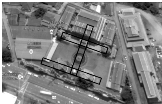
ภาพที่ 6 ตัวอักษรจีน 土 อยู่ในพื้นที่ส่วนกลาง

องค์พระแม่ธรณี เส้นขีดแนวตั้งจะเป็นเส้นแนวแกนหลัก การจัดวางกลุ่มอาคารแบบนี้อาจจะสอดคล้องกับแนวคิดดังกล่าวที่ว่า ธาตุดินอยู่พื้นที่ส่วนกลางของบ้านแบบชานเหยว่นและแบบชื้อเหยว่น (ภาพที่ 6)