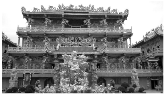
ภาพที่ 1 ศาลเจ้าหน้าจาช่าให้จื้อในตำบลอ่างศิลา อำเภอเมือง จังหวัดชลบุรี

รวมทั้งที่ดิน 36 ไร่ ศาลเจ้าหน้าจาช่าให้จื้อถือได้ว่าเป็นศาลเจ้าจีนที่ใหญ่มากแห่งหนึ่งในประเทศไทย (วันชัย แก้วไทรสุน.วันที่ 16 กันยายน พ.ศ.2559, สัมภาษณ์)