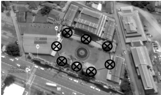
ภาพที่ 7 การวางผังตามภาพยันต์แปดทิศในพื้นที่ส่วนที่ 2

ลานอเนกประสงค์เก่า อาคารจำหน่ายของที่ระลึก หอกลอง หอระฆัง ศาลาพักผ่อนและศาลาที่ประดิษฐานองค์พระแม่ธรณี (ภาพที่ 7) ในสิ่งก่อสร้างเหล่านี้ สระเย็นศิระเพราะพระบริบาล ถือได้ว่าเป็นศูนย์กลางของผังและเป็นสัญลักษณ์ของวงกลมที่อยู่ตรงกลางของยันต์แปดทิศ นอกจากนี้ ในสระน้ำแห่งนี้ยังมีรูปเคารพที่เป็นองค์เทพเจ้าหน้าจาช่าไท้จื้อ ซึ่งสะท้อนให้เห็นว่าหน้าจาช่าไท้จื้อเป็นองค์เทพเจ้าประธานของศาลเจ้าแห่งนี้