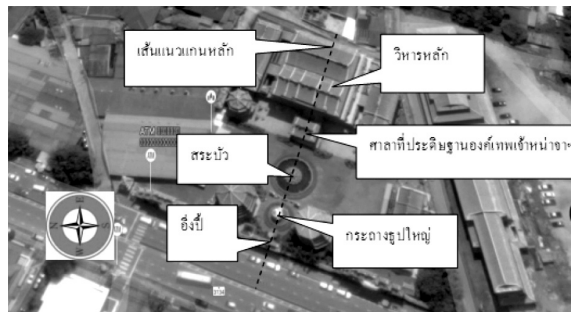
ภาพที่ 4 อาคารและสิ่งสำคัญที่อยู่บนเส้นแนวแกนหลัก

เมื่อผู้วิจัยสำรวจพื้นที่ส่วนที่ 2 ของศาลเจ้าหน้าจาช่าให้จื้อ ก็พบว่า เส้นแนวแกนหลักของศาลเจ้า ไม่ใช่เส้นแนวเหนือใต้ แต่เป็นแนวตะวันออกตะวันตก เหตุปัจจัยที่เส้นแนวแกนหลักทำเป็นแนวตะวันออกตะวันตกอาจจะเกี่ยวกับลักษณะภูมิประเทศและการอำนวยความสะดวกการเข้าออกศาลเจ้า แก่บรรดาลูกศิษย์ที่ศรัทธากับนักท่องเที่ยว อย่างไรก็ตาม นอกจากทิศทางต่างกับแบบแผนโบราณแล้ว การวางผังกลุ่มอาคารในพื้นที่ส่วนที่ 2 ของศาลเจ้า ยังใช้แบบสมมาตร ซึ่งกลุ่มอาคารและสิ่งสำคัญที่อยู่บนเส้นแนวแกนหลัก คือ อังปี้ (ผนังที่ด้านหน้ามีชื่อศาลเจ้าและด้านหลังมีรูปมังกรเก้าตัว) กระจ่างรูปใหญ่ที่ทำด้วยโลหะ สระเย็นศิระ เพราะพระบริบาล (สระบัว) ศาลาที่ประดิษฐานองค์เทพเจ้าหน้าจาช่าให้จื้อและวิหารหลัก (ภาพที่ 4)