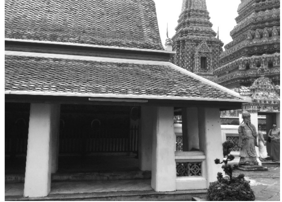
ภาพที่ 5 ศาลาแม่ชื่อ วัดพระเชตุพนวิมลมังคลาราม

ตำรายาที่ใช้กับเด็กแรกเกิดทั้งสิ้น เมื่อแสดงภาพเปรียบเทียบกับภาพจะพบลักษณะที่มีส่วนคล้าย และความแตกต่างในรายละเอียด บางส่วนซึ่งเป็นกระบวนการพัฒนาแบบหรือการบูรณะที่เกิดขึ้นในช่วงเวลาต่างกัน (ภาพที่ 6- ภาพที่ 13)