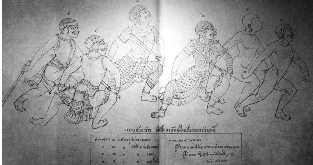
ภาพที่ 20 ภาพร่างต้นแบบของพระเทวากินีมิต