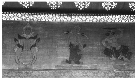
ภาพที่ 9 จิตรกรรมฝาผนังศาลาแม่ชื่อวัดพระเชตุพนฯ