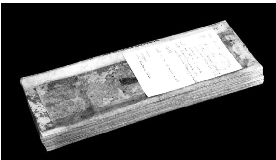
ภาพที่ 4 สมุดไทยชาวแสดงภาพร่างของชรวินโห่ง ที่มา: หอสมุดแห่งชาติ, หมวดตำราภาพ เลขที่ 17, ตำราร่างรูปภาพว่าด้วยรูปภาพมนุษย์ รูปภาพยักษ์ และลวดลายต่างๆ ของอาจารย์อินโห่ง วัตรราชบุรณะ.

ตัวอย่างกระดาษและการทำสมุดไทยตลอดจนการนำไปใช้ของช่าง แสดงถึงวัสดุของช่างเขียนที่จะสามารถเลือกใช้สมุดตามคุณภาพของกระดาษ สำหรับสมุดไทยที่มีการใช้งานเฉพาะบุคคล หรือเป็นสมุดสเกตซ์ของช่าง จะมีความพิเศษที่เป็นหลักฐานทางประวัติศาสตร์ที่อาจจะระบุชื่อหรือไม่โดยมีเนื้อหาที่มีความหลากหลาย อย่างเช่นสมุดไทยของช่างเขียนโบราณนามว่า ชรวินโห่ง (ภาพที่ 4) เป็นสิ่งสะท้อนความก้าวหน้าทางด้านพฤติกรรมของผู้สร้างสรรค์ กล่าวคือในช่วงเวลาที่ชรวินโห่ง มีชีวิตนั้นวิทยาการจากชาติตะวันตกเข้ามาสู่สยามอย่างมาก ความเป็นช่างที่มีความชำนาญในด้านงานเขียนได้พัฒนาผลงานจากภาพแบบสองมิติไปสู่ภาพที่แสดงความเป็นสามมิติ จากหลักฐานที่เป็นภาพร่างลายเส้นดินสอและเขียนทับด้วยหมึกดำเป็นเครื่องยืนยันวิถีแห่งช่างเขียนที่จะต้องร่างภาพอยู่เสมอ