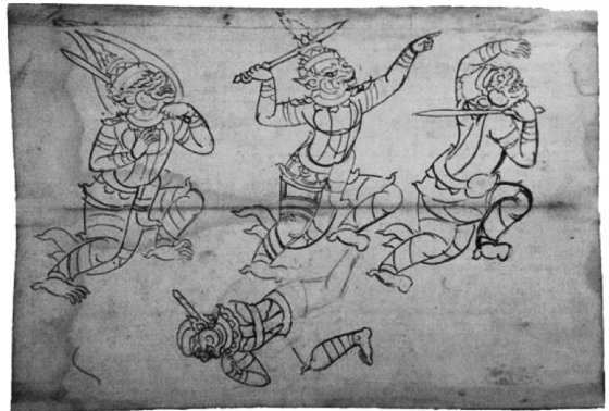
ภาพที่ 16 ภาพยักษ์ ลิง ฝีมือขรรค์อินโข่ง

ขรรค์อินโข่ง ที่ยังคงลักษณะความเป็นจิตรกรรมไทยดั้งเดิมไว้ (ภาพที่ 16) แต่หากต้องการวาดภาพชาวต่างประเทศจะมีลักษณะทางใบหน้าและกายวิภาคที่แสดงความลึกอย่าง 3 มิติมากกว่า