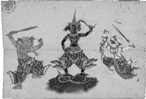
ภาพที่ 10 ดาราภาพแม่เชื้อ