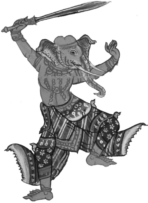
ภาพที่ 14 ช้างถือพระขรรค์ จากตำราแม่ซื้อ