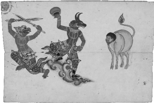
ภาพที่ 12 ดาราภาพแม่เชื้อ