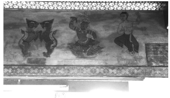
ภาพที่ 7 จิตรกรรมฝาผนังศาลาแม่ชื่อวัดพระเชตุพนฯ

ตำรายาที่ใช้กับเด็กแรกเกิดทั้งสิ้น เมื่อแสดงภาพเปรียบเทียบกับภาพจะพบลักษณะที่มีส่วนคล้าย และความแตกต่างในรายละเอียด บางส่วนซึ่งเป็นกระบวนการพัฒนาแบบหรือการบูรณะที่เกิดขึ้นในช่วงเวลาต่างกัน (ภาพที่ 6- ภาพที่ 13)