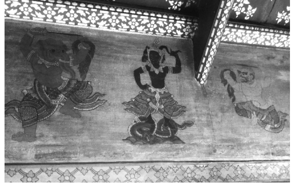
ภาพที่ 11 จิตรกรรมฝาผนังศาลาแม่เชื้อวัดพระเชตุพนฯ