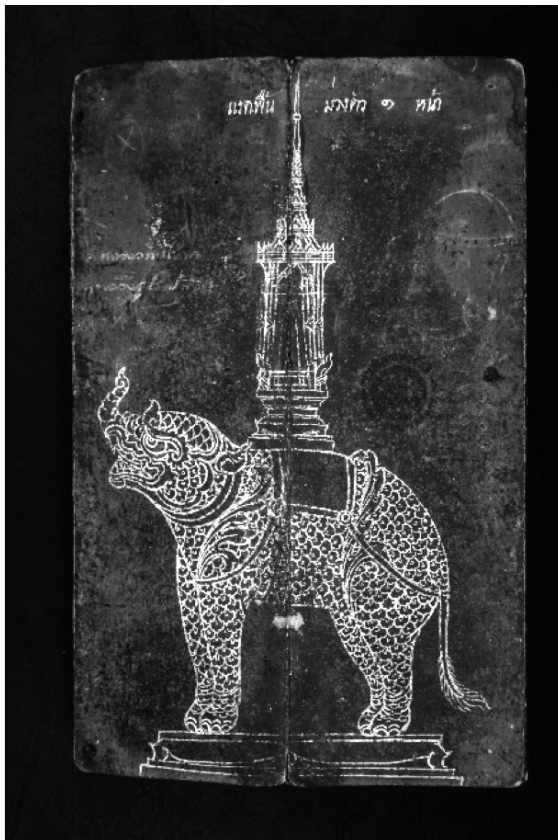
ภาพที่ 2 สมุดไทยดำ

สมุดไทยซึ่งทำขึ้นจากกระดาษข่อยส่งผลต่อการผลิตสมุดไทยดำและไทยขาว เนื่องจากคุณภาพของเปลือกข่อยที่ใช้ในการผลิตกระดาษมีสีที่แตกต่างกัน หากกระดาษที่ทำขึ้นมีสีหม่นค่อนข้างไปทางเข้ม ช่างทำกระดาษจะผสมผงถ่านและทำสมุดนั้นให้กลายเป็นสีดำทั้งเล่ม เรียกสมุดนี้ว่า สมุดไทยดำ ช่างเขียนภาพจะใช้สมุดไทยดำนี้เขียนเฉพาะลายเส้นเป็นหลัก ดังปรากฏสมุดไทยภาพต่างๆ (ภาพที่ 2) สำหรับกระดาษข่อยที่มีคุณภาพดี เนื้อสีขาวนวลจะกลายเป็นสมุดไทยขาวซึ่งใช้ในโอกาสที่หลากหลายกว่าทั้งงานเขียนอักษร วาดภาพและระบายสี (ภาพที่ 3) ในหนังสือวิชาอาชีพชาวสยามสะท้อนภาพชีวิตของชาวสยามในการทำกระดาษที่ค่อนข้างยากลำบาก การได้มาซึ่งกระดาษและสมุดไทยมีความซับซ้อนเมื่อต้องการสมุดที่มีจำนวนพับมากๆ จะต้องต่อกระดาษ “...กระดาษข่อยเมื่อเขาจะทำให้เป็นสมุดไทยทุกอย่างเขาก็เอากระดาษที่ทำเป็นแผ่นแล้วนั้นมาตัดออก กะกว้าง 5 นิ้ว หรือ 6 นิ้ว ตามแต่จะทำให้กว้างเท่าใดเมื่อแผ่นเดียวไม่พอก็เอามาติดต่อกันเข้าหลายๆ แผ่นกว่าจะพอ จึงพับจีบให้เท่ากว้างที่กะไว้มันจนตลอดแผ่น...” (กรมศิลปากร, 2551 หน้า 28)