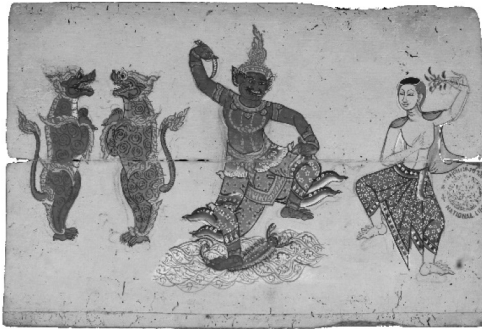
ภาพที่ 6 ตำราภาพแม่ชื่อ

สมุดสเกตช์เป็นหลักฐานสำคัญที่แสดงกระบวนการสร้างสรรค์ของศิลปินเอาไว้ ภาพร่างบางภาพเป็นเบื้องหลังของผลงานศิลปกรรมที่มีคุณค่าทางประวัติศาสตร์อีกด้วย ทั้งนี้เพราะภาพร่างเป็นต้นกำเนิดของผลงานสร้างสรรค์ ภาพร่างเป็นวิธีการอย่างหนึ่งของการเริ่มต้นสร้างสรรค์ ไม่ว่าจะการสร้างสรรคืนั้นจะเป็นงานประเภทใด การร่างภาพเป็นสิ่งสำคัญที่พิสูจน์ด้วยความสำเร็จทางทัศนศิลป์มาแล้ว เช่นภาพร่างที่ปรากฏเป็นผลงานจริงอย่างภาพจากตำราแม่ชื่อจัดอยู่หมวดเวชศาสตร์ เก็บรักษา ณ หอสมุดแห่งชาติ ซึ่งเป็นภาพเขียนสีบนสมุดข่อย ไม่ปรากฏคำบรรยาย เมื่อสืบค้นจึงพบว่าภาพดังกล่าวเป็นภาพเดียวกันกับที่ปรากฏภายในผนังด้านต่างๆ ของศาลาแม่ชื่อวัดพระเชตุพนวิมลมังคลาราม (ภาพที่ 5) ซึ่งศาลานี้เป็นที่จารึก