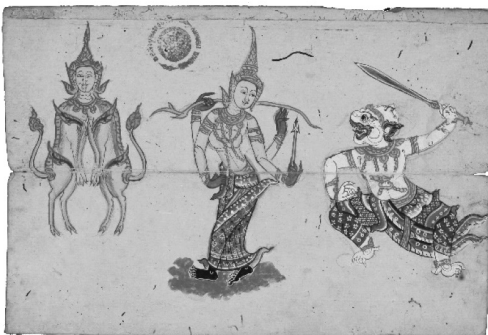
ภาพที่ 8 ตำราภาพแม่ชื่อ