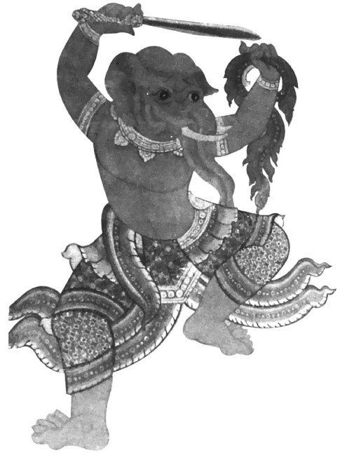
ภาพที่ 15 ช้างถือพระขรรค์จากศาลาแม่ซื้อวัดพระเชตุพนฯ

จากภาพตัวอย่างที่ใช้ในการเปรียบเทียบภาพเขียนที่มาจากสมุดไทย และภาพเขียนที่มาจากงานประดับอาคาร (ศาลาแม่ซื้อ) พบว่าตำราภาพแม่ซื้อเป็นตำราภาพที่มีเอกลักษณ์ของภาพเขียนในสมัยต้นกรุงรัตนโกสินทร์ มีรายละเอียดที่อ่อนช้อยคมชัดจัดได้ว่าเป็นภาพต้นแบบเพื่องานประดับอาคารที่ตัวอย่างหนึ่ง จากการพิจารณาภาพต้นแบบและผลงานจริงปรากฏว่ามีความแตกต่างกันพื้นฐานว่าเป็นช่างคนละคนเขียน ดังเช่นภาพช้างถือพระขรรค์จากตำราแม่ซื้อแสดงกายวิภาคที่มีความเป็น 2 มิติ มีส่วนของเศียรที่เห็นเพียงด้านข้างแตกต่างจากภาพที่ปรากฏในศาลาแม่ซื้อแสดงกายวิภาคที่ต่างออกไป มีมุมมองที่แสดงความเป็นมิติที่แสดงความลึกกว่า มีการเพิ่มเติมลวดลายกระหนกเพื่อให้เกิดความสมดุลเท่านั้นทั้งสองด้านของภาพ