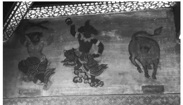
ภาพที่ 13 จิตรกรรมฝาผนังศาลาแม่เชื้อวัดพระเชตุพนฯ

การเขียนภาพร่างเพื่อใช้ในการเขียนตกแต่งอาคาร เป็นกระบวนการทำงานของช่างที่จะต้องอาศัยต้นแบบเพื่อช่วยให้การทำงานนั้นมีประสิทธิภาพมากยิ่งขึ้น ตลอดจนเป็นการจัดสรรชิ้นงานเพื่อให้ช่างซึ่งคาดว่ามีความสามารถเขียนภาพตามพื้นที่ที่ได้กำหนดไว้ได้อย่างเป็นระเบียบและควบคุมระยะเวลาได้ดี