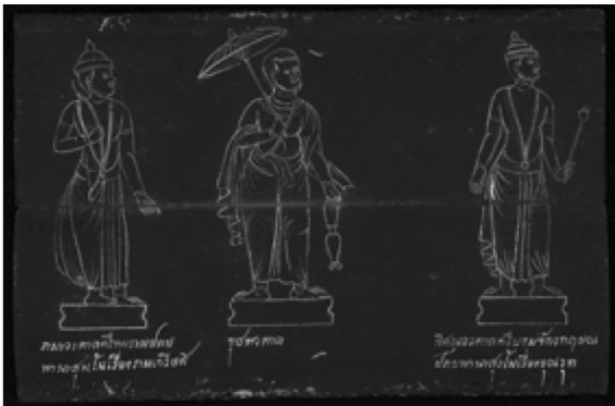
ภาพที่ 17 ภาพรามาวตารใบหน้าฝรั่ง

ข้อสังเกตประการหนึ่งในภาพของชรัวินโข่งซึ่งสำนักหอสมุดแห่งชาติ กลุ่มหนังสือตัวเขียนและจารึก ได้เปรียบเทียบลายเส้นกับภาพจิตรกรรมฝาผนังภายในพระอุโบสถวัดบวรนิเวศวิหาร ว่ามีความคล้ายคลึงกันผลงานของบุคคลคนเดียวกันนั้นสามารถศึกษาได้ถึงพัฒนาการ หรือร่องรอยของการพัฒนาในงานสร้างสรรค์ได้ ดังเช่นภาพม้าของชรัวินโข่งที่แสดงความเคลื่อนไหวรุนแรงในภาพร่าง (ภาพที่ 18) แต่กลับ