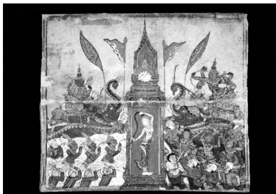
ภาพที่ 3 สมุดไทยขาวแสดงภาพเขียนสีตอนมารวิชัย