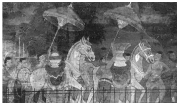
ภาพที่ 19 จิตรกรรมฝาผนังพระอุโบสถวัดบวรนิเวศวิหาร ที่มา: กรมศิลปากร. (2551) , หน้า 24.

ต่อมาในสมัยรัชกาลที่ 6-7 ภาพเขียนที่แสดงความแตกต่างจากโบราณเริ่มชัดเจนอย่างมาก ดังเช่นภาพร่างตัวละครในเรื่องรามเกียรติ์ของพระเทวาทินิมิต ที่แสดงแบบตัวอย่างศักดิ์ของยักษ์ในเรื่องรามเกียรติ์ (ภาพที่ 20) จะเห็นว่ามีการใช้แสดงเงา มิติ ลึกตื้นมาแล้วก็แต่ แต่โครงสร้างที่เป็นแบบอย่างตะวันตกแสดงเด่นชัดในช่วงศิลปะก่อนเปลี่ยนแปลงการปกครองแล้ว โดยยังคงอากัปกิริยาที่เป็นแบบอย่างของไทยไว้