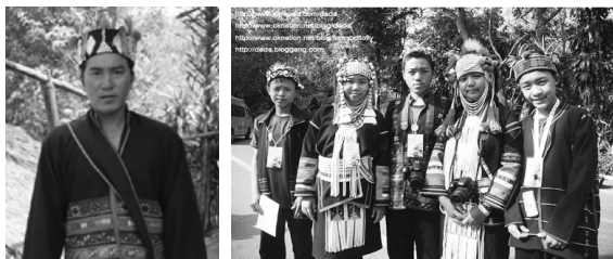
ภาพที่ 4 รูปการแต่งกายของผู้ชายเผ่าอาข่า ที่มา: ออนไลน์.

การแต่งกายของผู้ชายเผ่าอาข่าแบบ ผาหม้ออาข่า เสื้อผู้ชายตัวยาวกว่าอาข่ากลุ่มอื่นเย็บด้วยแถบผ้าก๊วยขาว เรียงซ้อนกัน อาจติดกระดุมหน้าหรืออ้อมไปติดกระดุมข้างซ้าย มักประดับสาบหน้าด้วยเหรียญเงิน หรือสร้อยเงินร้อยลูกกระพรวน กางเกงก็คล้ายกับกลุ่มอื่น