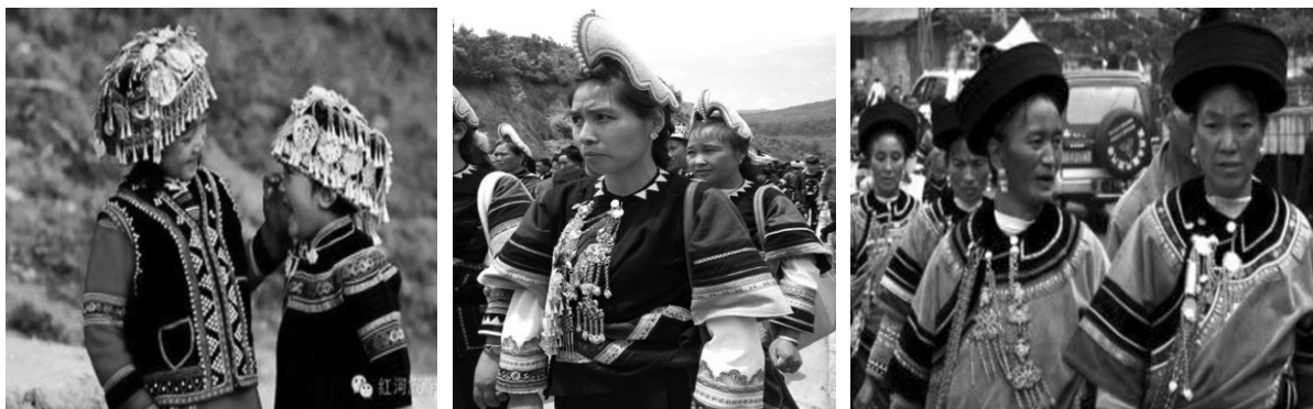
ภาพที่ 7 รูปการแต่งกายของผู้หญิงเผ่าฮาหนี