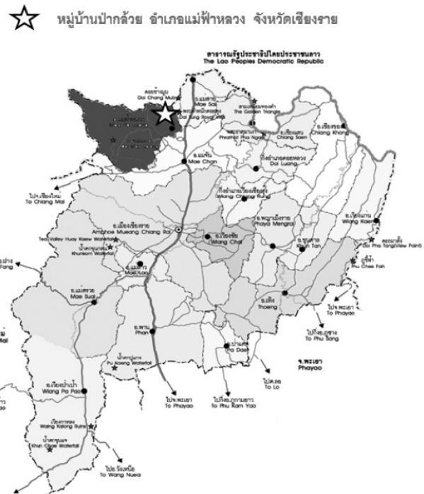
ภาพที่ 2 แผนที่ของชนเผ่าฮาในประเทศไทย ที่มา: ออนไลน์. (ผู้วิจัยปรับปรุงข้อมูลแผนที่)