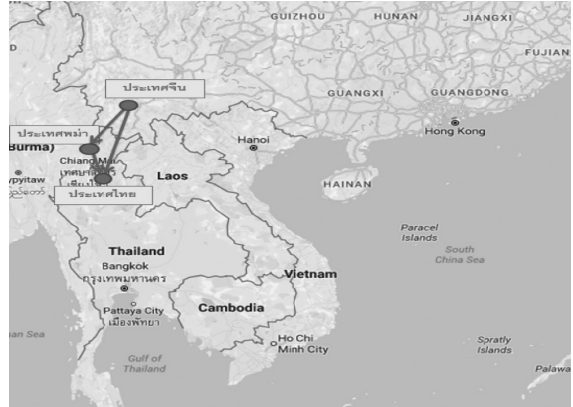
ภาพที่ 1 แผนที่อพยพที่อยู่ของชนเผ่าฮาที่มา: ออนไลน์. (ผู้วิจัยปรับปรุงข้อมูลแผนที่)

3. กลุ่มที่สามเรียกว่า “อายอักซ่า” อพยพเข้ามาในประเทศไทย อพยพเข้ามาประมาณ 70 ปี ที่ผ่านมา อาศัยอยู่ที่อำเภอแม่สาย จังหวัดเชียงราย อีโก้กลุ่มนี้ทั้งชายและหญิงไม่ชอบแต่งชุดประจำเผ่า แต่มักใส่เสื้อผ้าเช่นเดียวกับคนไทยพื้นเมือง บางครั้งถ้าดูลักษณะต่างๆ ไปแล้วจะไม่ทราบว่าเป็นฮา