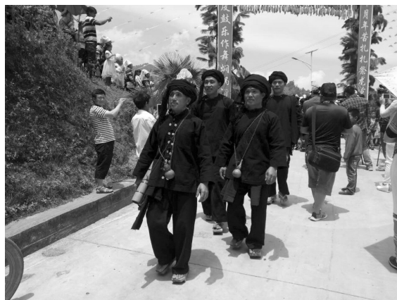
ภาพที่ 5 รูปการแต่งกายของผู้ชายเผ่าฮาหนี