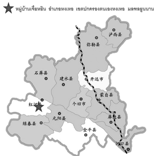
ภาพที่ 3 แผนที่จีนและแผนที่ชนเผ่าอาข่าในมณฑลยูนนาน ที่มา: ออนไลน์. (ผู้วิจัยปรับปรุงข้อมูลแผนที่)

จากความสำคัญดังกล่าว นับตั้งแต่ที่มีการอพยพ ของชนเผ่าอาข่า เข้ามาอยู่ในประเทศไทย วัฒนธรรมต่างๆ ของชนเผ่าอาข่าที่ถือว่ามรดกอันล้ำค่าของชนกลุ่มน้อย อาข่านี้ ในสาธารณรัฐประชาชนจีน ผู้วิจัยจึงเห็นว่า แม้ว่าชนเผ่าอาข่าจะมีภูมิลำเนาหรือถิ่นฐานเดิมที่เดียวกันก็ตาม แต่เมื่ออพยพย้ายถิ่นฐานไปยังประเทศอื่น ซึ่งต่างกันด้วยสภาพแวดล้อมและภูมิประเทศ จึงทำให้ชาวเผ่าอาข่าที่อยู่ในประเทศสาธารณรัฐประชาชนจีนและประเทศไทยมีความเหมือนและความแตกต่างกัน ผู้วิจัยในฐานะเป็นชาวอาข่าของสาธารณรัฐประชาชนจีน กำลังศึกษาอยู่ที่สาขาการสื่อสารภาษาไทยเป็นภาษาที่สองในประเทศไทย ยังไม่พบงานด้านเรื่องการเปรียบเทียบวัฒนธรรมด้านความเชื่อและเครื่องแต่งกายของชนเผ่าอาข่าของประเทศไทยและชนเผ่าอาข่าของสาธารณรัฐประชาชนจีน จึงสนใจศึกษาวิจัยวัฒนธรรมชนเผ่าอาข่าของประเทศไทยและวัฒนธรรมชนเผ่าอาข่าของสาธารณรัฐประชาชนจีน ในขอบเขตของการศึกษาวัฒนธรรมด้านความเชื่อและเครื่องแต่งกาย เพื่อเปรียบเทียบวัฒนธรรมของชนเผ่าทั้งสองประเทศ ซึ่งจะทำให้เข้าใจวัฒนธรรมของชนเผ่าทั้งสอง และการเปลี่ยนแปลงของชีวิตความเป็นอยู่ของชนเผ่าทั้งสองจากอดีตถึงปัจจุบัน ซึ่งจะเป็นแนวทางในการรักษาวัฒนธรรมของชนเผ่าทั้งสองประเทศต่อไป