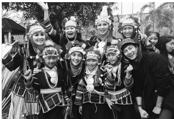
ภาพที่ 6 รูปการแต่งกายของผู้หญิงเผ่าอาข่า

การแต่งกายของผู้หญิงเผ่าอาข่าแบบ ผาหม้ออาข่า ใส่กระโปรงอัดกลีบสีน้ำเงินหรือดำ เสื้อสีดำหรือน้ำเงิน คอกลมผ่าหน้า แขนยาวกั้นผ้าสีต่างๆ จากข้อมือถึงใต้รักแร้ สนับแข้งสีดำหรือน้ำเงิน ปักลายเหมือนกับลายปักเสื้อด้านหลัง บริเวณหน้าอกตกแต่งด้วยแผ่นเงินเล็กบ้างใหญ่บ้าง หมวกผ้าประดับด้วยเม็ดเงินกลมผ้าซีกรอบศีรษะ แนวหูประดับเงินเหรียญเก่า มีสายรัดคางเป็นเงิน และลูกปัดหลากสี