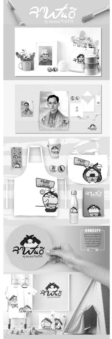
ภาพที่ 2 ภาพสำหรับเผยแพร่บนสื่อโซเชียลมีเดีย ได้แก่ ไลน์ เฟซบุ๊ก อินสตาแกรม มาสคอต ตราสัญลักษณ์ และของชำร่วยประกอบกิจกรรมรณรงค์