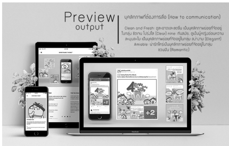
ภาพที่ 1 ภาพสำหรับเผยแพร่บนสื่อดิจิทัล

จากผลการวิจัย ได้นำแนวทางที่ได้ไปใช้ในการออกแบบเรขศิลป์เพื่อการรณรงค์เรื่องการป้องกันฟันผุ สำหรับคุณแม่ยุคใหม่ ภายใต้สารที่ต้องการสื่อ “ลูกฟันดีคุณแม่จัดให้” และบุคลิกภาพแบบ Clean and Fresh: ดูสะอาดและสดชื่น/ Fashionable, Feminine: ทันสมัย, ดูเป็นผู้หญิงอ่อนหวาน ละมุนละไม/Amiable: น่ารักใคร่ มากที่สุด