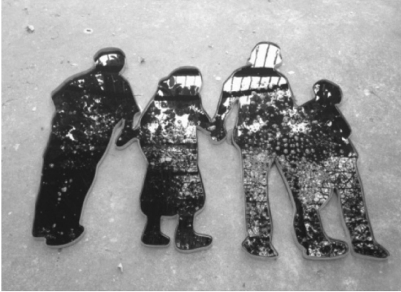
ภาพที่ 3 : ครอบคร้ว