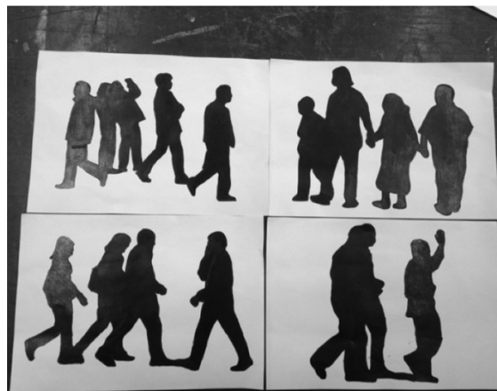
ภาพที่ 1 : ภาพร่างผลงานลายเส้นก่อนขยายทำผลงานจริง