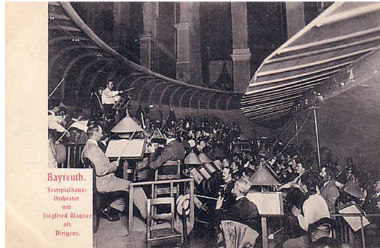
ภาพที่ 1 : ออร์เคสตราพิตและวงพิตออร์เคสตราภายใน Bayreuth Festival Theatre

เป็นละครที่มีชื่อเสียงอย่างมากในอดีตและปัจจุบัน ใช้นักดนตรีในการแสดงทั้งหมดประมาณ 31 คน ละครเรื่อง “The Phantom of the opera” ใช้นักดนตรีทั้งหมด 27 คน ในขณะที่ในอดีตอุปรากรเรื่อง “The Flying Dutchman” บทประพันธ์ของ Richard Wagner ใช้นักดนตรีทั้งหมดไม่ต่ำกว่า 60 คน