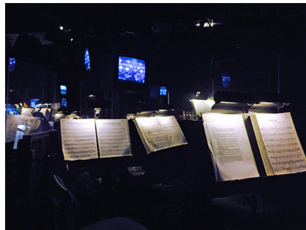
ภาพที่ 4 : ภาพภายในออร์เคสตราพิตที่มีการติดตั้งจอรับภาพการแสดง (Andrea Simakis. (2015). Andrew Lloyd Webber's Love Never Dies. สืบค้นเมื่อ 11 ก.พ. 2561 จาก: http://www.matthewjpool.com/tag/pit/ .)

ในส่วนของนักดนตรีที่ทำหน้าที่บรรเลงดนตรีประกอบการแสดงละครเวที นอกจากความรับผิดชอบในหน้าที่ของตนแล้ว การเตรียมความพร้อมสำหรับเหตุการณ์ที่ไม่คาดคิดและข้อผิดพลาดที่จะเกิดขึ้นจึงเป็นอีกประการที่นักดนตรีในวงพิตออร์เคสตราทุกคนควรจะต้องคำนึงถึง เพื่อให้การแสดงทั้งหมดสามารถดำเนินไปได้อย่างราบรื่นและสมบูรณ์ที่สุด โดยในปัจจุบันในโรงละครสมัยใหม่หรือมีการปรับปรุงใหม่จะมีการติดตั้งอุปกรณ์ต่าง ๆ ที่มีความจำเป็นและสามารถนำมาช่วยวาทยกรและนักดนตรีเครื่องที่สำคัญเช่นกลุ่มเครื่องจังหวะสามารถติดตามหรือมองเห็นการแสดงบนเวทีได้อย่างชัดเจน เพื่อเป็นการช่วยเหลือวาทยกรให้สามารถอำนวยความสะดวกได้อย่างต่อเนื่อง