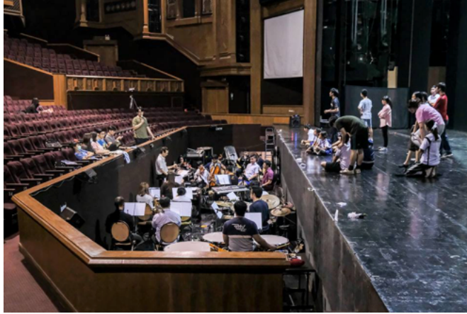
ภาพที่ 2 : ออร์เคสตราพิตและวงพิตออร์เคสตราภายในโรงละครภาคสวนแก้วระหว่างการฝึกซ้อมละครเวทีเรื่อง “เสือ ผีน หมอน โบ”

จากการเก็บข้อมูลโดยการสัมภาษณ์อาจารย์สมัคร กาใจคำ วาทยกรประจำวงกาดเธียร์เตอร์พิตออร์เคสตราและการร่วมบรรเลงดนตรีประกอบการแสดงละครเวที พบว่าวงพิตออร์เคสตราที่ได้ทำการบรรเลงในการแสดงละครเวทีทั้ง 4 เรื่องของกาดเธียร์เตอร์นั้นใช้รูปแบบการจัดนักดนตรีโดยยึดกลุ่มเครื่องสายและกลุ่มเครื่องจังหวะเป็นหลัก โดยเครื่องสายประกอบไปด้วย ไวโอลิน เสียง 1 และเสียง 2 จำนวน 4 คน วิโอลาและเชลโล่ 3 รวมกัน 4 คน และกลุ่มเครื่องจังหวะ 5 คนคือ เปียโน คีย์บอร์ดไฟฟ้า กีตาร์ เบสไฟฟ้าและกลองชุด รวมทั้งหมด 13 คน จากนั้นจะเพิ่มเติมเครื่องลมไม้และเครื่องทองเหลืองตามความสมควรของบทเพลงโดยจะใช้เพียงเครื่องละ 1 ถึง 2 คนเท่านั้น ตัวอย่างเช่น ละครเวทีเรื่อง “อิน จัน เดอร์มิลลิสคัล” ใช้เครื่องลมไม้และเครื่องทองเหลืองเครื่องละ 2 คนครบทุกเครื่อง ในขณะที่เรื่อง “เสือ ผีน หมอน โบ” ใช้เพียงเครื่องละ 1 คนเท่านั้น ดังนั้นผู้เขียนจึงใคร่นำเสนอหลักการสำคัญสำหรับการเป็นนักดนตรีบรรเลงประกอบการแสดงละครเวทีโดยอ้างอิงข้อมูลหลักจากการบรรเลงของวงพิตออร์เคสตราที่มีการแสดงจริงในประเทศไทย ซึ่งจะมีลักษณะเป็นวงออร์เคสตราผสมกับกลุ่มเครื่องจังหวะและเป็นวงออร์เคสตราที่มีจำนวนนักดนตรีทั้งหมดประมาณ 15 ถึง 25 คน โดยในกลุ่มของเครื่องเป่าทั้งเครื่องลมไม้และเครื่องทองเหลืองจะยึดจำนวนนักดนตรีเครื่องละ 1 คนเป็นสำคัญ ซึ่งสามารถสรุปเป็น 5 ประการดังนี้