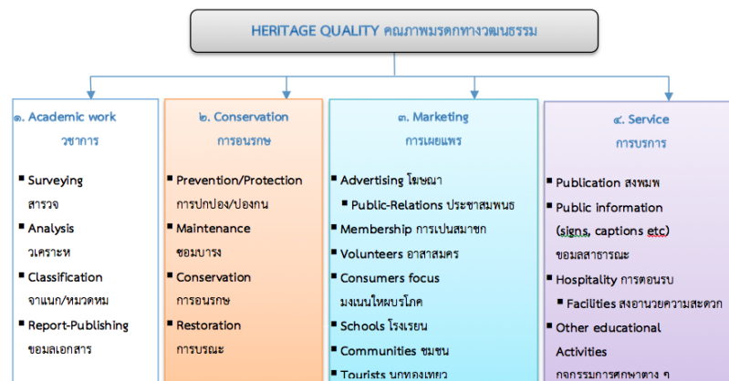
ภาพที่ 2 : การจัดการมรดกทางวัฒนธรรมอย่างมีคุณภาพ