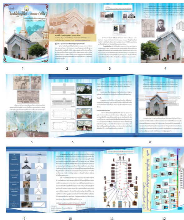
ภาพที่ 6 ชุดภาพคู่มือนำเสนอโบสถ์นักบุญฟิลิป - ยากอบ(หัวไผ่) จำนวน 12 ภาพ

แผนงานระยะสั้น ๒ : แนวทางอนุรักษ์ความรู้เรื่องศิลปสถาปัตยกรรมแก่คนภายนอกชุมชน เนื่องจากโบสถ์นักบุญฟิลิป - ยากอบ (หัวไผ่) มีคุณค่าทางมรดกทางวัฒนธรรมอย่างยิ่ง จึงจำเป็นต้องจัดทำข้อมูลเฉพาะโบสถ์ขึ้น เพื่อบุคคลภายนอกได้เข้าศึกษาเรียนรู้ ท่องเที่ยวในสถานะความหลากหลายทางวัฒนธรรม ผู้วิจัยจึงออกแบบ คู่มือนำเสนอโบสถ์นักบุญฟิลิป - ยากอบ (หัวไผ่) มรดกทางศิลปสถาปัตยกรรมอันทรงคุณค่า ณ วัดนักบุญฟิลิป - ยากอบ (หัวไผ่) ชลบุรี ต่อไป