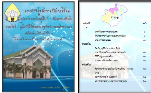
ภาพที่ 5 เอกสารหลักสูตร ภูมิทัศน์วัฒนธรรมชุมชนคาทอลิกของเรา

แผนงานระยะสั้น ๒ : แนวทางอนุรักษ์ความรู้เรื่องศิลปสถาปัตยกรรมแก่คนภายนอกชุมชน เนื่องจากโบสถ์นักบุญฟิลิป - ยากอบ (หัวไผ่) มีคุณค่าทางมรดกทางวัฒนธรรมอย่างยิ่ง จึงจำเป็นต้องจัดทำข้อมูลเฉพาะโบสถ์ขึ้น เพื่อบุคคลภายนอกได้เข้าศึกษาเรียนรู้ ท่องเที่ยวในสถานะความหลากหลายทางวัฒนธรรม ผู้วิจัยจึงออกแบบ คู่มือนำเสนอโบสถ์นักบุญฟิลิป - ยากอบ (หัวไผ่) มรดกทางศิลปสถาปัตยกรรมอันทรงคุณค่า ณ วัดนักบุญฟิลิป - ยากอบ (หัวไผ่) ชลบุรี ต่อไป