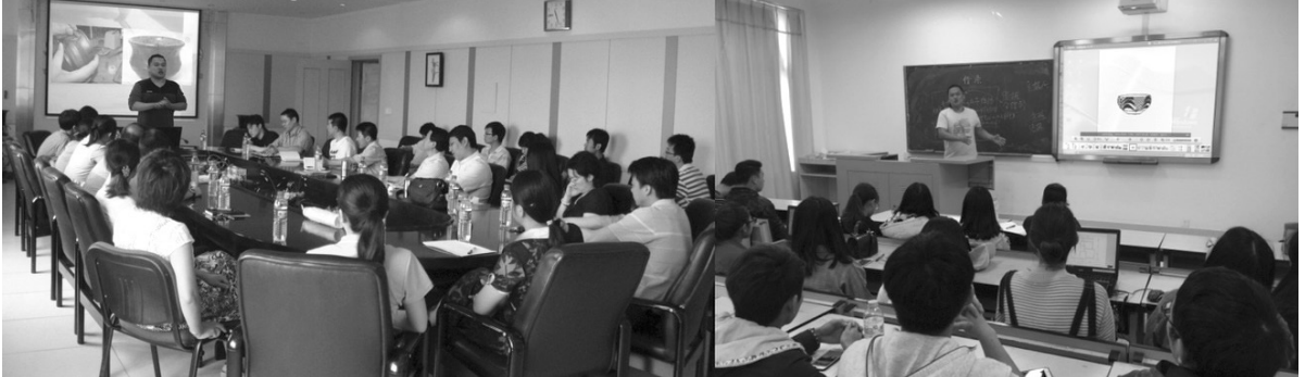
ภาพที่ 6 การบรรยายเพื่อเผยแพร่ระบบ THRD ที่มหาวิทยาลัยในประเทศไทย

ในปัจจุบันไม่ต้องอาศัยช่องทางการจำหน่ายแบบเดิมๆ แต่ใช้อินเทอร์เน็ตช่วยพาสินค้าของตนไปจำหน่ายยังทั่วทุกมุมโลก ในด้านการประชาสัมพันธ์ผู้ประกอบการอาชีพช่างฝีมืองานหัตถกรรมสามารถใช้สื่อเครือข่ายสังคมในการทำการค้าขายได้อย่างเปิดกว้าง สามารถกำหนดกลุ่มเป้าหมาย รวมถึงสร้างฐานลูกค้าที่มีความมั่นคงเพื่อประสบความสำเร็จในการจำหน่ายสินค้าได้อีกด้วย