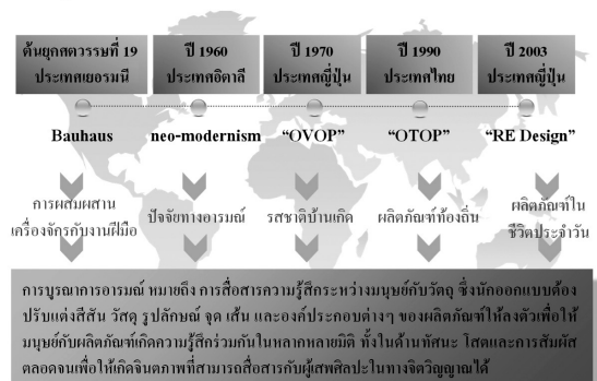
ภาพที่ 2 การบูรณาการอารมณ์ในการออกแบบ (Emotional design)

นอกจากนี้ ผู้วิจัยยังได้ทำการคิดค้นระบบ THRD หมายถึง แนวความคิดใหม่ที่ผู้วิจัยคิดขึ้นประกอบด้วยความหมาย 2 ประการคือ