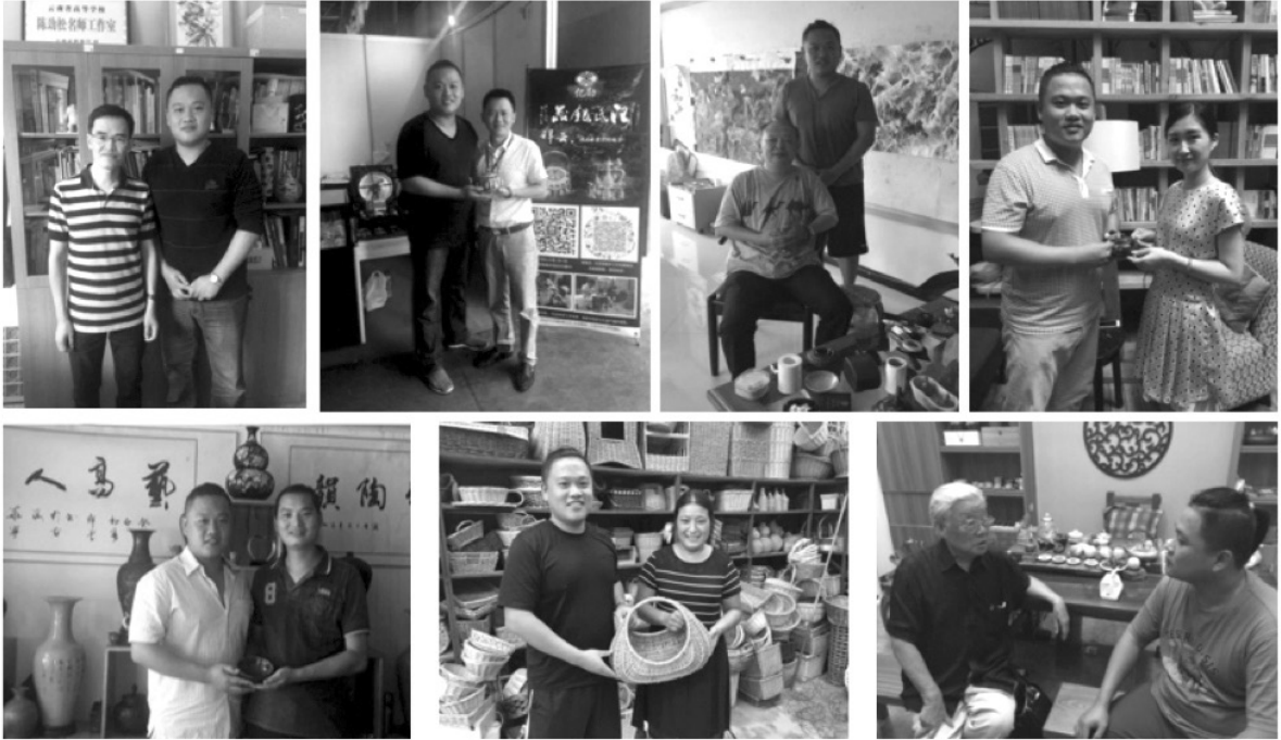
ภาพที่ 3 การสัมภาษณ์ผู้เชี่ยวชาญ

ทักษะหัตถกรรมไม่ให้ศูนย์หาย ลำดับต่อมา เราต้องชักชวนให้นักวิชาการในปัจจุบันเข้ามามีส่วนร่วมในการรณรงค์และอนุรักษ์หัตถกรรมแบบดั้งเดิมให้มากขึ้นโดยใช้ความสามารถทางวิชาการ ประสบการณ์ ปัญญา และความคิดสร้างสรรค์ของนักวิชาการและผู้เชี่ยวชาญเหล่านั้นมาช่วยผลักดันให้หัตถกรรมแบบดั้งเดิมได้รับการฟื้นฟู พัฒนา ปรับปรุงและสืบสานไปพร้อมๆ กับการเจริญเติบโตของเทคโนโลยี ปัจจุบันโลกของเราอยู่ภายใต้กระแสสังคมแบบโลกาภิวัตน์ซึ่งมีการตลาดแบบเปิดกว้างและระบบเศรษฐกิจถูกประสานเป็นหนึ่งเดียวกัน ดังนั้น ผู้วิจัยจึงได้ดำเนินการคิดค้น พัฒนาและออกแบบระบบ THRD เพื่อประยุกต์ใช้ในการอนุรักษ์วัฒนธรรมแบบดั้งเดิมและทดลองใช้งานจริงด้วยการการฟื้นฟูผลิตภัณฑ์ดั้งเดิมใหม่ตามแนวคิด “การออกแบบใหม่” (Re-Design) ด้วยการออกแบบผ่านความรู้สึก โดยเป็นการออกแบบผลิตภัณฑ์ที่ผสมผสานรูปแบบระหว่างเครื่องปั้นดินเผากับชุดที่เผาซึ่งต่างอุดมไปด้วยเอกลักษณ์ของประเทศจีนมีมูลค่าทางจิตวิญญาณและควรค่าแก่การพัฒนา ทั้งนี้ จากการศึกษาเครื่องปั้นดินเผายูนนานและชุดที่เผาเซียงไฮ้เพื่อทดลองระบบ THRD พบว่า เครื่องปั้นดินเผายูนนาน