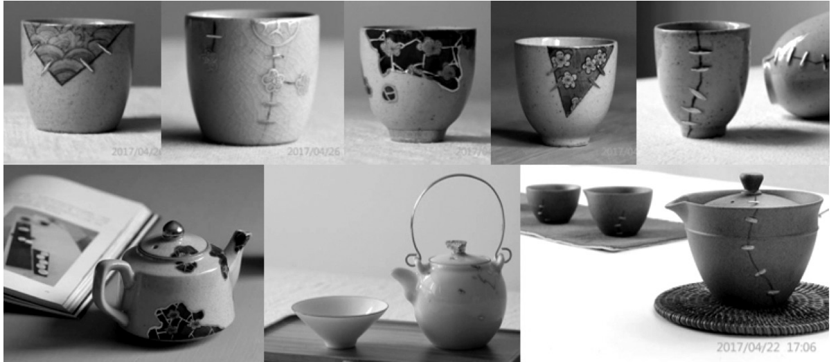
ภาพที่ 4 ตัวอย่างผลงานการออกแบบถ้วยชา

นอกจากนี้ ผู้วิจัยยังได้นำระบบ THRD ไปเผยแพร่ตาม มหาวิทยาลัยในประเทศจีน เช่น Yunnan Minzu University, Kunming University of Science and Technology และ Yunnan Arts University เพื่อให้เกิดการพัฒนาอย่างยั่งยืน