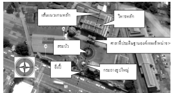
ภาพที่ 4 อาคารและสิ่งสำคัญที่อยู่บนเส้นแนวแกนหลัก

เมื่อผู้วิจัยสำรวจพื้นที่ส่วนที่ 2 ของศาลเจ้าหน้าจาช่าให้จื้อ ก็พบว่า เส้นแนวแกนหลักของศาลเจ้า ไม่ใช่เส้นแนวเหนือใต้ แต่เป็นแนวตะวันออกตะวันตก เหตุปัจจัยที่เส้นแนวแกนหลักทำเป็นแนวตะวันออกตะวันตกอาจจะเกี่ยวกับลักษณะภูมิประเทศและการอำนวยความสะดวกการเข้าออกศาลเจ้า แก่บรรดาลูกศิษย์ที่ศรัทธากับนักท่องเที่ยว อย่างไรก็ตาม นอกจากทิศทางต่างกับแบบแผนโบราณแล้ว การวางผังกลุ่มอาคารในพื้นที่ส่วนที่ 2 ของศาลเจ้า ยังใช้แบบสมมาตร ซึ่งกลุ่มอาคารและสิ่งสำคัญที่อยู่บนเส้นแนวแกนหลัก คือ อังปี้ (ผนังที่ด้านหน้ามีชื่อศาลเจ้าและด้านหลังมีรูปมังกรเก้าตัว) กระจกงูใหญ่ที่ทำด้วยโลหะ สระเย็นศิระ เพราะพระบริบาล (สระบัว) ศาลาที่ประดิษฐานองค์เทพเจ้าหน้าจาช่าให้จื้อและวิหารหลัก (ภาพที่ 4)