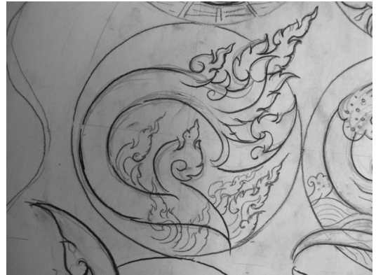
ภาพที่ 4. การทำปุ๋ยหมักชีวภาพ

8 เดือน ดังนั้นในหลวงทรงเห็นถึงปัญหาและอุปสรรคนี้ ท่านมีพระราชดำรัส ในการที่จะช่วยเหลือปัญหาภัยแล้งนี้ด้วยการหาแนวทางและวิธีการสร้างให้เกิดฝนนอกฤดูกาลขึ้นโดยการทำ 3 ขั้นตอน คือ เลี้ยงให้อ้วน ก่อทวน จูโจม ดังนั้นผู้วิจัยจึงได้หยิบยกขั้นตอนและกระบวนการนี้มาใส่ลงในอักษรตัวเลข ๓ ด้วยการออกแบบตัวเลข ๓ เป็นลักษณะเหมือนก้อนเมฆ