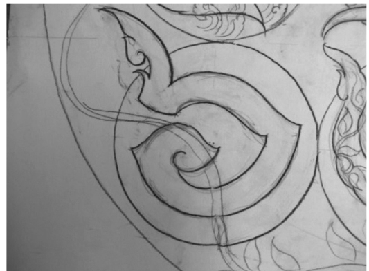
ภาพที่ 9. การทำปุ๋ยคูลูกแบบฟุ้งพา

8. การทำนาขั้นบันได การทำนาขั้นบันไดเป็นแนวคิดของในหลวงรัชกาลที่ 9 เพื่อแก้ปัญหาการเกษตรที่ อยู่บนพื้นที่สูงบริเวณเนินเขาซึ่งเป็นพื้นที่ที่ทำการเกษตรยากเนื่องจากกักเก็บน้ำไม่ได้ พระองค์จึงคิดค้นวิธีแก้ปัญหาเหล่านี้ ผู้วิจัยได้หยิบยกหลักการนี้มาบรรจุในชั้นตอนที่ 8