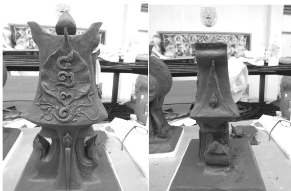
ภาพ 17-18 งานชิ้นที่ 4