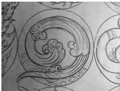
ภาพที่ 1 .การบริหารจัดการน้ำ

1. การบริหารจัดการน้ำ เนื่องจากน้ำเป็นปัจจัยแรกที่สำคัญต่อการทำการเกษตรจึงได้นำตัวอักษรเลข ๑ ไทย มาออกแบบเพื่อใส่ความหมายที่เกี่ยวกับการบริหารจัดการน้ำ ซึ่งได้นำรูปแบบของกังหันน้ำชัยพัฒนาออกมาออกแบบให้สัมพันธ์กับอักษรตัวเลข ๑