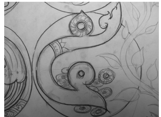
ภาพที่ 5. การทำบัญชีครัวเรือน

4. การทำปุ๋ยหมักชีวภาพ ผู้วิจัยได้นำเอาผลของการทำปุ๋ยหมักชีวภาพซึ่งนอกจากจะใช้เป็นธาตุอาหารของ พืช แล้วผลที่ได้ต่อมาก็คือพลังงานในรูปของก๊าซชีวภาพ โดยออกแบบตัวอักษรเลข ๔ ให้มีลักษณะของเปลวเพลิง