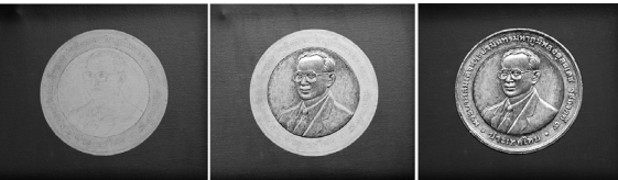
ภาพที่ 8 ผลงานจิตรกรรมชุดต่อเนื่องเทคนิคสีอะครีลิคบนผ้าใบ ขนาด 40 cm. x 40 cm.