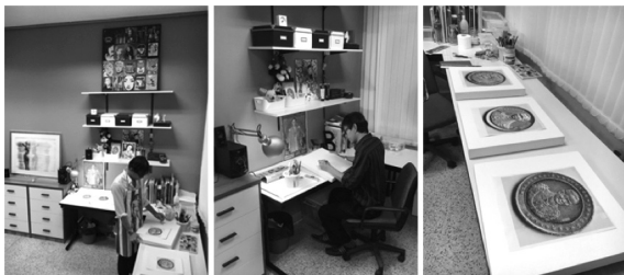
ภาพที่ 4 แสดงการวางแผนการดำเนินงานในช่วง Pre-Production

1.3 มิติภาพและภาพรวมของเหรียญกษาปณ์ต้องนำมาสร้างเป็นต้นแบบและพัฒนาไปเป็นแบบร่างได้