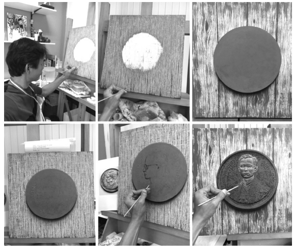
ภาพที่ 5 แสดงแผนผังของขั้นตอนการทำงานในช่วง Production

2.3 การใส่รายละเอียดความเสมือนจริงปรับเปลี่ยนแต่งแก้ไขภาพให้สวยงาม เนื่องจากการผลิตเหรียญกษาปณ์นั้น มีขั้นตอนที่ละเอียดซับซ้อนมากซึ่งอาจจะเกิดข้อผิดพลาดบางประการเกี่ยวกับรายละเอียดของชิ้นงานในการสร้างงานในขั้นตอนนี้จึงต้องมีการออกแบบให้สวยงามหรือแก้ไขภาพให้มีความสมบูรณ์มากยิ่งขึ้น