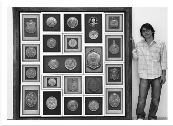
ภาพที่ 7 ผลงานจิตรกรรมรวมชุดต่อเนื่องเทคนิคสีอะครีลิคบนผ้าใบในกรอบ ขนาด 175 cm. x 175 cm.