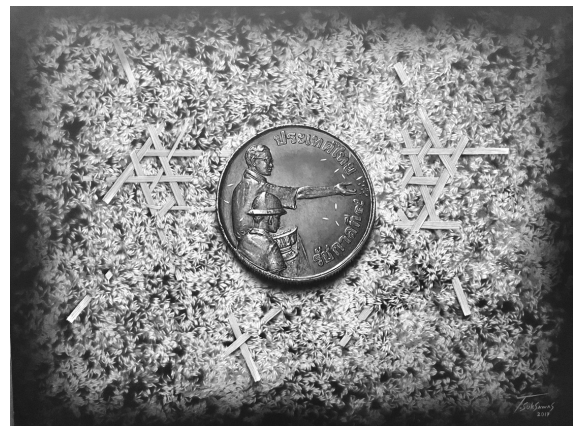
ภาพที่ 12 ผลงานจิตรกรรมชุดต่อเนื่องเทคนิคสีอะครีลิคบนผ้าใบ ขนาด 70 cm. x 70 cm.