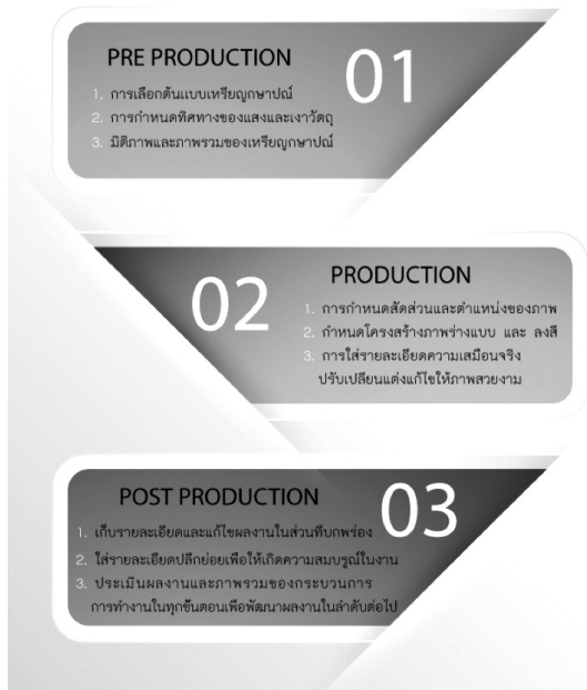
ภาพที่ 3 แสดงแผนผังของขั้นตอนการทำงานของ ผู้ช่วยศาสตราจารย์ธีระชัย สุขสวัสดิ์