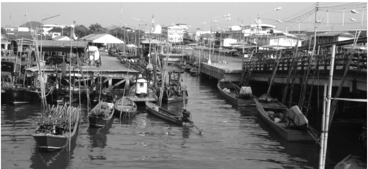
ภาพที่ 2 ภาพชุมชนบางปลาสร้อย (ชุมชนบ้านสะพาน)

Keywords : Cultural Ecology, Landscape Ecology, Foundation, Intelligence Power