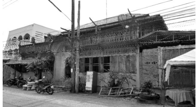
ภาพที่ 4 ด้านหน้าและด้านข้างของเรือนจีน

บริเวณชั้นบนเมื่อพ้นบันไดเป็นห้องโถง กั้นห้องใหญ่ด้านทิศตะวันออก และห้องเล็กสองห้องด้านทิศใต้ มีประตูออกนอกเรือนและมีระเบียงไม้เดินได้รอบ ส่วนระเบียงทิศเหนือยกพื้นซีเมนต์ขนาดใหญ่จากเสาระเบียงชั้นล่าง มีศาลพระภูมิอยู่ชั้นบนทางทิศตะวันตกเฉียงเหนือ การมีพื้นที่ด้านบนบริเวณพื้นระเบียงใช้เป็นที่พักผ่อน ปัจจุบันยังคงมีโครงสร้างหลักมีความแข็งแรงและอยู่ในสภาพดี มีการดูแลรักษา ยังคงใช้เป็นเรือนพักอาศัย