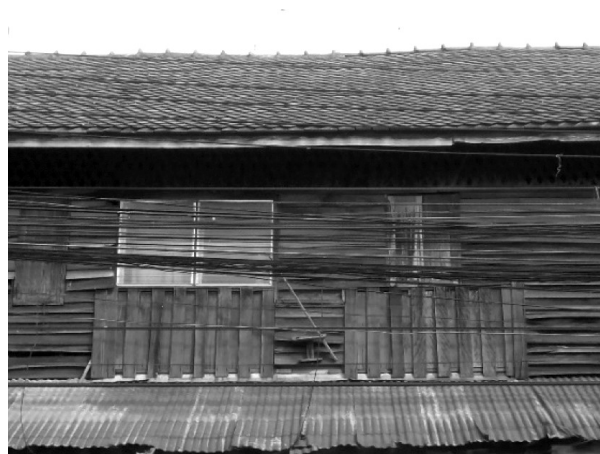
ภาพที่ 5 เรือนแถวสองชั้นและเรือนแถวสองชั้นมีหน้าต่า