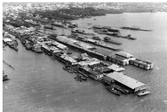
ภาพที่ 1 สภาพบ้านเรือนย่านบางปลาสร้อยบริเวณชุมชนท่าเรือพลีในอดีตเมื่อ 40 ปีที่แล้ว

ชุมชนบางปลาสร้อย มีลักษณะชุมชนแตกต่างจากหัวเมืองอื่นๆ ที่ส่วนใหญ่มักสร้างบ้านเรือนอยู่บนพื้นดิน แต่พื้นที่ของบางปลาสร้อยนั้น บ้านเมืองส่วนใหญ่ถูกสร้างล้าเข้าไปในทะเล โดยมีบริเวณชุมชนบ้านทะเลที่หนาแน่น เนื่องจากบริเวณพื้นดินเลนแถบนี้เป็นที่เกิดของสัตว์ทะเลและเหมาะแก่การทำอาชีพประมง ชาวบ้านจึงต้องสร้างที่พักอาศัยในทะเลเพื่อความสะดวกในการประกอบอาชีพ อีกทั้งในอดีต ชายทะเลถือเป็นที่ว่างเปล่า