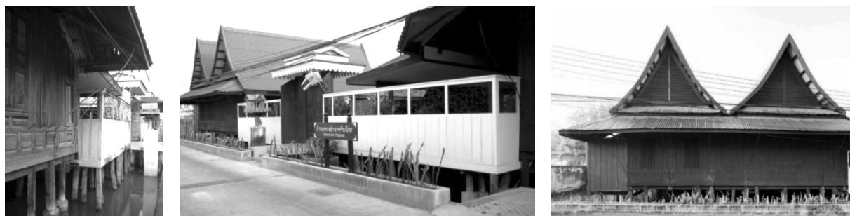
ภาพที่ 3 ภาพด้านหน้าและด้านข้างบ้านหลวงอำนาจจินนิกร

การวางผังบ้าน ด้านข้างเรือนทิศเหนือเป็นทางเข้าตัวเรือน มีบันไดอยู่กลางเรือน ตรงกลางด้านหน้ามีซุ้มประตูทางเข้าเป็น ซุ้มโค้งอยู่กลางบ้าน มีป้ายตัวอักษรเป็นอักษรไทยว่า กิม ฮง ลั้ง และภาษาจีน ซึ่งเป็นป้ายชื่อเรือนสองภาษา โดยมีความหมายว่า ความเจริญรุ่งเรือง ตัวเรือนชั้นล่างเป็นห้องโถงในอดีตเป็นพื้นที่ เพื่อเตรียมบรรจุควดน้ำปลา และส่วนหนึ่งเป็นพื้นที่เอนกประสงค์ กันห้องไว้เพียงห้องเดียวด้านทิศตะวันตกข้างบันได มีบันไดและ ชานพักชั้นชั้นบนอยู่ภายในเรือนด้านทิศตะวันตก ส่วนด้านหลัง ชั้นล่างด้านสกัดนอก เรือนด้านทิศใต้เป็นครัวและมีบ่อพักน้ำฝน อยู่ใต้พื้นบ้าน เพื่อใช้อุปโภคบริโภค