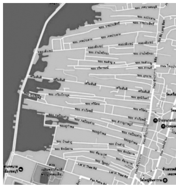
ภาพที่ 2 แผนที่ถนนวิชรปราการและเส้นทางคมนาคมบริเวณ ชุมชนบางปลาสร้อยปัจจุบัน กับเส้นทางที่เชื่อมต่อกันเลียบทะเล