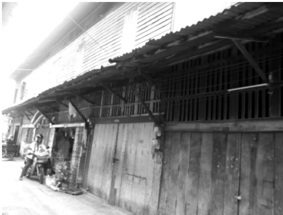
ภาพที่ 8 เรือนแถวสองชั้นมีदानบนเป็นช่องระบายลม