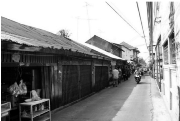
ภาพที่ 7 เรือนแถวไม้ ชั้นเดียว

ชานเรือนประเภทนี้มักมีพื้นที่ส่วนท้ายของเรือนใช้ตั้งวาง และเก็บสะสมสินค้าต่างๆ ทำให้ส่วนระเบียงหน้าเรือนซึ่งเคยเปิดโล่งมาแต่เดิมนั้น ต้องมีการทำประตูปิดกั้นหน้าร้านเพื่อความปลอดภัย ส่วนมากทำประตูบานเฟี้ยม หรือฝากระดานที่ใช้เลื่อนปิดที่ละแผ่นตลอดแนวความยาวด้านหน้า เรียกว่าฝาน้ำฉิ่ง เป็นต้น