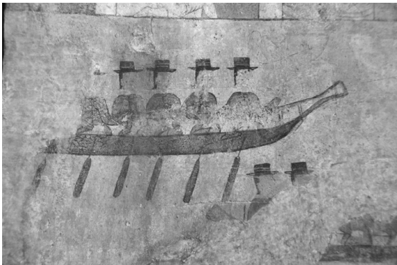
ภาพที่ 8 ภาพจิตรกรรมที่แสดงให้เห็นถึงวัฒนธรรมของชาวจีนที่อพยพมาอยู่บริเวณอำเภอพนมสารคาม

4) ภาพจิตรกรรมแสดงให้เห็นถึงการอยู่ร่วมกันของพี่น้องสามชาติพันธุ์อย่างกลมเกลียว การทำมาหากิน รวมถึงการใช้ชีวิตที่มีความสามัคคี