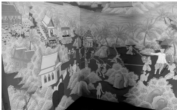
ภาพที่ 5 จิตรกรรมสะท้อนภาพวิถีชีวิต เครื่องแต่งกาย สถาปัตยกรรม บ้านเรือน และสถาปัตยกรรมของชุมชนสาวชะงอก

1) ภาพจิตรกรรมแสดงให้เห็นถึงภูมิทัศน์ลุ่มน้ำบางปะกงพืชเศรษฐกิจในชุมชนเช่นต้นมะพร้าว