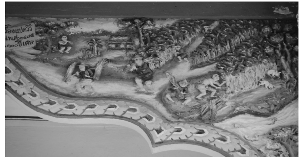
ภาพที่ 4 งานปูนปั้นแสดงถึงอาชีพของชาวมุขน้ำบางปะกงที่ปรับเปลี่ยนไปตามยุคตามสมัย

3) สะท้อนถึงอาชีพเกษตรกรรมที่เปลี่ยนไปแต่ละยุค แต่ละสมัยของผู้คน เริ่มจากการอยู่กับธรรมชาติพัฒนาเป็นไร่ สวน นาข้าว และแสดงถึงพืชพันธุ์ที่เกี่ยวกับกับเศรษฐกิจตามปีต่างๆ เช่น การปลูกอ้อยหมาก ข้าว สับปะรด