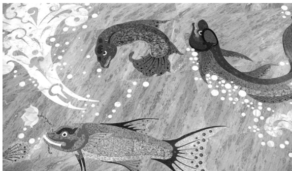
ภาพที่ 2 ภาพลวดลายสัตว์น้ำที่แสดงถึงความสมบูรณ์ของแม่น้ำบางปะกง

2) ภาพรูปสัตว์น้ำต่างๆ ที่ปรากฏในงานจิตรกรรมนั้น ไม่ว่าจะเป็น ปลา ปู จระเข้ หรือสัตว์อื่นๆ นั้น เชื่อมโยงถึงภาพแทนของแม่น้ำบางปะกงได้เป็นอย่างดี เช่น ภาพจระเข้ และสัตว์นาขาชนิดได้แสดงถึงความอุดมสมบูรณ์ของแม่น้ำ ความหลากหลายทางชีวภาพและความยิ่งใหญ่ของแม่น้ำสายหลักที่หล่อเลี้ยงผู้คน