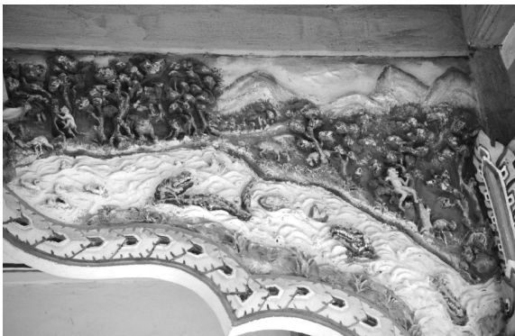
ภาพที่ 3 งานประติมากรรมปูนปั้นที่แสดงถึงความอุดมสมบูรณ์ของแม่น้ำบางปะกงในอดีต

เรื่องราวงานปูนปั้นที่ประดับพระอุโบสถวัดสัมปทวน ที่มี เรื่องราวเนื้อหาเกี่ยวกับวิถีชีวิตของชาวแปดริ้วแล้วนั้น ผู้วิจัย สามารถสรุปได้เป็นข้อๆ ดังนี้