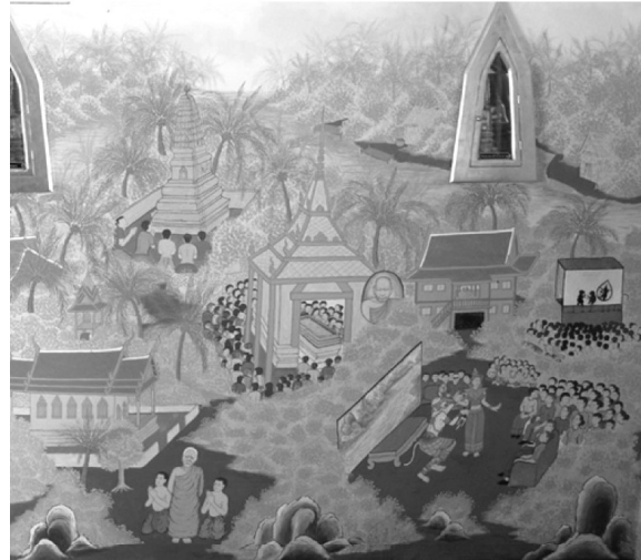
ภาพที่ 6 ภาพจิตรกรรมสะท้อนให้เห็นความเชื่อและความศรัทธาต่อพุทธศาสนาของชาวชุมชนสาวชะงอก

4) ภาพจิตรกรรมแสดงให้เห็นถึงความเชื่อความศรัทธาของผู้คนในชุมชน