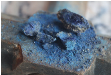
ภาพที่ 10 : สีฝุ่นที่บดจากหินธรรมชาติ