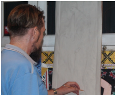
ภาพที่ 12 : ร่างภาพลงบนแผ่นไม้