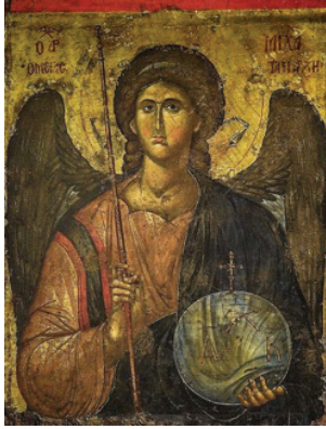
ภาพที่ 3 : อัครทูตสวรรค์ไมเคิล