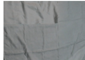
ภาพที่ 7 : ผ้าลินินสีขาว ขนาด 140 X 40 ซม.