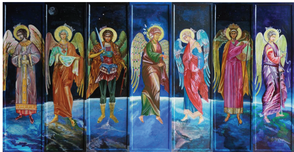
ภาพที่ 21 : ภาพผลงานอัครทูตสวรรค์ทั้ง 7 ขนาดของแต่ละภาพ 124 X 34 ซม.