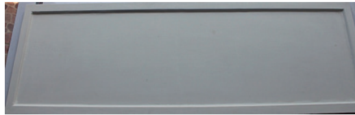
ภาพที่ 9 : แผ่นไม้ที่หุ้มด้วยผ้าลินิน เคลือบ