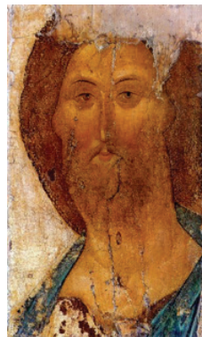
ภาพที่ 1 : พระเยซู

ค.ศ. 1410