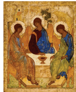
ภาพที่ 2 : ทรีนิตี้

ที่มา: https://th.wikipedia.org/wiki/รูปเคารพ ค.ศ. 1410