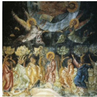
ภาพที่ 5 : เฟรสโกการเสด็จสู่สรวงสวรรค์ของพระคริสต์