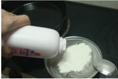
ภาพที่ 8 : เจลาตินผสมผงแป้งสีขาว