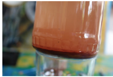
ภาพที่ 11 : สีฝุ่นผสมเทมเพอราไซ้