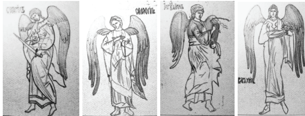
ภาพที่ 17 – 20 : ภาพร่างอัครทูตสวรรค์ยูเรียล เซราเฟียล เจกุเคียล และ บาราเซียล