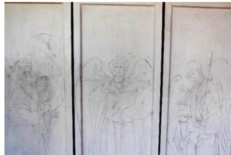
ภาพที่ 13 : ภาพที่ร่างลงบนแผ่นไม้