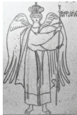
ภาพที่ 14 - 16 ภาพร่างอัครทูตสวรรค์ไมเคิล กาเบรียล ราฟาเอล