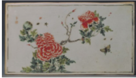
ภาพที่ 8 : แผ่นเครื่องเคลือบห้าสี ช่วงสมัยราชวงศ์ชิง

อิทธิพลทางการค้าและการเผยแพร่เทคนิคผลงานเครื่องเคลือบดินเผาโบราณจีน ที่มีต่อการวิวัฒนาการของไทยในอดีต