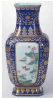
ภาพที่ 9 : แจกันทรงเหลี่ยมเคลือบน้ำเงินจี๋หลาน ช่วงสมัยราชวงศ์ชิง