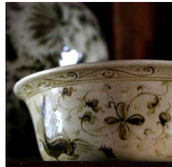
ภาพที่ 4 : เครื่องเคลือบเวียงกาหลง

ของอินเดียได้มีอิทธิพลอย่างมากต่อเอเชียตะวันออกเฉียงใต้ตั้งแต่ช่วงต้นจนถึงคริสต์ศตวรรษที่ 8 และมีการค้าร่วมกันของทั้งสองอาณาจักรมาโดยตลอด ดังนั้นศิลปะอินเดียจึงได้มีอิทธิพลต่อการสร้างสรรค์ด้านศิลปะในเอเชียตะวันออกเฉียงใต้ก่อนประเทศจีน โดยนักวิชาการชาวจีน หวัง กวงเหยาได้ชี้ให้เห็นว่า “การเผยแพร่เทคนิคที่แท้จริงมักเกิดขึ้นจากการพลัดเปลี่ยนหมุนเวียนของกลุ่มผู้คน ขั้วเคลื่อนโดยการแลกเปลี่ยนเทคนิคในด้านการเลือกใช้วัสดุ เทคนิคการผลิตรูปทรง รูปแบบเตาเผา ขั้นตอนการผลิต ฯลฯ” (WANG G. Y., 2011) ดังนั้นการพัฒนาของเครื่องเคลือบดินเผาไทยในช่วงเวลานี้จึงได้รับอิทธิพลจากหลายๆ ด้าน ซึ่งไม่สามารถยืนยันได้ว่าเทคนิคการทำเครื่องเคลือบดินเผาของไทยที่มีมาจากประเทศจีน แต่สิ่งที่แน่ชัดคือการแลกเปลี่ยนทางวัฒนธรรมเครื่องเคลือบดินเผาระหว่างจีน-ไทยทั้งสองประเทศเป็นสิ่งที่เกิดขึ้นและดำรงอยู่อย่างแน่นอน