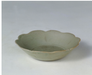
ภาพที่ 1 : ขามเคลือบสีลาดทรงกลีบบอกไม้ของเตาเผาเขียวสมัยราชวงศ์ถัง

ในช่วงสมัยราชวงศ์ถัง มีการส่งออกสินค้าเครื่องเคลือบดินเผาของจีนโดยผ่านเส้นทางทางทะเลเป็นจำนวนมาก โดยนักวิชาการ นายเฟิงเซียนหมิงได้สรุปไว้ในบทความ “การเผยแพร่ระหว่างประเทศของเครื่องเคลือบดินเผาโบราณจีน” ว่า “โบราณวัตถุทางวัฒนธรรมที่ได้ขุดพบจากสถานที่ต่างๆ ได้บ่งชี้ว่าเครื่องเคลือบดินเผาโบราณที่เก่าแก่ที่สุดซึ่งถูกขุดค้นพบในพื้นที่เอเชียและแอฟริกาอยู่ในช่วงสมัยราชวงศ์ฮั่น แต่เครื่องเคลือบดินเผาเริ่มเป็นจำพวกสินค้าตั้งแต่ในช่วงสมัยราชวงศ์ถัง” (FENG X. M., 1990)