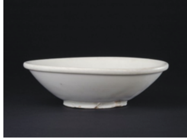
ภาพที่ 2 :ชามเคลือบขาวทรงหยกกันลี้กของเตาเผาสิงสมัยราชวงศ์ถัง