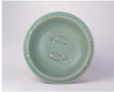
ภาพที่ 5 : เครื่องเคลือบสีขาวและสลักลายปลาคู่ของเตาเผาหลงจวน สมัยราชวงศ์ซ่ง

ในสมัยราชวงศ์ซ่งและหยวน เตาเผาหลงจวน เตาเผาจิ่งเต๋อเจิ้น เตาเผาเต๋อฮั่ว เตาเผาจวนโจว และเตาเผาแต้จิ๋ว ถือเป็นเตาเผาที่มีความสำคัญอย่างยิ่งในด้านการค้าระหว่างประเทศ โดยผลิตสินค้าประเภทเครื่องลายครามส่งออก โดยส่วนใหญ่จะเป็นเครื่องเคลือบสีขาว เครื่องเคลือบสีขาว เครื่องเคลือบเขียนสีดำ เครื่องเคลือบเขียนสีแดง เครื่องเคลือบสีแดง เป็นต้น