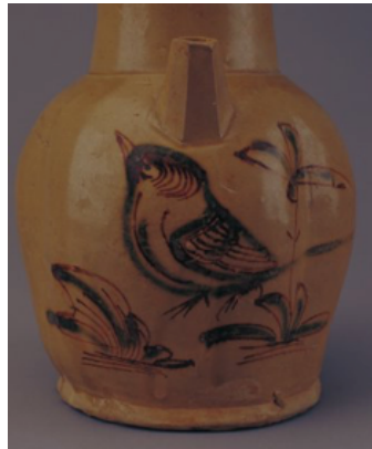
ภาพที่ 3 : เครื่องเคลือบเขียนลายนกดอกไม้ของเตาเผาฉางซาสมัยราชวงศ์ถัง

ในยุคก่อนประวัติศาสตร์ในประเทศไทยช่วงเวลานี้ ยังไม่มีการรวมประเทศเป็นเอกภาพ ซึ่งในประชากรกลุ่มแรก ๆ ในไทยประกอบด้วย ชาวมอญเป็นส่วนใหญ่ โดยในช่วงคริสต์ศตวรรษที่ 7 มีการสร้างการเกิดขึ้นของอาณาจักรที่มีความสำคัญอย่างยิ่ง คืออาณาจักรทวารวดี และจากรายงานการขุดค้นทางโบราณคดีที่เกี่ยวข้องพบว่า ยังมีการขุดค้นพบโบราณวัตถุเครื่องปั้นดินเผา และเครื่องเคลือบของไทย ในช่วงสมัยศรีวิชัยและเชียงแสน โดยมีเตาเวียงกาหลงสมัยเชียงแสนที่มีลักษณะของความเป็นตัวแทน และเป็นเตาเผาที่ค่อนข้างมีปากเตา แต่อย่างไรก็ตามยังคงมีข้อพิพาทถกเถียงเกี่ยวกับที่มาซึ่งมีความคล้ายกับเตาเผาของเขมร แม้ว่าเทคนิคการผลิตอาจได้รับอิทธิพลจากจีน แต่เอกสารที่เกี่ยวข้องกับการขุดค้นและโบราณวัตถุทางวัฒนธรรมแสดงให้เห็นว่า รูปแบบและลวดลายนั้นมัลักษณะแสดงถึงความเป็นไทยที่ชัดเจน (FANG X. J., 2009)