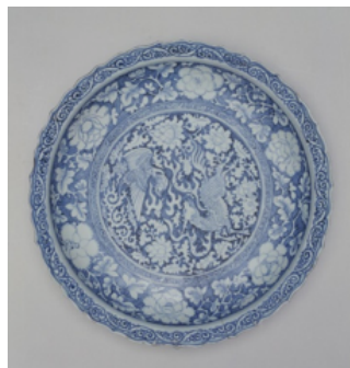
ภาพที่ 6 : จานเคลือบชิงฮวาลายกิเลนหงส์บนของเตาเผาจิ่งเต๋อเจิ้น สมัยราชวงศ์ซ่ง

ที่มา: พิพิธภัณฑ์พระราชวังปักกิ่ง https://www.dpm.org.cn/