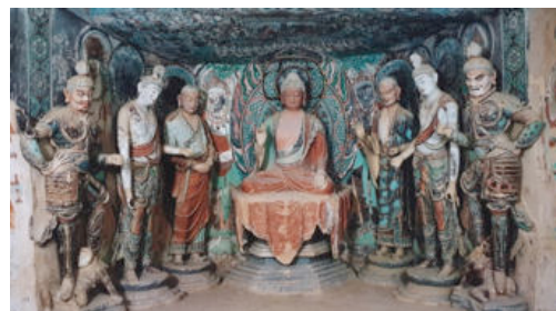
ภาพที่ 3 ถ้ำตุนหวง ถ้ำที่ 45

ตัวอย่างรูปจตุโลกบาลในถ้ำตุนหวงถ้ำที่ 45 สร้างขึ้นในสมัยราชวงศ์ถัง ราวพ.ศ. 1148-1323 ทั้งหมดเป็นรูปปั้นดินเผาเหนียวสี การจัดวางองค์ประกอบสมดุลเป็นรูปบุคคลชายชาวเทากัน มีพระศากยมุนีเป็นประธานของภาพ ประดิษฐานบนฐานบัวยกสูง ขนาบด้วยพระสาวกทางขวา คือ พระอานนทียืนบนฐานบัว ซ้ายมือพระกัสสปะยืนบนฐานบัว ถัดจากพระสาวกทั้งสององค์เป็นพระโพธิสัตว์ และถัดจากพระโพธิสัตว์รูปด้านหน้าทั้งสององค์เป็นโลกบาล (lokapala) รวมเรียกว่าราชาสวรรค์ (heavenly king) (Roderick, Susan & Neville, 2016 : 51) (ในสมัยราชวงศ์ถังนี้พบว่าเอกสารยังไม่เรียกชื่อเฉพาะของจตุโลกบาล เรียกรวมว่าโลกบาลหรือราชาสวรรค์ เพื่อความชัดเจนผู้เขียนจึงขอเรียกจตุโลกบาลแทน) จตุโลกบาลประทับยืนบนบัว ขวามือคือวิรูปักษ์ ราชาแห่งทิศใต้ เวสสุวรรณราชาแห่งทิศเหนือ รูปของจตุโลกบาลทั้งสององค์ยืนเท้าเอวเหยียบมนุษย์ตัวเล็กที่สื่อถึงสิ่งชั่วร้าย อีกมือหนึ่งของทั้งสององค์ ยกขึ้นกำถ้อยสัญญาลักษณะประจำองค์ (หักขารุด) จตุโลกบาลทั้งสองสวมชุดทหารเขียนสี ใบหน้าหน้าตาดุร้าย ตาโปน ขมวดคิ้ว ไว้หนวด ผมเป็นลอนมัดจุกชูขึ้นเหนือศีรษะ ในขณะที่เหล่าพระโพธิสัตว์และพระศากยมุนี มีพระพักตร์ที่สื่อถึงความเมตตา สงบนิ่ง ความงามทางสุนทรียภาพ ของจตุโลกบาลจะขัดกับเหล่าพระโพธิสัตว์ พระสาวก แสดงทิศทางมองออกมาสู่เบื้องหน้า ทำหน้าที่ดูแลพระพุทธศาสนา ยืนตำแหน่งหน้า ตามคติเมื่อผ่านจตุโลกบาลเข้ามาแล้ว จะเข้าถึงวิหารหลักที่พระศากยมุนีเป็นประธาน (ดูภาพที่ 3 ประกอบ)