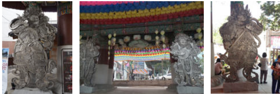
ภาพที่ 22-24 รูปจตุโลกบาล ภาพจากซ้ายวิรุฬหก เวสสวัณ ธรูฐและวิรูปักษ์ วัดใจเกซา

การนำเสนอรูปจตุโลกบาลที่วัดใจเกซา ยึดตามคติความเชื่อเดิม เป็นตำแหน่งที่แบ่งโลกมนุษย์กับโลกสวรรค์ มีความงามใช้รูปแบบศิลปะที่แตกต่างไปจากเดิม เมื่อเรายืนมองความงามของจตุโลกบาลตรงทางเข้า เราจะเห็นจตุโลกบาลเป็นภาพ 3 มิติแสดงความนูนของลวดลายประดับทำให้เกิดต้นลึก แต่แท้จริงทำเป็นแผ่นเหล็กแบนเท่านั้น ต่างจากการออกแบบเดิมที่ผ่านมา แต่ก็ทำให้ประติมากรรมแบบนี้แสดงความงามและเน้นความรู้สึกว่าแต่ละองค์สามารถที่จะคุ้มครองพระพุทธศาสนาได้ด้วยความแข็งแกร่งของวัสดุ นำหนักของวัสดุที่กดบนปีศาจความชั่วร้าย การใช้วัสดุรูปแผ่นบางของโลหะ อาจเป็นข้อจำกัดด้วยพื้นที่ เนื้อที่ของวัดที่แคบ ซึ่งวัดใจเกซาเป็นวัดในเมืองหลวง ประติมากรรมจึงลดทอนสร้างเป็นประติมากรรมแล้ววางตำแหน่งตามคติความเชื่อ ถ้าสร้างวิหารจตุโลกบาลด้วยแล้วจะกินพื้นที่มาก ทำให้วิหารปิดบังดูทึบตันทำให้วัดดูแคบ ความงามก็จะลดลง