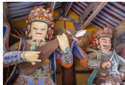
ภาพที่ 18 รัตนฐือ กับวิรุฬหก วัดทองโศก

จตุโลกบาลวัดทองโศก ยึดคติความเชื่อ จัดไว้ที่วิหารจตุโลกบาลแบ่งเขตอาณาจักรมนุษย์ อาณาจักรของพระพุทธเจ้า สร้างไว้เป็นคู่รวมสี่องค์ แสดงใบหน้า ชุดเกราะ เหยียบปีศาจ ลวดลายเขียนสีที่แตกต่างกัน สัญลักษณ์ที่ถือจะต่างกัน พร้อมทั้งจะทำหน้าที่รักษาพระพุทธศาสนา (ดูภาพที่ 18-21 ประกอบ)