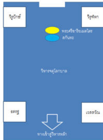
ภาพที่ 12 แผนผังจำลองวิหารจตุโลกบาลวัดจงไถซาน

จตุโลกบาล: คติความเชื่อเดิม รูปแบบทางความงามทางสุนทรียภาพที่แตกต่าง ในประเทศอินเดีย จีน ญี่ปุ่น ไต้หวัน และเกาหลีใต้