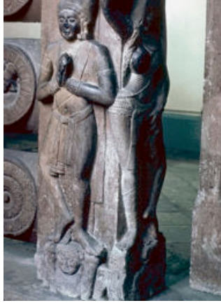
ภาพที่ 1 จิตโลกบาลประดับที่รั้วการหุด

จิตโลกบาล: คติความเชื่อเดิม รูปแบบทางความงามทางสุนทรียภาพที่แตกต่าง ในประเทศอินเดีย จีน ญี่ปุ่น ไต้หวัน และเกาหลีใต้