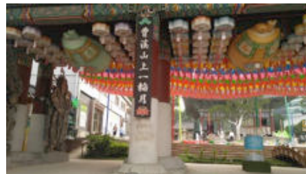
ภาพที่ 25 การวางรูปจตุโลกบาลเป็นคู่ วัดใจเกซา