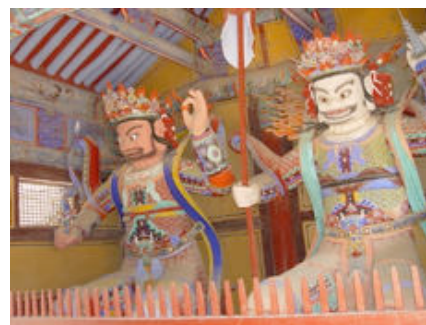
ภาพที่ 19 วิรุฬหก กับ เวสสวัณ วัดทองโศก