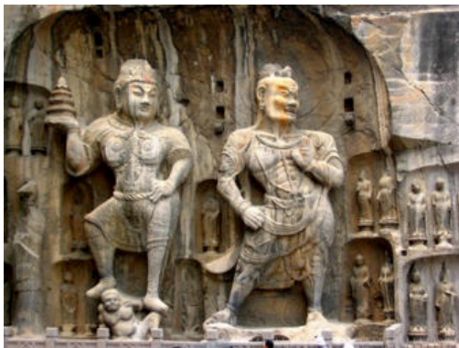
ภาพที่ 8 ถ้ำหลงเหมิน ซ้ายมือเวสสวัณ ขวามือทวารบาล (วัชรปาณี)