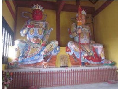
ภาพที่ 9 เวสสวัณ กับวิรุฬหก วัดชีชินซาน