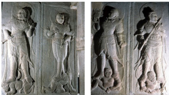
ภาพที่ 16-17 แสดงวิหารจตุโลกบาล วัดชอคคูรัม เกาหลีใต้

พระศากยมุนีหันพระพักตร์ไปทางทิศตะวันออก การวางจตุโลกบาลทั้งสองคเป็นงานประติมากรรมปูนต้ำ กำแพงทิศเหนือเป็นคู่ของ ธรณีกับ เวสสวัณ กำแพงทางด้านทิศใต้ วิรุฬหกกับ วิรูปักษ์ ทั้งสองคส์วมชุดเกราะอยู่ในท่ายืนอยู่บนปีศาจ ปีศาจมีลักษณะคนแคระ ใบหน้าจตุโลกบาลแสดงหน้าตาดุร้าย ด้านหลังศีรษะทุกองค์สลักกมณฑลเป็นรูปวงกลม สิ่งที่น่าสนใจในวัดทั้งหมดเป็นงานประติมากรรม โดยช่างวางองค์พระศากยมุนีเป็นประธาน สร้างเป็นประติมากรรมลอยตัว เป็นสิ่งสำคัญของวัดประดิษฐานไว้ในวิหารหลัก(ทรงกลม) วิหารโถงด้านหน้าทางเข้าช่างสลักเป็นรูปธรรมบาล 16 องค์สลักเป็นภาพปูนสูงด้วยขนาดห้องที่ใหญ่มีพื้นที่กว้าง ส่วนตำแหน่งของสี่จตุโลกบาล เป็นห้องสี่เหลี่ยมเล็ก เป็นทางเดินเชื่อมที่จะเข้าสู่วิหารหลัก วิหารนี้มีขนาดเล็กช่างจึงออกแบบรูปประติมากรรมของจตุโลกบาลเป็นภาพปูนต้ำ ในเรื่องขนาดแล้วจะมีความสูงเท่ากันแต่ด้วยพื้นที่วิหารจตุโลกบาลมีพื้นที่ที่แคบช่างจึงเน้นสลักภาพปูนต้ำจะได้ไม่กินเนื้อที่ทางเดิน นอกจากนี้เป็นการลดความเด่นของจตุโลกบาลไม่ให้เด่นกว่าองค์ศากยมุนี อย่างไรก็ตามช่างก็ยังยึดคติความเชื่อในการวางธรรมบาล จตุโลกบาลไว้ส่วนหน้าตามโบราณ เป็นการให้ความงามตามความเหมาะสมของพื้นที่ ให้ความงามไม่กินเนื้อที่ในอากาศมาก เป็นการนำเสนอรูปแบบใหม่ให้ความงามอีกเทคนิคหนึ่งและยังพบว่ามีการจัดวางจตุโลกบาลเป็นคู่ ซึ่งจะส่งผลให้อิทธิพลในสมัยต่อมาโดยเฉพาะวัดที่มีการสร้างอาคารเป็นอาคารไม้ (ดูภาพที่ 16-17 ประกอบ)