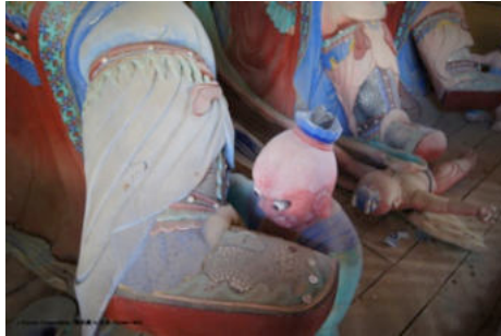
ภาพที่ 20 รูปปีศาจมาร ทำเป็นรูปมนุษย์เด็กไว้จุก

จิตโลกบาล: คติความเชื่อเดิม รูปแบบทางความงามทางสุนทรียภาพที่แตกต่าง ในประเทศอินเดีย จีน ญี่ปุ่น ไต้หวัน และเกาหลีใต้