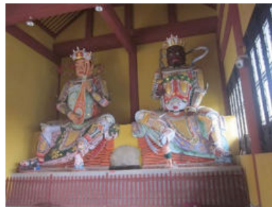
ภาพที่ 10 ธรรมะกับวิรุฬหก วัดชีชินซาน