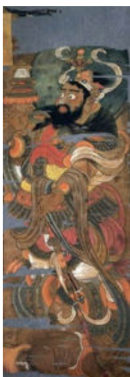
ภาพที่ 4 เวสสวัณ (Tamonten) (เหนือ)

ในถ้ำตุนหวงยังมีหลักฐานที่พบในจิตรกรรม ที่วาดรูปจิตโลกบาลลงบนผ้าไหม จัดอยู่ในสมัยราชวงศ์ถัง ปัจจุบันจัดแสดงในพิพิธภัณฑ์บริติช ประเทศอังกฤษ ซึ่งการสร้างภาพจิตรกรรมรูปจิตโลกบาลมีการทำมาก่อนแล้วในสมัยราชวงศ์สุย (Fan, 2010 : 51) ทำให้เราเข้าใจได้ว่าการสร้างรูปจิตโลกบาลไม่ได้ทำในรูปแบบประติมากรรมเท่านั้น ยังสามารถสร้างรูปแบบในผลงานจิตรกรรมด้วย ยกตัวอย่างภาพเวสสวัณกับวิรูปักษ์ ทั้งสองภาพอยู่ในชุดนักรบ อยู่ในท่ายืนเหยียบปีศาจ เวสสวัณถือสัญลักษณ์เจดีย์ด้วยมือขวา มือซ้ายถือกระบี่ วิรูปักษ์ถือกระบี่มือซ้าย มือขวาจับด้านบนของกระบี่ ทั้งสององค์รูปร่างอ้วน ใบหน้าทั้งสองไว้หนวดเครา หน้าดุตาโต บนศีรษะมีกระบังสวมมัดจุณม ด้านหลังศีรษะมีประภามณฑลวงกลมประดับ (ดูภาพที่ 4-5 ประกอบ)