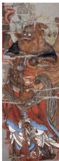
ภาพที่ 5 วิรูปักษ์ (Komokuten) (ตะวันตก)

ที่มา: https://www.onmarkproductions.com/html ที่มา: https://www.onmarkproductions.com/html