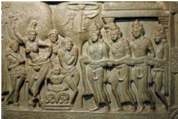
ภาพที่ 2 ภาพการประสูติพระพุทธเจ้า ศิลปะอมราวดี