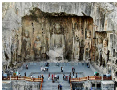
ภาพที่ 6 ถ้ำหลงเหมิน (วัดเฟิงเซียนชื่อ)

ดังนั้นภาพที่ถ้ำเฟิงเซียนชื่อ จึงจัดว่าเป็นภาพประติมากรรมที่มีสุนทรีภาพครบที่สุด นำเอาคติความเชื่อมาจัดองค์ประกอบได้อย่างสมบูรณ์ แสดงให้เห็นเป็นสัญลักษณ์ของวัด 1 วัด ผู้ผ่านเข้ามาในวัดต้องผ่านทวารบาล จตุโลกบาล พระโพธิสัตว์ และพระไวโรจนะ ตามคติความเชื่อว่าพระองค์เป็นศูนย์กลางของจักรวาล และยังแสดงถึงขนาดใหญ่เพื่อสื่อสัญลักษณ์ได้เป็นรูปธรรมมากขึ้น พระไวโรจนะทรงเป็นใหญ่และศูนย์กลางในจักรวาล (ดูภาพที่ 6-8 ประกอบ)