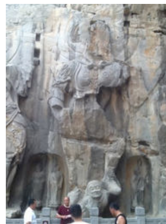
ภาพที่ 7 ถ้ำหลงเหมิน วิรุฬหก (ชำรุด)