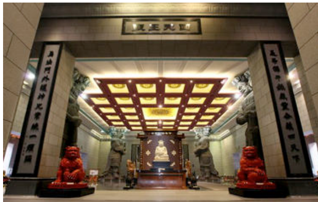
รูปที่ 13 วิหารจตุโลกบาลวัดจงไถซาน ไต้หวัน