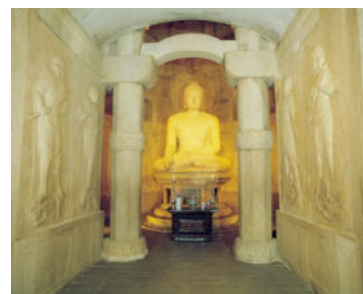
ภาพที่ 15 แสดงวิหารเจดุนิกายมหายาน วัดชอกกูรัม เกาหลีใต้