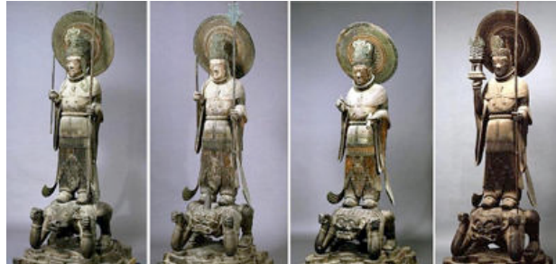
ภาพที่ 11 จตุโลกบาลวัดเฮียวจิ เริ่มจากซ้ายจรดขวา วิรุฬหก วิรูปักษ์ และเวสสวัณ