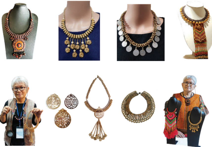
ภาพที่ 5 : ตัวอย่างผลงานสร้างสรรค์สร้อยคอกะลามะพร้าวรูปแบบต่าง ๆ ของนางยุพาพร ว่องวิทย์การ ที่มา : ภาพถ่ายของยุพาพร ว่องวิทย์การ วันที่ 20 ตุลาคม 2563