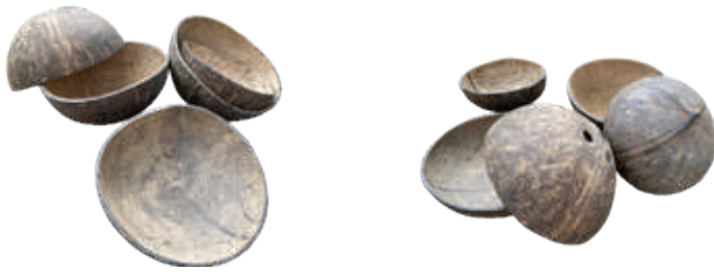
ภาพที่ 2 : กะลามะพร้าวแก่ ซึ่งเป็นวัสดุหลักสำคัญในการสร้างสรรค์รูปแบบเครื่องประดับ