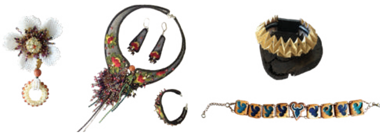
ภาพที่ 1 : ตัวอย่างเครื่องประดับเทียมรูปแบบต่างๆ

(องค์การมหาชน) (2563,ออนไลน์) ที่ระบุว่า เครื่องประดับเทียม (เครื่องประดับแฟชั่น) เป็นสินค้าแฟชั่นทางเลือกที่ขึ้นอยู่กับความพึงพอใจของผู้บริโภค และมักเป็นที่นิยมในช่วงภาวะเศรษฐกิจชะลอตัว เพราะผู้บริโภคกำลังซื้อลดลง จึงระมัดระวังการใช้จ่ายซื้อสินค้าที่มีราคาสูง รวมถึงราคาโลหะมีค่าที่ปรับตัวเพิ่มสูงขึ้น ทำให้ผู้บริโภคหันมาซื้อเครื่องประดับเทียมมากขึ้น ซึ่งในปี 2019 ตลาดเครื่องประดับเทียมของโลกมีมูลค่า 32.9 พันล้านดอลลาร์สหรัฐ สู่ภาพสตรีมีส่วนแบ่งกว่าครึ่งหนึ่งของการใช้เครื่องประดับเทียมทั้งหมด และคาดการณ์ว่ามูลค่าเครื่องประดับเทียมของโลกจะเพิ่มเป็น 59.7 พันล้านดอลลาร์สหรัฐในปี 2027 โดยระหว่างปี 2020-2027 เครื่องประดับเทียมจะมีอัตราเติบโตเฉลี่ยร้อยละ 7.8 ต่อปี นอกจากนี้หากพิจารณาในด้านรูปแบบเครื่องประดับเทียมนั้น สร้อยคอและสร้อยข้อมือมีสัดส่วนรวมกันราว ร้อยละ 41.4 และมีแนวโน้มขยายตัวมากขึ้นในกลุ่มผู้บริโภคทั้งหญิงและชาย ดังภาพที่ 1