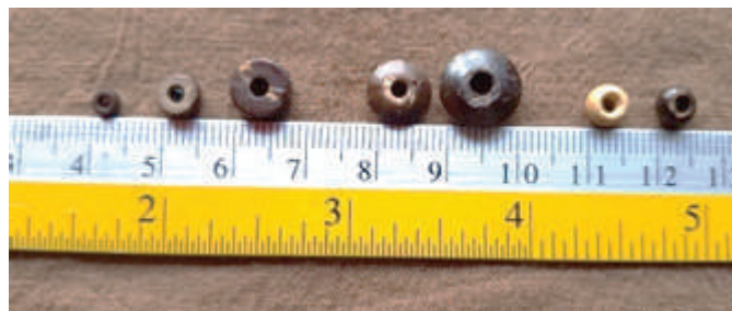
ภาพที่ 3: ชิ้นส่วนของกะลามะพร้าวรูปกระดุมหรือวงแหวนขนาดต่าง ๆ ที่ใช้ทำชิ้นงานเครื่องประดับ ที่มา : ภาพถ่ายของยูพาพร ว่องวิทย์การ วันที่ 2 พฤศจิกายน 2563