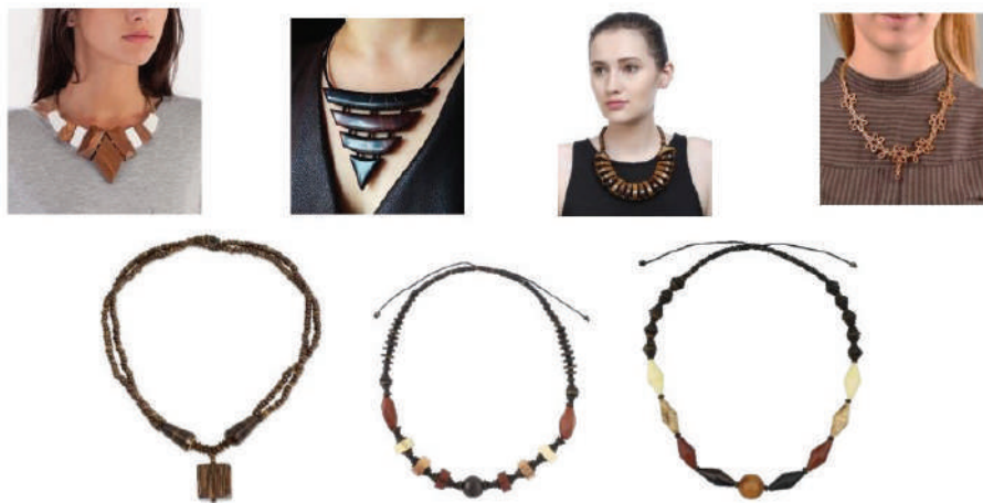
ภาพที่ 6 : สร้อยคอทำจากไม้และกะลามะพร้าว ซึ่งเป็นที่นิยมของผู้บริโภคอีกกลุ่มหนึ่งและยังเป็นลักษณะการออกแบบที่เรียกว่า Eco Design

ที่มา : https://www.pinterest.com/pin/479985272786724850/ และ https://www.novica.com/p/wood-and-coconut-shell-beaded-necklace/307342/