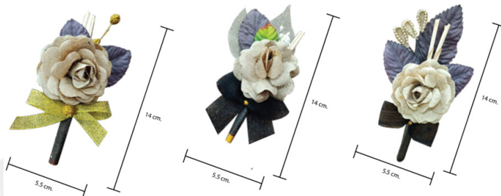
ภาพที่ 1 ดอกไม้จันทน์กลุ่มวิสาหกิจชุมชน กลุ่มแม่บ้านแสงตะวัน อำเภอสามโคก จังหวัดปทุมธานี

จากการลงพื้นที่สำรวจเพื่อเก็บข้อมูลผลิตภัณฑ์จากกระดาดฟางข้าววิสาหกิจชุมชนกลุ่มแม่บ้าน แสงตะวัน อำเภอสามโคก จังหวัดปทุมธานี ควบคู่ไปกับการศึกษาเอกสารและงานวิจัยที่เกี่ยวข้อง เพื่อนำข้อมูลที่ได้ไปทำการสนทนา แบบกลุ่ม (Focus Group) ซึ่งมีผู้เข้าร่วมในการสนทนาทั้งหมด 9 ท่าน ได้แก่ผู้เชี่ยวชาญด้านการออกแบบ 2 ท่าน ผู้เชี่ยวชาญด้านการตลาด 2 ท่าน นักพัฒนาชุมชน 1 ท่าน ผู้บริโภค 2 ท่าน และตัวแทนกลุ่ม 2 ท่าน เพื่อทำการคัดเลือกผลิตภัณฑ์ที่มีความเหมาะสมต่อ การนำไปออกแบบบรรจุภัณฑ์ จากการสนทนาดังกล่าวพบว่าผลิตภัณฑ์จากกระดาดฟางข้าวกลุ่ม วิสาหกิจชุมชนกลุ่มแม่บ้านแสงตะวัน มีจำนวน 7 ประเภท ได้แก่ พานบายสี, พานแว่นฟ้า, พานพุ่ม บูชาพระ, พานรูปเทียนแพ, พวงหรีดสำหรับงานพิธี, ดอกไม้สำหรับประดับตกแต่งสถานที่ และ ดอกไม้จันทน์ และการวิเคราะห์ด้วยการสนทนาดังกล่าวพบว่าผลิตภัณฑ์จากกระดาดฟางข้าวทั้ง 7 ประเภทไม่มีการผลิตเพื่อรอจำหน่าย (made-to-stock) แต่เป็นการผลิตแบบตามคำสั่งซื้อ (made-to-order) และจากการนำข้อมูลยอดการสั่งซื้อมาวิเคราะห์ร่วมกับข้อมูลด้านการผลิตพบว่า “ดอกไม้จันทน์” เป็นผลิตภัณฑ์ที่มียอดการสั่งซื้อมากกว่าผลิตภัณฑ์ประเภทอื่นของทางกลุ่ม จากข้อมูลดังกล่าวผู้ร่วม สนทนาแบบกลุ่มจำนวน 9 ท่าน เห็นพ้องกันว่า “ดอกไม้จันทน์” เป็นผลิตภัณฑ์ที่มีความเหมาะสมทั้ง ในด้านยอดขายและกระบวนการผลิต รวมถึงวัสดุที่ใช้ยังสามารถหาได้ภายในชุมชนซึ่งช่วยลดต้นทุน ในการผลิต จากที่กล่าวในข้างต้นทำดอกไม้จันทน์มีความเหมาะสมต่อการนำไปออกแบบบรรจุภัณฑ์มาก ที่สุด