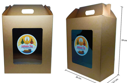
ภาพที่ 7 ตราสัญลักษณ์และบรรจุภัณฑ์กลุ่มแม่บ้านแสงตะวันที่ได้พัฒนาขึ้นมาใหม่

ยังไม่ก่อให้เกิดผลเสียต่อสิ่งแวดล้อม ผู้เชี่ยวชาญได้นำต้นแบบบรรจุภัณฑ์ รูปแบบที่ 1 ไปทำการประเมิน โดยผู้ทรงคุณวุฒิจำนวน 3 ท่าน ซึ่งได้ให้ข้อเสนอแนะว่าควรมีการเสริมความแข็งแรงตรงกันบรรจุเพื่อ ป้องกันความเสียหายที่อาจเกิดจากการใช้งาน และยังเป็นการเสริมความแข็งแรงให้กับบรรจุภัณฑ์จาก ข้อเสนอแนะดังกล่าวผู้วิจัยได้นำมาทำการสรุปเพื่อใช้เป็นแนวทางในการปรับปรุงแก้ไขบรรจุภัณฑ์ ก่อนนำเข้าสู่กระบวนการผลิตในลำดับต่อไป