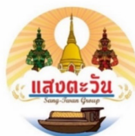
รูปแบบที่ 3