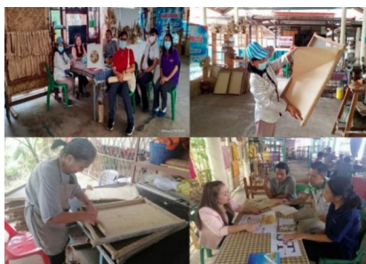
ภาพที่ 2 การสนทนาแบบ (Focus Group) เพื่อหาแนวทางในการออกแบบตราสัญลักษณ์และบรรจุภัณฑ์

1) การออกแบบตราสัญลักษณ์ ผู้เชี่ยวชาญด้านออกแบบได้สร้างภาพองค์ประกอบในการออกแบบตราสัญลักษณ์เพื่อใช้ในการสนทนาแบบกลุ่ม (Focus Group) ซึ่งประกอบด้วยผู้เชี่ยวชาญด้านการออกแบบ 2 ท่าน ผู้เชี่ยวชาญด้านการตลาด 2 ท่าน นักพัฒนาชุมชน 1 ท่าน ผู้บริโภค 2 ท่าน และตัวแทนกลุ่ม 2 ท่าน ซึ่งได้ข้อสรุปดังนี้ ตราสัญลักษณ์ของวิสาหกิจชุมชนกลุ่มแม่บ้านแสงตะวัน ควรนำเอาเอกลักษณ์ของท้องถิ่นรวมถึงเอกลักษณ์ของวัดไก่เตี้ยซึ่งเป็นสถานที่ตั้งของกลุ่มแม่บ้านแสงตะวันมาใช้ในการออกแบบ และควรนำเอา “รูปพระอาทิตย์” ซึ่งเคยถูกใช้ครั้งแรกในปี 2544 โดยคุณชม บุญบัวหลวง ซึ่งเป็นผู้ก่อตั้งกลุ่มแม่บ้านแสงตะวันและโดยได้นำเอา “รูปพระอาทิตย์” และคำว่า “แสงตะวัน” ซึ่งเป็นชื่อของหลานสาว มาใช้เป็นตราสัญลักษณ์และนำไปติดบนตัวผลิตภัณฑ์ของชุมชน ต่อมาเมื่อกลุ่มแม่บ้านแสงตะวันได้จดทะเบียนเป็นวิสาหกิจชุมชนในปี 2548 ทางกลุ่มได้ยกเลิกการใช้ “รูปพระอาทิตย์” และใช้เพียงแต่คำว่า “แสงตะวัน” แทนตราสัญลักษณ์มาจนถึงปัจจุบัน จากข้อมูลดังกล่าวผู้วิจัยได้นำมาทำการสรุปอยู่ในรูปแบบของ Mood Broad ดังภาพที่ 3 ที่แสดงถึงความต้องการที่มีต่อตราสัญลักษณ์ ซึ่งสอดคล้องกับ ศิริพรรณ ปีเตอร์ (2549 : 205) ที่ได้กล่าวไว้ว่า กระบวนการออกแบบมีความสอดคล้องกับกระบวนการความคิดสร้างสรรค์เพื่อมุ่งค้นหาแนวทางแก้ปัญหาที่เหมาะสมที่สุดและสอดคล้องกับวัตถุประสงค์ในการออกแบบ ภายใต้เงื่อนไขที่จำกัด