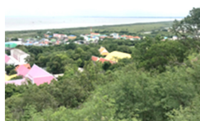
ภาพที่ 2 อ่าวเมืองชลบุรีตอนบน