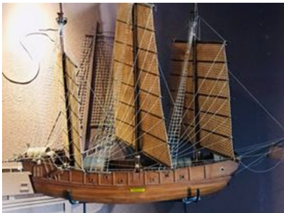
ภาพที่ 29 เรือสำเภาจำลอง

5.2.2 การออกแบบดนตรี เพลงระบำศรีฟโล เป็นทำนองเพลงที่ประพันธ์ขึ้นใหม่ โดยอ้างอิงแนวคิดในการประพันธ์เพลงชุดระบำโบราณคดีของกรมศิลปากร ที่ใช้อิทธิพลของงานศิลปกรรมที่แบ่งตามยุคสมัย ดังนั้น ทวารวดี ลพบุรี สุโขทัยและอยุธยา ประกอบกับข้อมูลทางประวัติศาสตร์และพื้นที่ของผลการวิจัย ทำนองเพลงมีสำเนียงและลีลาแตกต่างกันออกไปในแต่ละท่อน กำหนดรูปแบบของทำนองเพลงขึ้นต้นด้วยรัว เพลงช้า เพลงเร็ว และท้ายเพลงลงจบให้สอดคล้องกับแนวคิดและลีลาของท่ารำ โดยใช้วงปี่พาทย์ไม้นวมบรรเลงประกอบการแสดง