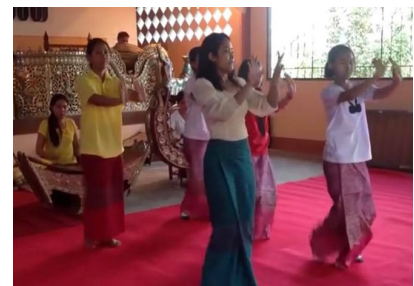
ภาพที่ 27 การใช้เท้ารำมอญ ที่มา: บันทึกการแสดง ศูนย์วัฒนธรรมมอญ บ้านวังกะ อ.สังขละบุรี จ.กาญจนบุรี (2562)