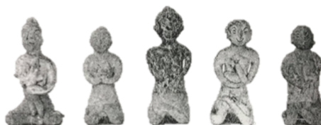
ภาพที่ 9 ตึกตาเสียกบาลอุ้มลูก