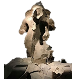
ภาพที่ 23 พระคเณศ