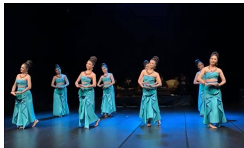
ภาพที่ 12 ท่ารำพระพุทธรูปปางมารวิชัยสมัยทวารวดี