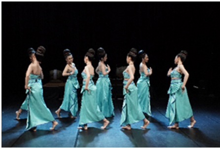
ภาพที่ 16 ทำรำพระปางลีลา