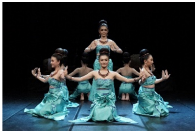
ภาพที่ 24 ทำรำพระพนัสบดี