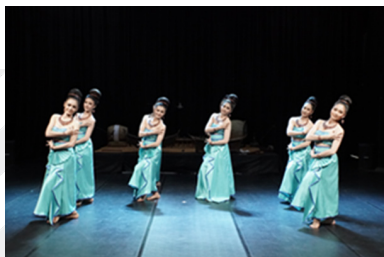
ภาพที่ 8 ท่ารำตึกตาเสียกบาล