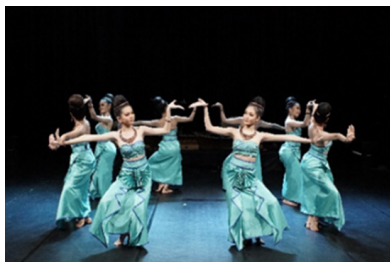
ภาพที่ 4 ท่ารำรูปผังเมือง

- ทำรำจากการออกแบบท่ารำที่ได้แรงบันดาลใจจากโบราณสถาน เนินดินกำแพง เมืองศรีฟโล การเคลื่อนที่และการจัดระเบียบร่างกายเป็นแนวตั้งฉากกับพื้น การวางเท้าแบบรูปปั้น สมัยทวารวดี การจัดแถวรูปสี่เหลี่ยมตามแบบผังเมือง