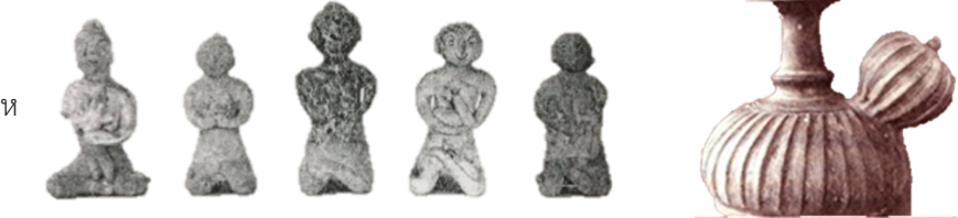
ภาพที่ 30 ตุ๊กตาเคลือบสมัยสุโขทัย ภาพที่ 31 หม้อทะนน

ผู้วิจัยได้รับแนวคิดและแรงบันดาลใจจากตุ๊กตาเสียบาลอัมลูก ซึ่งเป็นศิลปะแบบสุโขทัย โดยผู้วิจัยเลือกใช้ทรงผมแบบมวยสูง ผ้ารัดอก ผ้านุ่งชั้นในยาวกรอมเท้า ผ้าชั้นนอกคลุมปล่อยชายทั้งสองข้าง บริเวณหน้าขา โดยผ้ารัดอกและผ้านุ่งใช้สีเขียวในการตัดเย็บตามสีของเครื่องเคลือบดินเผาที่ค้นเจอในบริเวณอ่าวชลบุรี ซึ่งสมัยนั้นนิยมใช้สีโทนสีเขียว สีเขียวไข่กา และสีน้ำเงินขลิบตามลายผ้า ซึ่งสีน้ำเงินเป็นสีของเครื่องถ้วยชามของจีนสมัยราชวงศ์หมิงที่ค้นเจอและนิยมในสมัยนั้นเช่นกัน รวมถึงลายจีบของผ้าจากหม้อทะนน