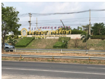
ภาพที่ 5 เนินดินบริเวณสถาบันพลศึกษา จ.ชลบุรี

- ทำรำจากการออกแบบท่ารำที่ได้แรงบันดาลใจจากการออกแบบท่ารำจากโบราณวัตถุ กระเบื้องดินเผาเชิงชายหลังคารูปเทพพนมอยู่ในซุ้มเรือนแก้ว ตึกตาเสียกบาลอุ้มลูก