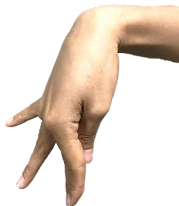
ภาพที่ 35 จีบมือแบบอุทอง

- จีบมือ (แบบอุทอง) ได้รูปแบบมาจากลักษณะนิ้วของพระพุทธรูปแบบอุทอง ลักษณะดังนี้คือ ปลายนิ้วหัวแม่มือจรดข้อนิ้วชี้และนิ้วกลาง ข้อแรกนิ้วที่เหลือเหยียดตั้ง