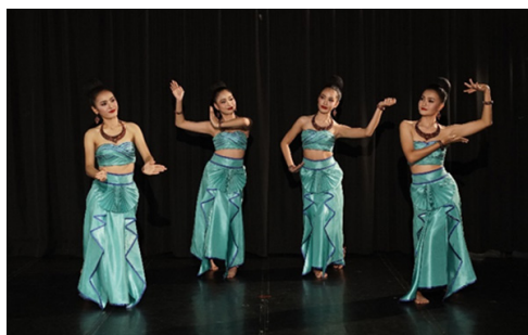
ภาพที่ 33 เครื่องแต่งกายระบำศรีพล