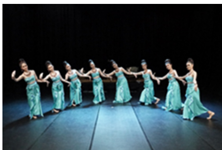
ภาพที่ 1 ท่ารำคลื่นน้ำทะเล

- ท่ารำที่ได้แรงบันดาลใจจากการออกแบบท่ารำจากธรรมชาติ คลื่นน้ำในอ่าวเมืองชลบุรีตอนบน การเดินทางของคลื่นน้ำในอ่าวเมืองชลบุรี การใช้ท่ารำที่อ่อนแอตอดัดกัน การเอียงโย้ตัวในการเคลื่อนไหวที่ การจัดรูปแบบแถวเป็นวงโค้งรูปอ่าว