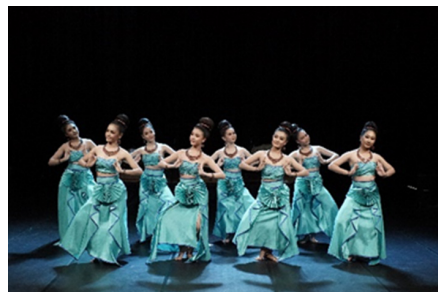
ภาพที่ 14 ท่ารำพระพุทธรูปปางแสดงธรรม