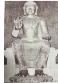
ภาพที่ 11 พระคันธารราษฎร์