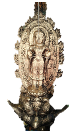
ภาพที่ 25 พระพนัสบดี

- ทำรำจากการออกแบบท่ารำที่ได้แรงบันดาลใจจากการออกแบบท่ารำจากชาติพันธุ์ชนชาติมอญกลุ่มชาติพันธุ์แรกที่ได้รับอารยธรรมทวารวดีและแผ่ขยายสู่ดินแดนภาคพื้นเอเชียอาคเนย์ ลีลาการไหว้ การถัดเท้าตามแบบท่ารำของชาวมอญ