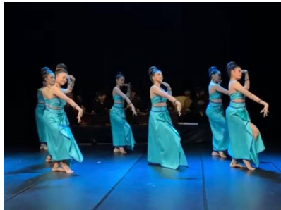
ภาพที่ 22 ทำรำพระคเณศ