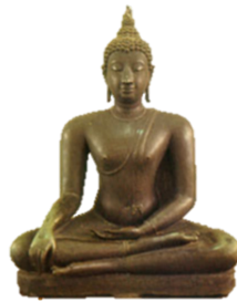
ภาพที่ 19 พระพุทธรูปปางมารวิชัยแบบอุททอง

5.2.2.3 ช่วงที่ 3 ความเชื่อในเทพเจ้า การเข้ามาของอิทธิพลอารยธรรมละโว้ พระ วิษณุ พระคเณศ พระพนัสบดี