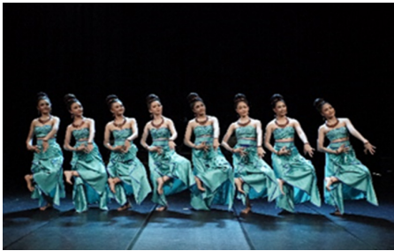
ภาพที่ 18 ทำรำพระปางมารวิชัยแบบอุททอง