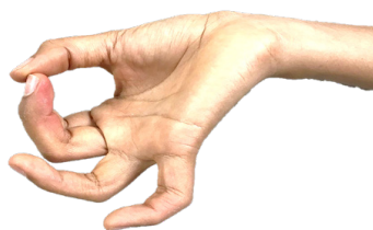
ภาพที่ 34 จีบมือแบบละไว้

- จีบมือ (จีบแบบละไว้) ได้รูปแบบมาจากลักษณะนิ้วของเทวรูปพระวิษณุมีลักษณะดังนี้ คือ ปลายนิ้วหัวแม่มือจรดปลายนิ้วชี้และนิ้วกลาง นิ้วที่เหลืองอเข้าหาฝ่ามือ