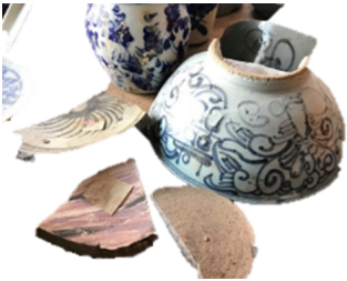
ภาพที่ 32 เครื่องถ้วยชามของจีน สมัยราชวงศ์หมิง

เครื่องประดับประกอบด้วย สร้อยคอ ต่างหู กำไลข้อมือและกำไลข้อเท้า โดยจินตนาการจากกำไลสำริดที่ขุดพบและเครื่องประดับสมัยอยุธยาที่มีความเจริญทางด้านศิลปะเป็นต้นแบบในยุคต่อ ๆ มา ดังภาพที่ปรากฏ