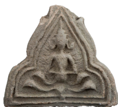
ภาพที่ 7 กระเบื้องดินเผาเชิงชายหลังคารูปเทพพนม