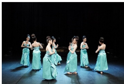
ภาพที่ 26 ทำรำพนมมือไหว้

- ทำรำจากการออกแบบท่ารำที่ได้แรงบันดาลใจจากการออกแบบท่ารำจากชาติพันธุ์ชนชาติมอญกลุ่มชาติพันธุ์แรกที่ได้รับอารยธรรมทวารวดีและแผ่ขยายสู่ดินแดนภาคพื้นเอเชียอาคเนย์ ลีลาการไหว้ การถัดเท้าตามแบบท่ารำของชาวมอญ