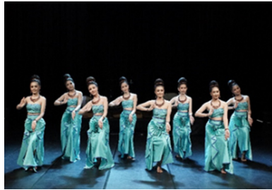
ภาพที่ 10 ท่ารำพระคันธารราษฎร์ ที่มา: ศุภาศิณี บุญเกาะ (2563)

- ทำรำจากการออกแบบท่ารำที่ได้แรงบันดาลใจจากการออกแบบท่ารำจากประติมากรรม พระพุทธรูป จากการเข้ามาของพระพุทธศาสนา อิทธิพลอารยธรรมทวารวดี สุโขทัยและอุททอง พระคันธารราษฎร์, พระพุทธรูปปางมารวิชัยสมัยทวารวดี พระพุทธรูปปางแสดงธรรม พระเนื้อชินปางลีลา สมัยสุโขทัย พระพุทธรูปปางมารวิชัยแบบอุททอง