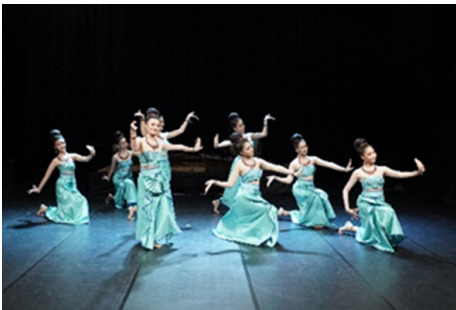
ภาพที่ 28 ท่ารำรูปเรือสำเภา

5.2.2.4 ช่วงที่ 4 รุ่งเรืองการค้าขาย การติดต่อกับชาวต่างชาติ อาณาจักรสุโขทัย อาณาจักรอยุธยาเพื่อแลกเปลี่ยนสินค้าและค้าขาย - ทำรำจากการออกแบบท่ารำที่ได้แรงบันดาลใจจากการออกแบบท่ารำจากยานพาหนะ เรือสำเภาจีนและ ญวน โครงสร้างของลำ ส่วนหัวเรือ ส่วนท้ายเรือ และเสากระโดงเรือ