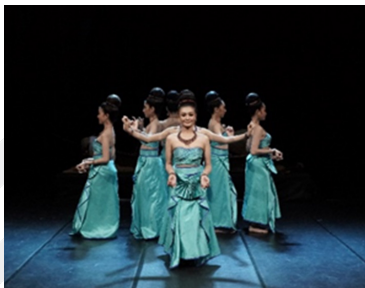
ภาพที่ 20 ทำรำพระวิษณุสี่กร

- ทำรำจากการออกแบบท่ารำที่ได้แรงบันดาลใจจากการออกแบบท่ารำจากประติมากรรม เทวรูป อิทธิพลอารยธรรมละโว้พระวิษณุสี่กร พระคเณศ พระพนัสบดี ผสมผสานระหว่างท่ารำการ เคลื่อนไหวแบบนาฏศิลป์ไทยและแบบเขมร