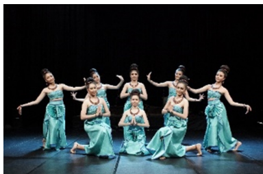
ภาพที่ 6 ท่ารำเข้าซุ้มในท่าเทพพนม ที่มา: สุทธาฉิน บุญเกาะ (2563)

- ทำรำจากการออกแบบท่ารำที่ได้แรงบันดาลใจจากการออกแบบท่ารำจากโบราณวัตถุ กระเบื้องดินเผาเชิงชายหลังคารูปเทพพนมอยู่ในซุ้มเรือนแก้ว ตึกตาเสียกบาลอุ้มลูก