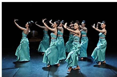
ภาพที่ 36 ทำรำพระคเณศชูงวง