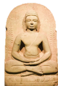
ภาพที่ 13 ลายปูนปั้นพระพุทธรูป สมัยทวารวดี