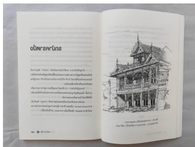
ภาพที่ 5 : ความเรียงและภาพลายเส้น (บางส่วน)ในหนังสือ (ที่มา : ไพโรจน์ ไชยเมืองขึ้น. ลำปางยังหวานอยู่. พิมพ์ครั้งที่ 2. ลำปาง : สำนักงานจังหวัดลำปาง, 2559, หน้า 12-13)