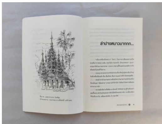
ภาพที่ 4 : ความเรียงและภาพลายเส้น (บางส่วน)ในหนังสือ