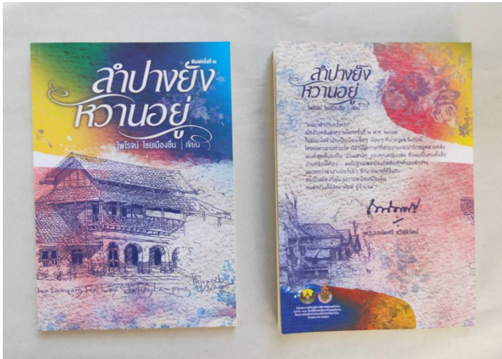
ภาพที่ 6 : หนังสือลำปางยังหวานอยู่ฉบับพิมพ์ครั้งที่ 2 เมื่อเดือนกันยายน พ.ศ.2553 จัดพิมพ์โดยสำนักงานจังหวัดลำปาง จำนวน 1,000 เล่ม (ที่มา : ไพโรจน์ ไชยเมืองขึ้น. ลำปางยังหวานอยู่. พิมพ์ครั้งที่ 2. ลำปาง : สำนักงานจังหวัดลำปาง, 2559, ปก)