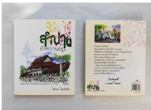
ภาพที่ 2 : หนังสือลำปางยังหวานอยู่ฉบับพิมพ์ครั้งที่ 1 เมื่อเดือนพฤศจิกายน พ.ศ.2553 (ที่มา : ไพโรจน์ ไชยเมืองขึ้น. ลำปางยังหวานอยู่. กรุงเทพฯ : โรงพิมพ์ตะวันออก, 2553, ปก)

เมื่อผู้เขียนได้เขียนความเรียงสารคดีเชิงวัฒนธรรมเกี่ยวกับเรื่องราวทางประวัติศาสตร์และวัฒนธรรมลงตีพิมพ์เผยแพร่ในหนังสือพิมพ์ลำปางนิวส์มีจำนวนมากในระดับหนึ่งแล้ว จึงมีแนวคิดที่จะรวมความเรียงเพื่อจัดทำเป็นหนังสือสารคดีเชิงวัฒนธรรมเพื่อเผยแพร่ในวงกว้างมีความยาว 168 หน้า โดยตั้งชื่อหนังสือว่า “ลำปางยังหวานอยู่” ผู้เขียนได้ขอการสนับสนุนจากบริษัท ห้างร้านและบุคคลต่าง ๆ ในจังหวัดลำปางจนได้เงินจำนวนหนึ่งที่เพียงพอต่อการจัดพิมพ์เป็นหนังสือ และได้ขอความอนุเคราะห์ภาพลายเส้นสถาปัตยกรรมจากศาสตราจารย์ชานธีรศักดิ์ วงศ์คำแน่น จำนวน 26 ภาพเพื่อนำมาจัดทำเป็นภาพหน้าปกหนังสือและประกอบความเรียงที่ปรากฏในหนังสือด้วย ตลอดจนได้รับความกรุณาจากหม่อมราชวงศ์ถนัดศรี สวัสดิวัตน์ ซึ่งเป็นบุคคลที่มีชื่อเสียงระดับชาติและมีความผูกพันกับเมืองลำปางมากกว่า 60 ปีได้เขียนคำนิยมในหนังสือให้แก่ผู้เขียนอีกด้วยนับเป็นการเพิ่มคุณค่าให้แก่หนังสือเล่มนี้อย่างยิ่ง ผู้เขียนได้จัดพิมพ์ครั้งแรกเมื่อเดือนพฤศจิกายน พ.ศ.2553 จำนวน 2,000 เล่ม