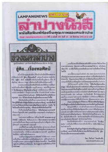
ภาพที่ 1 : ตัวอย่างความเรียงตีพิมพ์ในหนังสือพิมพ์ลำปางนิวส์

ผู้เขียนเริ่มเขียนความเรียงสารคดีเชิงวัฒนธรรมเกี่ยวกับเรื่องราวทางประวัติศาสตร์และวัฒนธรรมของเมืองลำปางลงตีพิมพ์ในหนังสือพิมพ์ท้องถิ่นของจังหวัดลำปางชื่อ “หนังสือพิมพ์ลำปางนิวส์” ระหว่างปี พ.ศ.2552-2553 โดยเริ่มเขียนในคอลัมน์นี้ในชื่อ “ช่วงนครลำปาง” ได้เขียนความเรียงจำนวน 30 เรื่องซึ่งตีพิมพ์เป็นประจำในทุกสัปดาห์ตัวอย่างเช่น วิหารพระเจ้าพันองค์ ผู้คังเรื่องหอศิลป์ ล่องสะเปาบนสายน้ำวัง เยือนบ้านเสานัก เมืองดองคำสาป วันพ่อเจ้าทิพย์ช้าง รถม้าคราหนึ่งศึกพม่าในดงขมิ้น เจ้าสัวแห่งลำปาง ปรศนาแห่งคุ้มหลวง คึกฤทธิ์เล่าชีวิตฝรั่ง บุญแห่งปู่สกา แงโฮะตำหรับแม่แห คนเมืองปู่ก้าเมือง ถนนยู่ทอง ความทรงจำเชียงใหม่-ลำปาง รุ่งอรุณที่กาตเก้าจาว ปฏิวัติกาตกองต้า ถาองค์ดำเสด็จลำปางเจ้าคุ้มหลวงนครสุดท้าย เป็นต้น นอกจากนี้ยังได้รับการติดต่อขอให้นำความเรียงบางส่วนลงเผยแพร่ผ่านสื่ออิเล็กทรอนิกส์ชื่อ on lampang : เปิดโลกลำปาง