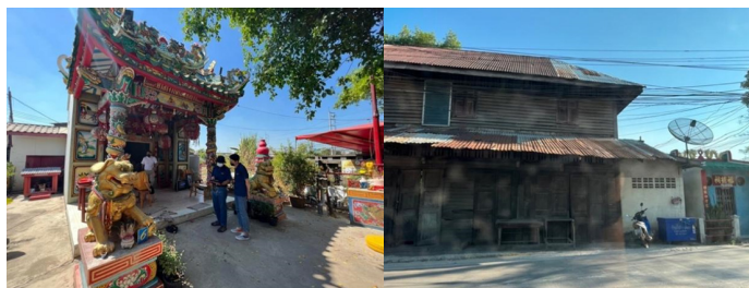
ภาพที่ 3 ศาลเจ้าและที่พักอาศัยของคนในทุ่งรังสิตที่มีกลิ่นอายของวัฒนธรรมในอดีต

1.2.1 การขยายตัวของเมือง มีการเปลี่ยนแปลงรูปแบบของสถาปัตยกรรม สถานที่ และชุมชน โดยมีการเข้าอยู่อาศัยของกลุ่มคนมากยิ่งขึ้น ก่อเกิดการขยายตัวของเมืองทั้งการมีศูนย์การค้า ที่ทันสมัย มีพิกัดถนนต่าง ๆ ที่อยู่ในพื้นที่ชุมชน มีการคมนาคมที่สะดวกเข้าถึงเชื่อมโยงไปในทุกท้องที่ และวิถีชีวิตริมคลองก็ค่อย ๆ ลบเลือนหายไป แต่วัฒนธรรมที่เกี่ยวกับการกิน เช่น ก๋วยเตี๋ยวเรือรังสิต การปลูกข้าวและพืชผลทางการเกษตรก็ยังคงหลงเหลืออยู่บ้าง ศาลเจ้าและวัดก็ยังเป็นสถานที่ที่อยู่ ในชุมชนเข้าใช้พื้นที่เกิดการเปลี่ยนแปลงไปจากเดิม เช่น ศาลเจ้าไต่ฮงกง ศาลเจ้าแม่ทับทิม ตาม อัตลักษณ์ของคนจีนแต่จิว และการใช้ประโยชน์จากที่ดินก็เปลี่ยนรูปไปพื้นที่ทำนากลายเป็นที่อยู่อาศัย มากขึ้น