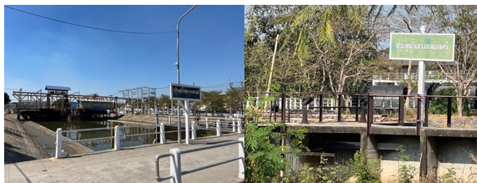
ภาพที่ 2 ประตูน้ำจุกฟ้างกระณและประตูน้ำเสาวภาผ่องศรี ที่ใช้ในการบริหารจัดการน้ำในคลองรังสิตประยูรศักดิ์

การก่อสร้างเมืองอีกแห่งหนึ่ง โดยมีการจัดตั้งตลาด ที่อยู่อาศัย บริเวณนี้เป็นหลักแหล่ง มีตลาดเก่าคลองเจ็ดที่เป็นตลาดไม้ริมน้ำที่สำคัญ เมื่อสมัยอดีตคนจะพายเรือมาซื้อสินค้าที่ตลาดแห่งนี้จำนวนมากทั้งของกิน ของใช้ และอื่น ๆ ที่จำเป็นในการใช้ชีวิต” (นายวิวัฒน์วงศ์คุปไทย, 30 ก.ค. 2564, สัมภาษณ์)