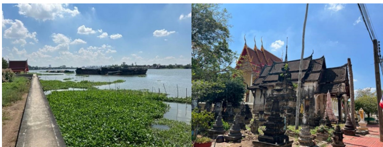
ภาพที่ 1 ปากคลองรังสิตประยูรศักดิ์ บริเวณจุดที่เริ่มต้นคลองที่แยกมาจากแม่น้ำเจ้าพระยา บริเวณวัดเทียนถวาย

“การขุดคลอง พื้นที่ทุ่งหลวงนี้ในอดีตจะมีหนองน้ำ มีลำคลองต่าง ๆ พอเริ่มมีการขุดคลอง ก็มีการตั้งชื่อตามชื่อนั้น ๆ หรือตามการเพาะปลูกที่พื้นที่นี้มีการปลูกข้าวมาก เช่น วัดผลหาร วัดหว่านบุญ วัดเทียนเขตและวัดมูลจินดารามเป็นวัดที่มีมาก่อนการขุดคลอง พระพุทธเจ้าหลวงเคยเสด็จมาที่นั่น และปลูกต้นพิบูลไผ่หน้าวัดตอนนี้อยู่ที่เดิม” (นายวีรวัฒน์วงศ์สุปไทย, 30 ก.ค. 2564, สัมภาษณ์)