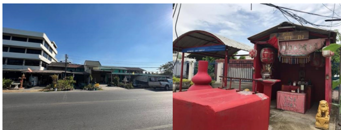
ภาพที่ 5 เรือนแถวไม้ที่ตั้งอยู่เคียงข้างเรือนแถวสมัยใหม่และศาลเจ้าบริเวณริมคลองหก