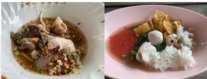
ภาพที่ 8 ก๋วยเตี๋ยวเรือของร้านไชยไกว คลองหก อำเภอธัญบุรี จังหวัดปทุมธานี

ระยะที่สาม ในยุคปัจจุบัน เริ่มมาเมื่อประมาณปี 2535 ที่นำเอาก๋วยเตี๋ยวเรือลงไปขายในเรือเอี่ยมจุ่นที่ปรับปรุงให้เป็นเรือที่สามารถขายก๋วยเตี๋ยวได้ โดยการทำสะพานทางเดินจากฝั่งเข้าไปในเรือเพื่อให้คนที่มารับประทานสามารถเดินเข้าไปนั่งในเรือได้ ซึ่งในปัจจุบันมีร้านก๋วยเตี๋ยวเรืออยู่ตามแนวคลองรังสิตประมาณ 23 ร้านค้าที่ประกอบกิจการขายก๋วยเตี๋ยว (จันจิมา อังคพณิชกิจ, พิพัฒน์ กระแจะจันทร์, 2558)