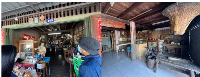
ภาพที่ 4 วิถีชีวิตของคนในปัจจุบันที่ผสมผสานจากวัฒนธรรมเดิมและพิพิธภัณฑ์ในชุมชน

1.2.3 การสืบทอดทางวัฒนธรรมที่ยังคงหลงเหลืออยู่ในปัจจุบัน วัฒนธรรมที่ยังคงอยู่เช่น การตักบาตรหรือทำบุญให้กับวัดที่มีอยู่ในท้องถิ่น การสืบทอดประเพณีการเล่นที่ปรากฏอยู่ภายในชุมชน เช่น ข้างวัดเขียนเขตในเทศบาลบึงยี่โถจะมีการเล่นจุดลูกหนูที่สืบทอดกันมายาวนาน และมีการจัดเทศกาลกินเจหรือไหว้เจ้าตามศาลเจ้าต่าง ๆ ที่อยู่ในพื้นที่ รวมถึงการรำลึกถึงการขุดคลองรังสิตที่ประตุน้ำจุฬาลงกรณ์ที่บริเวณปากคลองรังสิต และการสืบทอดขนบประเพณีต่างที่อยู่ภายในชุมชน เป็นต้น