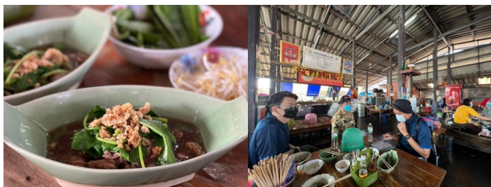
ภาพที่ 7 ก๋วยเตี๋ยวเรือนายเลิศ คลองหนึ่ง ริมคลองรังสิตประยูรศักดิ์ รสชาติดั้งเดิมมากกว่า 40 ปี