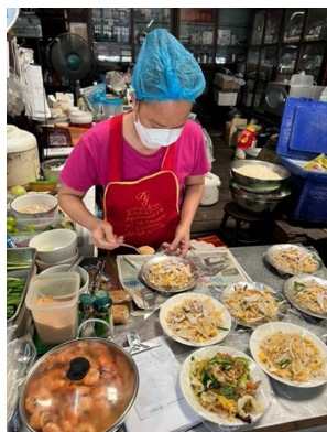
ภาพที่ 6 ก๋วยเตี๋ยวผัดไทยร้านป้ามะลิ ริมคลองหก

ในสมัยจอมพล ป. พิบูลสงครามได้มีการส่งเสริมให้บริโภคก๋วยเตี๋ยว เนื่องจากสภาวะการณ์หลังจากสงครามโลกครั้งที่ 2 ส่งผลให้สภาพเศรษฐกิจและสังคมตกอยู่ในความยากลำบาก ก๋วยเตี๋ยวเป็นอาหารที่มีคุณค่าประโยชน์และมีสารอาหารครบถ้วน จึงได้รับความนิยมมาจนกระทั่งปัจจุบันนี้ (ศิลปวัฒนธรรม, 2563)