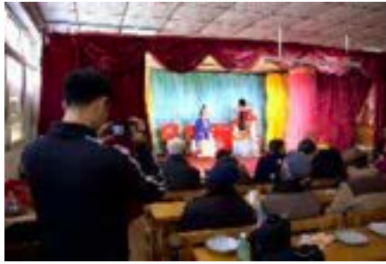
ภาพที่ 5 สภาพแวดล้อมภายในของโรงละครคณะอุปการจันญุนนาน จากตลาดอู่เจียงจงเหอ (ผู้ถ่าย: Su Yuntao ธันวาคม ค.ศ. 2019)