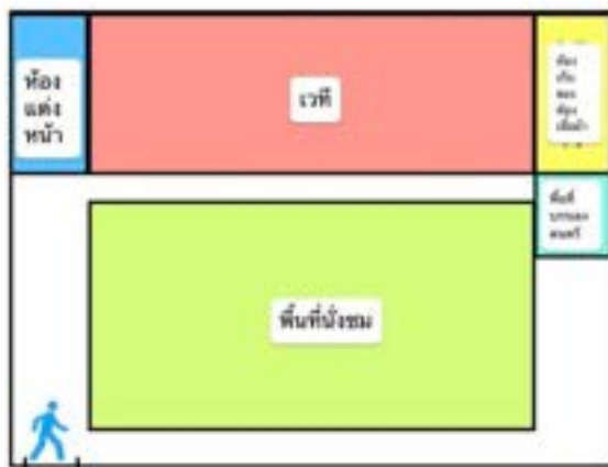
ภาพที่ 6 แผนผังสภาพแวดล้อมภายในของโรงละคร

โดยขนาดสถานที่ใหม่ของคณะอุปการจันญุนนาน มีพื้นที่ประมาณ 100 ตารางเมตร ด้านในแบ่งบริเวณดังนี้ 1.เวที 2.พื้นที่ผู้ชม 3.พื้นที่บรรเลงดนตรี 4.ห้องแต่งหน้า 5.ห้องเก็บเสื้อผ้าและอุปกรณ์ พื้นที่ของผู้ชมสามารถรองรับได้ประมาณ 25 คน มีโต๊ะเก้าอี้ค่อนข้างครบ เนื่องจากสถานที่