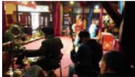
ภาพที่ 14 พื้นที่บรรเลงดนตรี