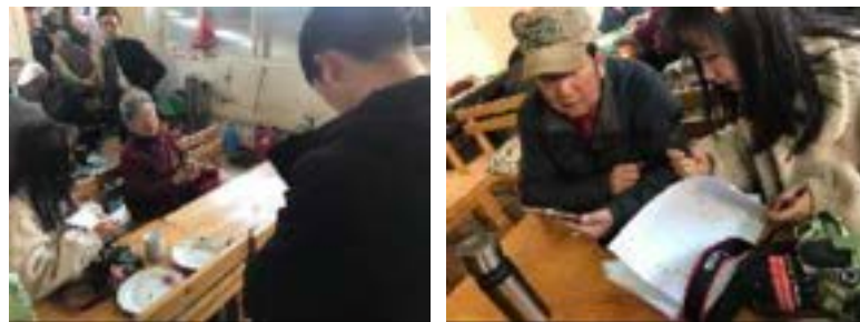
ภาพที่ 9-10 การดำเนินการอัดวิดีโอและสำรวจโดยแบบสอบถามต่อผู้ชมและสมาชิกคณะอุปรากรยูนนาน (ธันวาคม ค.ศ. 2019)

ในการสำรวจข้อมูลกลุ่มเป้าหมายผู้วิจัยกำหนดเลือกหัวหน้าคณะ 1 คน สมาชิกในคณะ 3 คน (นักแสดง 2 คน/นักดนตรี 1 คน) และ ผู้ชมซึ่งเป็นผู้สูงอายุ และใช้รูปแบบการสำรวจ ด้วยการใช้แบบสอบถาม และการสัมภาษณ์ในกระบวนการการสัมภาษณ์ พบว่าสมาชิกและผู้ชมของคณะอุปรากรยูนนานส่วนมากนั้นเป็นผู้สูงอายุที่มีอายุ 60 ปีขึ้นไป มีความยากต่อการกรอกแบบสอบถามในระดับหนึ่ง ดังนั้นผู้วิจัยได้เลือกใช้รูปแบบของการถามตอบและการจดบันทึกมาโดยมี ข้อมูลจากการวิเคราะห์สรุปผลเชิงสถิติ พบว่าแนวโน้มของการสืบสานและการอนุรักษ์ต่ออุปรากรยูนนานมีการสนับสนุนร้อยละ 100 และการสร้างผลงานภาพยนตร์สารคดีอุปรากรยูนนานมีผลกระทบต่อ การอนุรักษ์และการสืบสานจะมีผลกระทบร้อยละ 100 โดยนักแสดงและผู้ชมของอุปรากรยูนนานส่วนมากเป็นคนสูงอายุและเชื่อว่าการสร้างสรรค์ภาพยนตร์เชิงสารคดีจะเกิดบทบาทในระดับหนึ่งต่อการสืบสานและอนุรักษ์อุปรากรยูนนานในระดับหนึ่ง