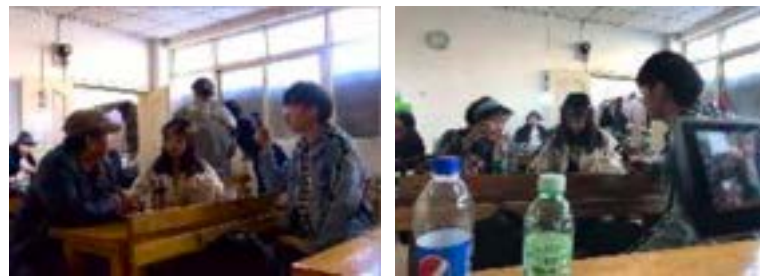
ภาพที่ 7-8 การดำเนินการสัมภาษณ์ต่อหัวหน้าคณะและสมาชิกคณะอุปรากรยูนนาน (ผู้ถ่าย:เหอเจิน ธันวาคม ค.ศ. 2019)

แห่งนี้เคยเป็นศูนย์กลางกิจกรรมทางสังคมในอดีต ส่วนพื้นที่บรรเลงดนตรี ห้องแต่งหน้าและห้องเก็บอุปกรณ์มีขนาดเล็กมาก สามารถรองรับได้เพียงแค่ 2-3 คน พื้นที่ทำกิจกรรมก็ค่อนข้างคับแคบ ซึ่งผู้วิจัยได้วิเคราะห์พบว่า ข้อดีคือมีพื้นที่แสดงเฉพาะ มีนักแสดงที่สวมชุดสำหรับการแสดง ทุก ๆ วันมีเวลาแสดงที่ชัดเจน แต่ข้อด้อย คือตำแหน่งที่ตั้งห่างไกล มีผู้ชมน้อยมาก สภาพแวดล้อมโดยรอบไม่เอื้อต่อการแสดง อีกทั้งสถานที่เล็กและจ่ายค่าเช่าแพง