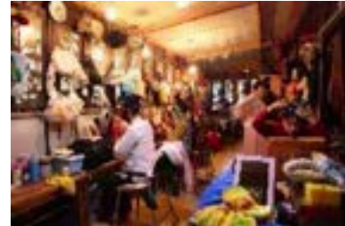
ภาพที่ 15 ห้องแต่งหน้า