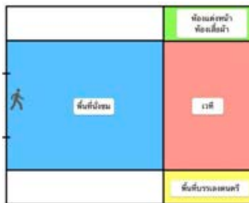
ภาพที่ 18 แผนผังสภาพแวดล้อมภายในของคณะอุปรากรยูนนานกวนตู้หลีหยวน

จากการสำรวจพื้นที่ตั้งของคณะอุปรากรยูนนานกวนตู้หลีหยวน พบว่า 1.ตำแหน่งที่ตั้งค่อนข้างหาเจอง่าย ในแหล่งท่องเที่ยว มีป้ายบอกทางที่ชัดเจน 2.สถานที่กว้างมาก สิ่งอำนวยความสะดวกครบครัน บรรยากาศการชมที่นั้รับชมดีมาก 3.นักท่องเที่ยวส่วนใหญ่เป็นคนต่างถิ่นและผู้สูงอายุที่อาศัยในระแวกใกล้เคียง 4.คณะฯ ใช้นักแสดงเยอะมาก ผู้วิจัยได้วาดแผนผังสภาพแวดล้อมภายในโรงละครของของอุปรากรยูนนานนี้ตามการสำรวจ ดังนี้