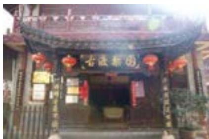
ภาพที่ 13 แผนที่แหล่งท่องเที่ยวในเมืองโบราณกวนตุ๋กู่เจิ้นและประตูทางเข้ากู่ตุ๋กู่เจิ้น (ผู้ถ่าย: Su Yuntao พฤศจิกายน ค.ศ. 2019)

ในการสำรวจวิจัยและทำการสัมภาษณ์ ผู้วิจัยได้ดำเนินการสำรวจสภาพแวดล้อมของเมืองโบราณกวนตุ๋กู่เจิ้น พบว่า เมืองโบราณกวนตุ๋กู่เจิ้นเป็นสถานที่ท่องเที่ยวแบบเปิด ไม่ต้องเสียค่าเข้าชม ลักษณะการตกแต่งของร้านค้าด้านในเป็นไปในทิศทางเดียวกัน ส่วนใหญ่เป็นสิ่งก่อสร้างที่สร้างขึ้นใหม่โดยการทำเลียนแบบโบราณ ถนนของเมืองโบราณกวนตุ๋กู่เจิ้นสะอาดเป็นระเบียบ แต่บรรยากาศกลับขาดมนต์เสน่ห์ของความเก่าแก่และเป็นไปในเชิงการค้ามีนักท่องเที่ยวจำนวนมาก ส่วนใหญ่มาจากที่อื่นและมีคนท้องถิ่นที่อาศัยอยู่ระแวกใกล้เคียง สำหรับคณะอุปรากรยูนนานนั้นตั้งอยู่ที่มุมฝ่งตะวันออกเฉียงใต้ของเมืองโบราณ