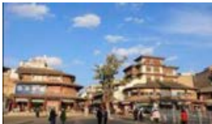
ภาพที่ 11-12 ถนนเมืองโบราณกวนตุ๋กู่เจิ้น (ผู้ถ่าย: Su Yuntao พฤศจิกายน ค.ศ. 2019)

นอกเหนือจากการสำรวจคณะผานหลงเตียนซี ตลาดจ้วนทินหนงม่าว ผู้วิจัยยังไปสำรวจคณะอุปรากรยูนนานกวนตุ๋กู่เจิ้นของเมืองโบราณกวนตุ๋กู่เจิ้น ซึ่งเมืองโบราณกวนตุ๋กู่เจิ้นเป็นเมืองที่มีประวัติศาสตร์ยาวนาน (The ancient town of Guandu) ตั้งอยู่ที่ซานเมืองฝ่งตะวันออกเฉียงใต้ของเมืองคุนหมิงมณฑลยูนนาน มีพื้นที่ 17 ตารางกิโลเมตร เป็นหนึ่งในเมืองโบราณทางประวัติศาสตร์วัฒนธรรมที่มีชื่อเสียงของเมืองคุนหมิง โบราณสถานทางวัฒนธรรมกวนตุ๋กู่เจิ้นมีแหล่งท่องเที่ยวทางวัฒนธรรมที่สมบูรณ์หลากหลาย คณะอุปรากรยูนนานกวนตุ๋กู่เจิ้นก็อยู่ที่นี้