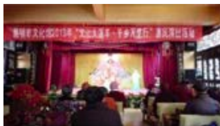
ภาพที่ 16 เวที