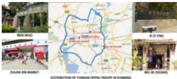
ภาพที่ 1 : สถานการณ์การกระจายตัวของคณะการแสดงอุปรากรยูนนานในเมืองคุนหมิง

ชนกลุ่มน้อยจำนวนมาก ถึงขั้นถูกขนานนามว่า “มหาสมุทรแห่งศิลปะชนกลุ่มน้อย” ในกระบวนการพัฒนาของอุปรากรยูนนานนั้น การแสดงบนเวทีพื้นบ้านเป็นระยะเวลาอันยาวนานทำให้ได้ซึมซับศิลปะพื้นบ้านและมีเอกลักษณ์ของชนพื้นเมืองของชนกลุ่มน้อย