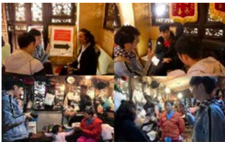
ภาพที่ 19 การดำเนินการสัมภาษณ์ต่อหัวหน้าคณะและสมาชิกคณะอุปรากรจินยูนนาน

เนื่องจากการสนับสนุนจากทางภาครัฐ เจื่อนไซในหลาย ๆ ด้าน ทำให้ภาพรวมของคณะอุปรากรจินยูนนานกวนตู้หลีหยวนค่อนข้างดี พื้นที่จัดแสดงมีพื้นที่ใช้สอย 500 ตารางเมตร ด้านในแบ่งออกเป็น เวที พื้นที่นั่งชม พื้นที่สำหรับการบรรเลงดนตรี ห้องแต่งหน้า ห้องเสื้อผ้า พื้นที่นั่งชมสามารถรองรับได้ประมาณ 80 คน มีเก้าอี้นั่งครบครันโดยปกติคนจะนั่งกันเต็ม แสงไฟ เสียง เวที วงดนตรี อุปกรณ์ประกอบฉากก็ค่อนข้างสมบูรณ์ การสัมผัสประสบการณ์ของผู้ชมค่อนข้างเยี่ยม พื้นที่สำหรับการบรรเลงดนตรี ห้องแต่งหน้าและห้องกับเก็บอุปกรณ์กระจายอยู่ที่สองข้างของเวทีกว้างขวาง มีบริเวณที่สามารถทำกิจกรรมได้มาก นักแสดงก็ค่อนข้างเยอะ ราว 15 คน ในบางช่วงเวลายังมีนักแสดงวัยหนุ่มสาวเข้าร่วมแสดงด้วย จากการรวบรวมจุดเด่นของคณะอุปรากรจินยูนนานกวนตู้หลีหยวนพบว่าข้อดี คือมีผู้ชมจำนวนมากทั้งนักท่องเที่ยวต่างถิ่นและคนท้องถิ่น รวมทั้งสิ่งอำนวยความสะดวกในการแสดงครบครันไม่ว่าจะเป็น ไฟ เสียง วงดนตรี อุปกรณ์ประกอบฉาก และมีสภาพแวดล้อมดี พื้นที่กว้างขวาง และยังได้รับการสนับสนุนจากทางภาครัฐที่เกี่ยวข้อง แต่สำหรับจุดด้อย พบว่า พื้นที่มีค่าเช่าแพงเพราะเป็นแหล่งท่องเที่ยว และอยู่ชานเมืองห่างจากตัวเมืองค่อนข้างไกล