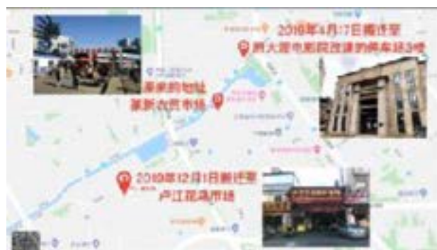
ภาพที่ 4 ตำแหน่งบน Google map ที่คณะผานหลงเตียนซี อุปรากรตลาดจ้วนชินหนงม่าวย้ายไปทั้ง 2 ครั้ง

ผู้วิจัยลงพื้นที่พบว่าคณะอุปรากรยูนนานนี้ได้ย้ายออกไปแล้ว โดยไม่มีความแน่ชัดเรื่องพื้นที่และข้อมูล จากการสอบถามคนพื้นที่จนในที่สุดในเดือนธันวาคม ค.ศ. 2019 ก็ได้พบช่องทางติดต่อสมาชิกในคณะคนหนึ่งจากนักข่าวหนังสือพิมพ์ด้วยความช่วยเหลือของอาจารย์ในมหาวิทยาลัยคุนหมิง ซึ่งคณะอุปรากรยูนนานนี้ได้ย้ายไปยังที่อยู่ใหม่บริเวณตลาดหูเจียงฮวาเหินเยว และเปิดการแสดงในเวลา 14:00-16:00 น.ของทุกวัน