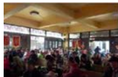
ภาพที่ 17 พื้นที่นั่งชม

ภาพที่ 14-17 สภาพแวดล้อมภายในของคณะอุปรากรยูนนานกวนตู้หลีหยวน (ผู้ถ่าย : Su Yuntao พฤศจิกายน ค.ศ. 2019)