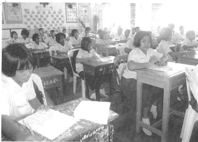
ภาพที่ 3 กลุ่มตัวอย่างขณะวัดผลการเรียนรู้