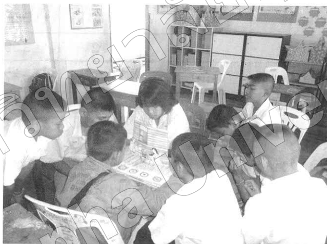
ภาพที่ 2 กลุ่มตัวอย่างขณะศึกษาสื่อสิ่งพิมพ์หนังสือ