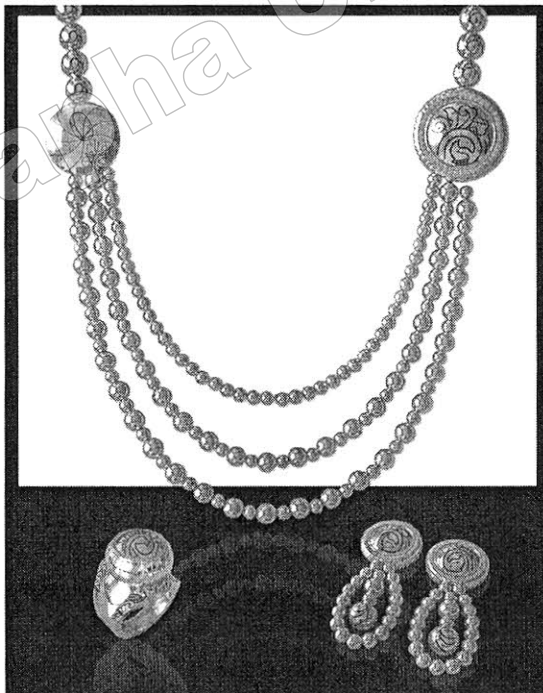
รูปที่ 1 รูปแบบผลิตภัณฑ์หัตถกรรมเครื่องประดับที่พัฒนาขึ้นใหม่ รูปแบบที่ 1

1. ผู้เชี่ยวชาญด้านการออกแบบและผลิตเครื่องประดับมีความคิดเห็นว่า เครื่องประดับที่ออกแบบใหม่ รูปแบบที่ 3 เป็นรูปแบบที่มีความเหมาะสมในระดับมากที่สุด ( \bar{X} = 4.56 ) รองลงมา คือ รูปแบบที่ 2 มีความเหมาะสมในระดับมากที่สุด ( \bar{X} = 4.53 ) และอันดับสุดท้ายรูปแบบที่ 1 มีความเหมาะสมในระดับมาก ( \bar{X} = 4.43 )