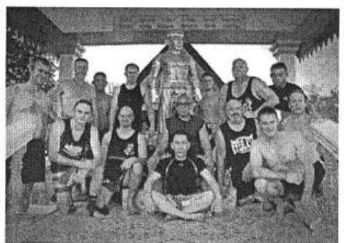
ลูกศิษย์ของครูยอดตรง ทั้งเด็กเยาวชนไทย ที่อาศัยอยู่ในมูลนิธิฯ และลูกศิษย์ชาวต่างชาติ