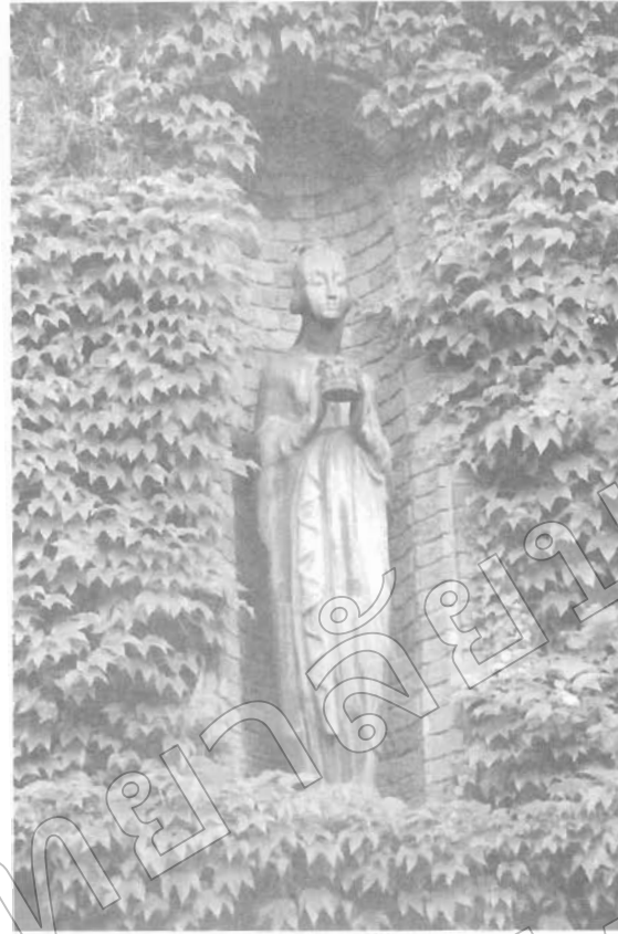
การวางตำแหน่งจุดสนใจ ในตำแหน่งจุดกึ่งกลางภาพทำให้ความรู้สึกสงบนิ่ง