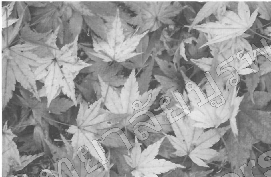
ภาพไม่แสดงจุดเด่น มีความสวยงามกระจายอยู่ทั้งภาพ

การวางจุดเด่นหรือจุดสำคัญที่กำหนดให้อยู่ในภาพถ่ายต่างๆ บางลักษณะอาจมีหรือไม่มีก็ได้และถ้ามี อาจจะมีจุดเดียวหรือหลายจุดก็ได้ ภาพถ่ายใดที่มีความงดงามกระจายอยู่ทั่วทั้งภาพ เช่น ภาพดอกไม้บานสะพรั่ง อยู่ทั่วไปทั้งสวน ดอกไม้ในภาพ จึงไม่จำเป็นต้องมีจุดเด่นในภาพหรือภาพป่าไม้ที่อบอวลไปด้วยหมอกเป็นภาพที่ สวยด้วยบรรยากาศทั้งภาพ