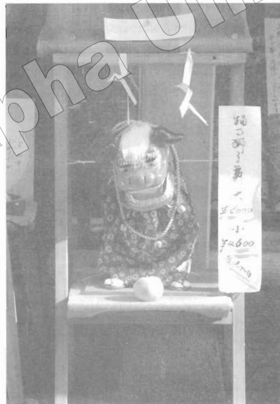
การวางตำแหน่งจุดสนใจ ในตำแหน่งจุดกึ่งกลางภาพทำให้ความรู้สึกสงบนิ่ง