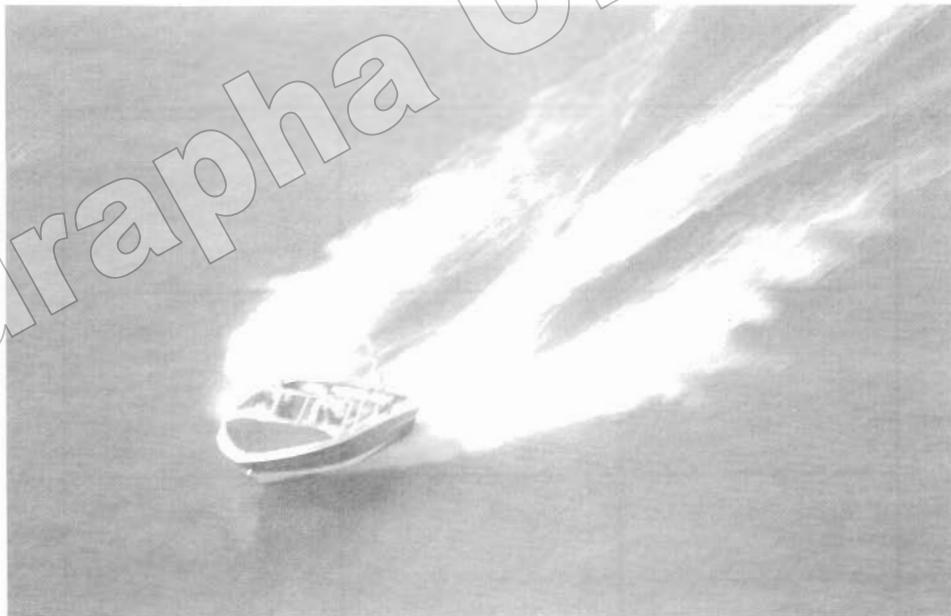
การวางตำแหน่งจุดสนใจ ตามกฎสามส่วนทำให้ภาพรู้สึกเคลื่อนไหว น่าสนใจ