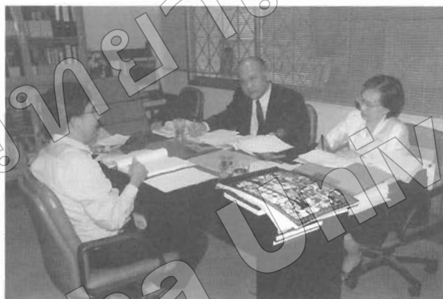
คณะกรรมการตรวจประเมินฯ ตรวจเอกสารหลักฐาน ทั้ง 9 องค์ประกอบของกลุ่มสาขาวิชาศิลปกรรมศาสตร์