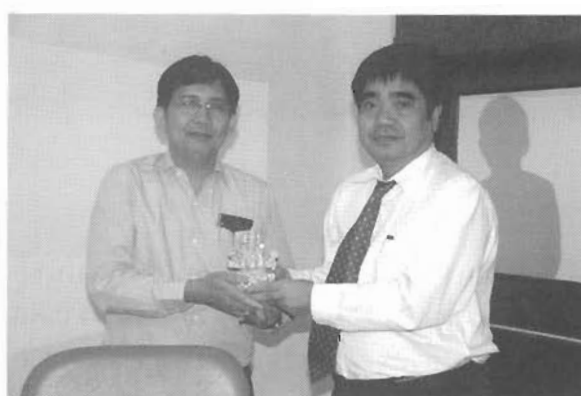
คณบดีคณะศิลปกรรมศาสตร์ มอบองค์พระพิฆเนศเป็นที่ระลึก ให้กับคณะกรรมการตรวจประเมินฯ ทุกท่าน