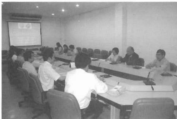
ผู้บริหารกลุ่มสาขาวิชาศิลปกรรมศาสตร์ กล่าวต้อนรับและร่วมชม วิดิทัศน์แนะนำคณะศิลปกรรมศาสตร์