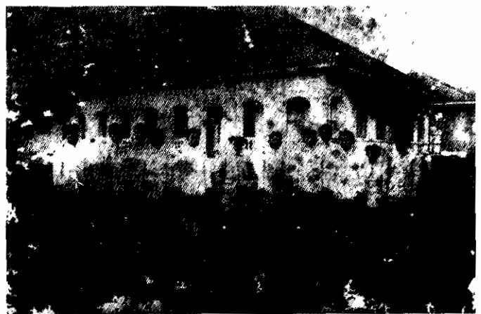
ภาพที่ ๑๒ ศาลากลางจังหวัดชลบุรี อาคารด้านซ้ายและศาลจังหวัดชลบุรี ด้านขวา เมื่อ พ.ศ. ๒๔๙๓ (ภาพซ้าย) และอาคารทำการที่ดินจังหวัดฉะเชิงเทรา มณฑลปราจีน ปัจจุบันได้ถูกรื้อถอน (ภาพขวา)