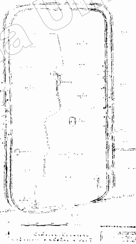
ภาพที่ ๑๑ ผังสังเขปเมืองพระรถ ตำบลหน้าพระธาตุ อำเภอพนัสนิคม ประพจน์ โยธาประเสริฐ ผู้เขียน พ.ศ.๒๕๐๐

กรณีจังหวัดชลบุรีอาจได้รับการยกเว้นเนื่องจากอาณาบริเวณชายฝั่งทะเลขึ้นไปถึงเขตลุ่มตอนภายใน มีหลักฐานการมีอยู่ของผู้คนมาอย่างต่อเนื่องตั้งแต่สมัยก่อนประวัติศาสตร์เรื่อยลงมาจนถึงปัจจุบัน เป็นภาพสะท้อนถึงการตั้งบ้านเมืองอย่างเป็นหลักแหล่งแน่นอน พร้อมกับมีการสร้างคูคันดินกำแพงเมืองอยู่อย่างถาวรแบบไม่คิดจะโยกย้ายไปไหน เช่น เมืองอื่นๆ หลักฐานจากแนวคันดินโบราณเมืองพระรถ อำเภอพนัสนิคม (ภาพที่๑๑) และแนวคันดินเมืองศรีโพธิ์ อำเภอมะขามบุรี ปัจจุบันถูกปรับพื้นที่สร้างเป็น ถนนสุขุมวิท ต่างก็บ่งบอกการดำรงอยู่อย่างสืบเนื่องกันมาระหว่างสมัยทวารวดี – ยุชยาตอนต้น (หรือก่อนหน้านั้นขึ้นไปเล็กน้อย) จนถึงสมัยรัตนโกสินทร์ลงมา