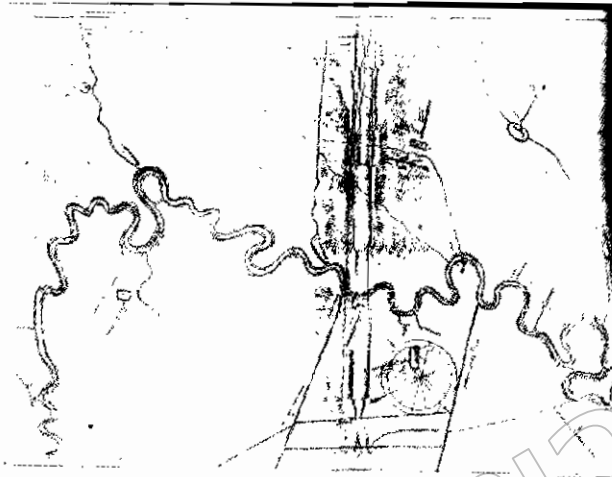
ภาพที่ ๑๓ แผนที่ตั้งตลาด อำเภอเมืองระยอง ร.ศ. ๑๑๑ (พ.ศ. ๒๔๓๔) มณฑลปราจีน และตึกแถวที่สร้างขึ้นในช่วงเวลา ร่วมสมัยกัน

ที่สร้างขึ้นร่วมสมัยกันก็อาจพอมองเห็นรูปแบบและค่านิยมของผู้คนที่เปลี่ยนแปลงไปอย่างเป็นรูปธรรม ยิ่งศึกษาผ่านจิตรกรรมฝาผนังที่ถูกเขียนขึ้นในช่วงเวลาเดียวกัน ก็จะพบเนื้อเรื่องบางองค์ประกอบของภาพเขียนต่างก็แอบแฝงค่านิยมแบบใหม่ๆ จากตะวันตกผ่านวิถีชีวิตของผู้คนแถบนี้อย่างเด่นชัด ได้แก่ การแต่งกาย เครื่องประดับ เครื่องใช้ การเดินทาง (ใช้เรือกลไฟ เรือเครื่องจักรไอน้ำ) ฯลฯ ที่บ่งบอกถึงความเปลี่ยนแปลงของสังคมวัฒนธรรมท้องถิ่นอย่างไม่ต้องสงสัย (ภาพที่ ๑๔)