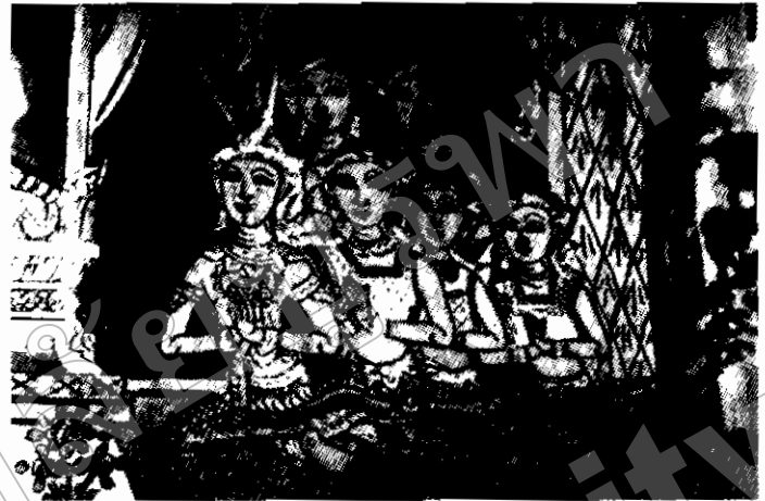
ภาพที่ ๑๔ ภาพเขียนแสดงการแต่งกายแบบเสื้อคอกระเช้าของบรรดานางสนมในราชสำนักของจิตรกรรมฝาผนังวัดเนินสูง ตำบลคลองนารายณ์ อำเภอเมืองจันทบุรี ปลายเมื่อ พ.ศ. ๒๔๕๓