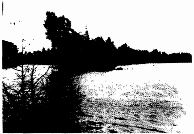
ภาพที่ ๘ ภาพจำลองเจดีย์เดิมที่ตั้งอยู่บนแหลมพระปรารค์ บริเวณปากน้ำเจ้าโล้ ตามข้อคิดเห็นของ ประเสริฐ ศีลรัตนดา ที่มา : ประเสริฐ ศีลรัตนดา มหาวิทยาลัยราชภัฏราชนครินทร์ พ.ศ.๒๕๕๐