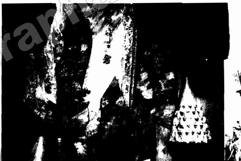
ภาพที่ ๖ ศาลเจ้าพ่อ และเจ็ดบ้านบางปลา ตำบลบางปลา อำเภอบางพลี จังหวัดสมุทรปราการ (สองภาพบน) และเจ็ดภายใน ศาลเจ้าเจ้าพ่อสาคร ตำบลท่าข้าม อำเภอบางปะกง จังหวัดฉะเชิงเทรา (ภาพล่าง) ถ่ายเมื่อ พ.ศ. ๒๕๕๐ - ๒๕๕๑ และยังมีศาลเจ้าเก่าดั้งเดิมแถบชายฝั่งของจังหวัดสมุทรปราการ และฉะเชิงเทราอีกมาก