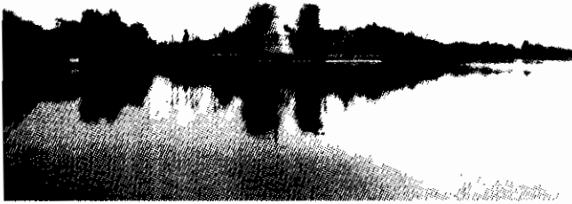
ภาพที่ ๗ อนุสรณ์สถานสมเด็จพระเจ้าตากสิน บนพื้นที่หัวแหลม พระปรารค์ สร้างขึ้นตามจินตนาการของชาวบ้าน และ ผู้นำในท้องถิ่น (ถ่ายเมื่อ พ.ศ.๒๕๔๙)