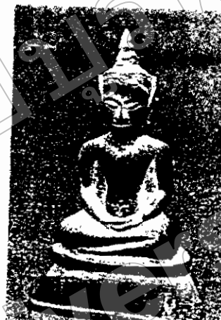
ภาพที่ ๒ เศียรพระพุทธรูปศิลาสมัยอยุธยา ขุดพบที่อำเภอศรีมหาโพธิ์ จังหวัดปราจีนบุรี (ภาพซ้าย) พระพุทธรูปศิลาสมัยอยุธยา ที่วัดพระพุทธรูป อำเภอพระพุทธรูป จังหวัดสระบุรี เขตต่อเนื่องกับจังหวัดนครนายก (ภาพขวาบน) ถ่ายเมื่อ พ.ศ. ๒๕๕๐ พระพุทธรูปสำริดสมัยอยุธยา พบในเจดีย์เก่า วัดหาดยาง (ร้าง) อำเภอศรีมหาโพธิ์ จังหวัดปราจีนบุรี (ภาพขวาล่าง)

กรณีการได้รับอิทธิพลจากศูนย์กลางจากทวารวดี (น่าจะเป็นบริเวณตอนกลางของไทย) และลพบุรีในเขมรก็ตาม อิทธิพลที่เข้ามาในบางบริเวณ เช่น เมืองศรีมโหสถ และชุมชนบริเวณชายขอบใกล้เมืองเขมรโบราณ ได้แก่ อำเภอต่างๆ ของจังหวัดสระแก้วปัจจุบัน และหรืออำเภอเมืองจังหวัดจันทบุรี อาจได้รับอิทธิพลที่ผ่านเข้ามาโดยตรง เพราะชายแดน อยู่ใกล้ชิดติดกัน สำหรับตำแหน่งที่ตั้งของเมืองพระรถ และเมืองศรีโพธิ์ ที่มีระยะทางห่างไกลจากศูนย์กลางของ อาณาจักรทวารวดี และลพบุรีมาก มีความเป็นไปได้ว่าอาจได้รับอิทธิพลที่ผ่านมาจากเมืองศรีมโหสถ หรือเมืองอื่น อีกทอดหนึ่ง (ภาพที่ ๑) ทั้งนี้ยังไม่เป็นข้อยุติจนกว่าจะมีการศึกษาวิจัยกันอย่างจริงจังอีกครั้งหนึ่ง