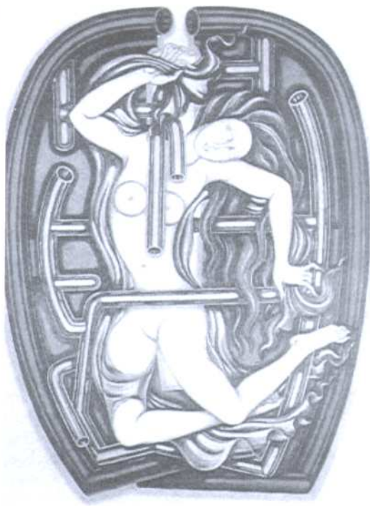
ภาพที่ ๓ องค์ประกอบศิลป์, ๒๕๓๒, สีอะคริลิกบนผ้าใบ Composition, 1989, acrylic on canvas 120x 150 cm. (แสดงงานกลุ่มบูรพา ครั้งที่ ๒, ๒๕๓๒, ห้างเซ็นทรัลชิดลม)

"องค์ประกอบศิลป์", (๒๕๓๒) (ภาพที่ ๓) แสดงภาพเปลือยของหญิงสาวที่มีเรือนร่างอ่อนช้อยและผสมผสานกลมกลืนอยู่กับสิ่งแวดล้อมที่เป็นโลหะวัตถุ ทั้งนี้ศิลปินต้องการสื่อถึงความแตกต่างระหว่างธรรมชาติกับสิ่งแวดล้อมที่เป็นวัตถุ รวมถึงความสัมพันธ์ของการปรับตัวเข้าหากัน.