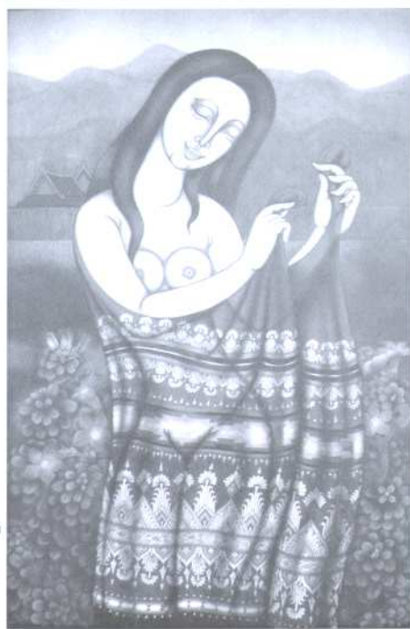
ภาพที่ ๒ ไทยนู้ด หมายเลข ๑, ๒๕๒๐, ภาพพิมพ์ด้วยแม่พิมพ์โลหะ Thai Nude No.1, 1980, color etching, 60x 83 cm. (รางวัลเกียรติยศอันดับ ๓ เหรียญทองแดง ในการแสดงศิลปกรรมแห่งชาติ ครั้งที่ ๒๗ พ.ศ. ๒๕๒๔) (แสดงงาน The 1st International Biennial Print Exhibition, 1983, Taipei, Taiwan)