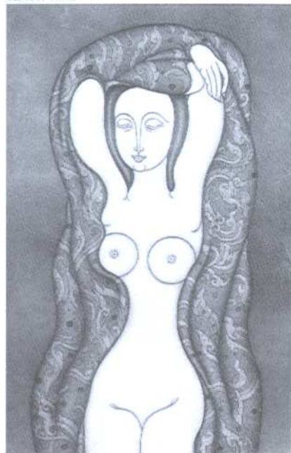
ภาพที่ ๑ ผ้าถุงแดง, ๒๕๔๕, สีอะคริลิกบนผ้าไหม Red Thai Silk, 2002, acrylic on canvas, 80 X 110 cm. (แสดงในงาน Great Eastern Art Exhibition, Dali College, P.R China)