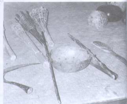
หัตถกรรม เครื่องมือ เครื่องใช้ของชาวซอง จัดแสดงที่ศูนย์วัฒนธรรมโรงเรียนคลองหลวงวิทยา จังหวัดจันทบุรี