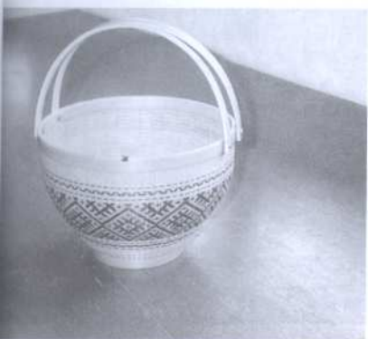
“ตะกร้ากลมลายรีด” เป็นลายปิดกระจกลายแบบมีขอบในผลิตภัณฑ์จากไม้ไผ่ของ อำเภอพนมดงรัก

งานระดับสำคัญๆ ของอำเภอ จังหวัดและภาค มีผลให้การจักสานที่พนมดงรักมีการพัฒนาการทาง ด้านรูปแบบจากหัตถกรรมที่ใช้ภายในครัวเรือน ก้าวไปสู่ของชำร่วย ของประดับตกแต่ง บ้านเรือน สำนักงานและของแขวนประดับตามห้างร้านต่าง ๆ