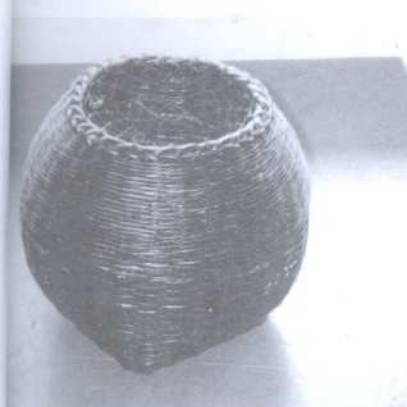
“ตะข่องจับปลา” ผู้ออกแบบ คุณ ปราณี บริบูรณ์