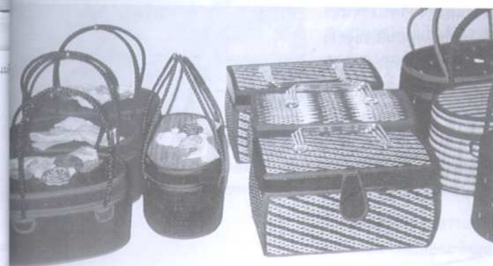
พื้นที่ทำจากเสื่อของใช้ส่วนพระองค์ของสมเด็จพระนางเจ้ารำไพพรรณี สวนบ้านแก้ว จังหวัดจันทบุรี

จันทบุรีได้ทรงพัฒนาการ ทอเสื่อจันทบูร ให้เจริญก้าวหน้าเป็นอย่างมาก พระองค์ได้เสด็จไปทอดพระเนตรกิจการทอเสื่อของแม่ชีวัดญวนพบข้อบกพร่องบางประการจึงมีพระราชดำริให้ปรับปรุงกรรมวิธีผลิต ใหม่ให้ทันสมัยและมีคุณภาพและโปรดเกล้าฯ ให้ตั้งโรงงานทอเสื่อจันทบูรที่สวนบ้านแก้วและเสื่อที่ผลิตได้นิยมเรียกว่า “เสื่อจันทบูรสมเด็จพระเจ้า” ประการสำคัญทรงประดิษฐ์และพัฒนาแบบผลิตภัณฑ์ที่ทำมาจากเสื่อ เป็นของใช้รูปแบบใหม่เช่น กระเป๋าเอกสาร กระเป๋าสตรี ที่รองจาน กล่องใส่กระดาษเช็ดมือ เป็นต้น และทรงโปรดเกล้าฯ ให้ติดเครื่องหมายการค้า “รูปคนหาบกระจาด” ใช้ชื่อว่า “อุตสาหกรรมชาวบ้าน” (product of peasant) พร้อมกับทรงเป็นตัวแทน