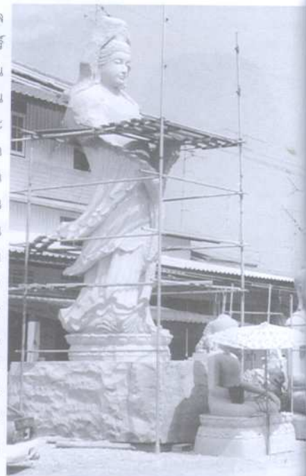
ภาพแกะสลักหินเจ้าแม่กวนอิมขนาดใหญ่และภาพพระพุทธรูปเป็นที่ทำช่างร้านสยามแกรนิตนิยมแกะสลักตำบลเสม็ดจังหวัดชลบุรี

การแกะของภาคตะวันออกเป็นภูมิปัญญาและกลวิธีมีการสืบทอดมาตั้งแต่รัชกาลพระบาทสมเด็จพระพุทธยอดฟ้าจุฬาโลก ในระยะช่วงแรกของการสถาปนากรุงรัตนโกสินทร์ ต้องนำเข้าหินที่มาจากจังหวัดชลบุรี เพื่อนำมาก่อสร้างหุ้มประตูจำนวน 8 หุ้ม บริเวณทางเข้าพระอุโบสถวัดพระเชตุพนวิมลมังคลารามฯ และมีแหล่งหิน ที่สำคัญคือ บ้านเขา ด่วน จังหวัดปราจีนบุรี บ้านแหลมแท่น จังหวัดชลบุรี การแกะสลักหินภาคตะวันออกจะเริ่มต้นจริงจังในตอนปลายรัชกาลพระบาทสมเด็จพระพุทธเลิศหล้านภาลัย เมื่อมีการติดต่อค้าขายกับจีน โดยพระเจ้าลูกเธอกรมหลวง เจษฎาภินทรซึ่งต่อมาเป็นพระบาทสมเด็จพระนั่งเกล้าเจ้าอยู่หัวได้แต่งลำเนาไปทำการค้ากับจีนจนร่ำรวยการติดต่อกับจีนทำให้ราชสำนักยุค นั้นมีความนิยมศิลปกรรมแบบจีนและนำตุ๊กตาหินสลักแบบจีนหรือประติมากรรมหินเข้ามาในประเทศไทยโดยนำไปติดตั้งตามวัดและอารามต่าง ๆ ความนิยมการแกะสลักหินแบบจีนได้แพร่ไปสู่ภูมิภาคนอกเมืองหลวงเมืองสำคัญคือจังหวัดชลบุรีเพราะเหตุว่ามีพื้นที่เขตติดต่อกัน การสัญจรไปมาสะดวก มีระยะทางเพียง 90 กิโลเมตรจากกรุงเทพฯ การแกะสลักหินของจังหวัดชลบุรีเกิดจากความคิดริเริ่มของชาวจีนอพยพที่เคยเป็นช่างแกะสลักหินอยู่ในจีนแผ่นดินใหญ่มาก่อน เมื่อมาตั้งหลักแหล่งที่เมือง ชลบุรีได้นำวิชาความรู้และ กระบวนการเชิงช่าง ที่มีอยู่ออกมาใช้ ด้วยการแนะนำชาวบ้านให้ทำการแกะ สลักหินโดย นำ "หิน" วัตถุดิบ ที่มีอยู่อย่างอุดมสมบูรณ์ใน บริเวณแหลมแท่น และจังหวัดใกล้เคียงมาใช้ มีรูปแบบผลิตภัณฑ์ที่แกะสลักในช่วงระยะแรกคือป้ายอวงซุ้ย ลูกนิมิต ป้ายเสมาและครกหิน