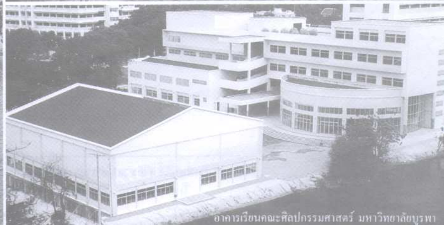
อาคารเรียนคณะศิลปกรรมศาสตร์ มหาวิทยาลัยบูรพา