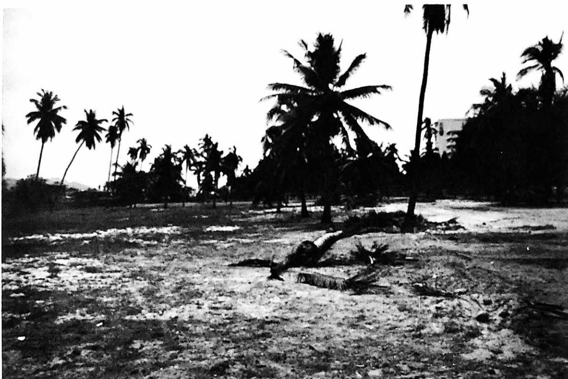
ทัศนียภาพด้านหน้ามหาวิทยาลัยบูรพา ชายมือจะเป็นที่ตั้งอาคาร 'หอศิลป์'

สามารถจะเข้าดำเนินการให้เกิดผลในทางปฏิบัติและเกิดประโยชน์ต่อประเทศชาติได้อย่างเป็นรูปธรรมในภาคตะวันออก