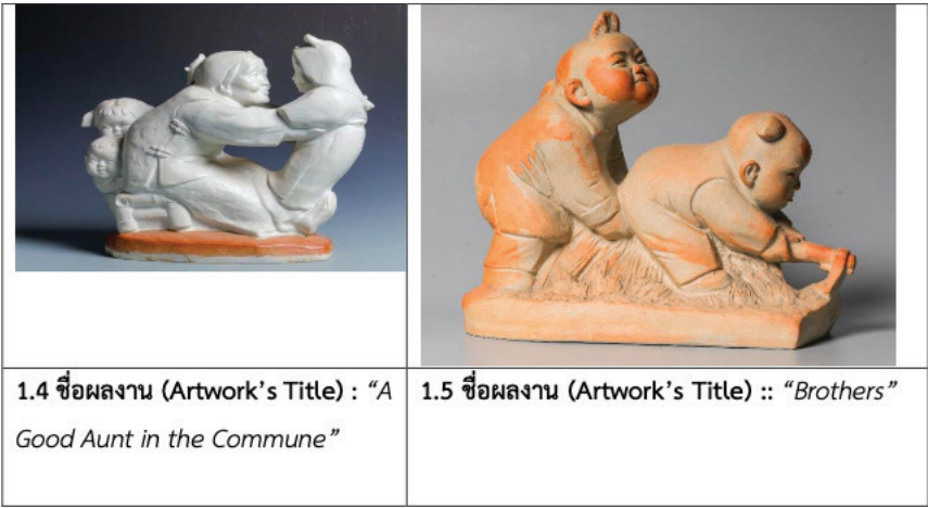
ชุดภาพประกอบที่ 1 ภาพผลงานศิลปะประติมากรรมเครื่องเคลือบของโจวกัวเจิน “ยุคหมอก”

2. ยุคสุนทรียภาพ (ค.ศ.1960 - ค.ศ. 1981) เมื่อโจวกัวเจินเริ่มแสวงหาความสมบูรณ์ของรูปร่างรูปทรง มีการตกแต่งโดยการใช้น้ำเคลือบสี เขามผสมผสานการเคลือบสีแบบดั้งเดิมต่าง ๆ เข้าด้วยกันเพื่อสร้างผลลัพธ์ทางศิลปะใหม่ ๆ ส่งผลให้ผลงานมีเสน่ห์ น่าดึงดูด และน่าสนใจ เคลือบสีใช้ในงาน เป็นเคลือบที่มีอุณหภูมิสูง มีสีสันที่หลากหลายหลากหลาย ผลงานด้านสีเคลือบของโจวกัวเจินในช่วงเวลานั้นสามารถกล่าวได้ว่ายอดเยี่ยมในระดับประเทศ ผลงานในยุคสุนทรียาศาสตร์ นี้สะท้อนความหมายของจิตวิญญาณ รูปทรง เหตุผล ความสนใจ และความตระหนักในตนเอง