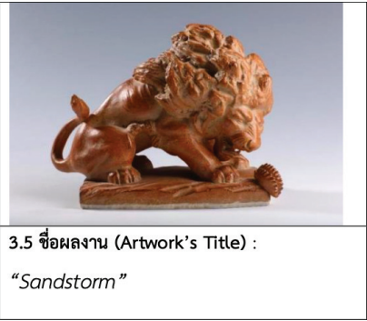
ชุดภาพประกอบที่ 3 ภาพผลงานศิลปะประติมากรรมเครื่องเคลือบของโจวกั๋วเจิน “ยุคโบราณ”

4. ยุคการแสดงออกใหม่ (ปีค.ศ.1988 - ค.ศ.2007) “ยุคการแสดงออกใหม่อยู่ในช่วงเวลาระหว่างปีค.ศ.1988 ถึงปีค.ศ.2007 ซึ่งเป็นช่วงที่โจวกั๋วเจินมีกระบวนการเปลี่ยนแปลงที่ปฏิวัติวงการประติมากรรมเครื่องเคลือบอย่างมาก โจวกั๋วเจินได้นำการปั้นขึ้นรูปดินเหนียวแบบดั้งเดิมที่ใช้ในการผลิตโอ่งขนาดใหญ่ในประเทศจีนที่มีมากกว่า 8,000 ปีมาแล้วมาสร้างสรรค์ประติมากรรม กล่าวได้ว่าเป็นคือการมีจิตสำนึกท้องถิ่น การยกระดับอย่างแท้จริงของศิลปะ