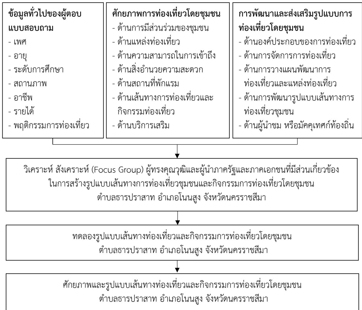
ภาพที่ 1 กรอบแนวคิดในการวิจัย