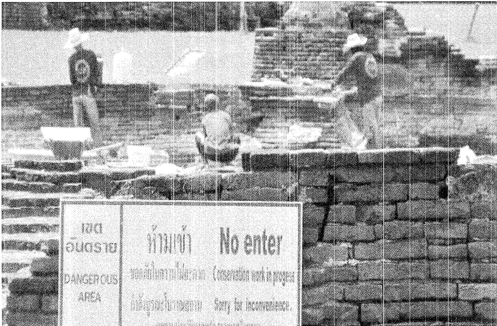
ภาพที่ 3 การเสริมฐานล่างโบราณสถาน