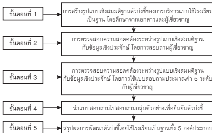
ภาพที่ 2 ขั้นตอนการวิจัย