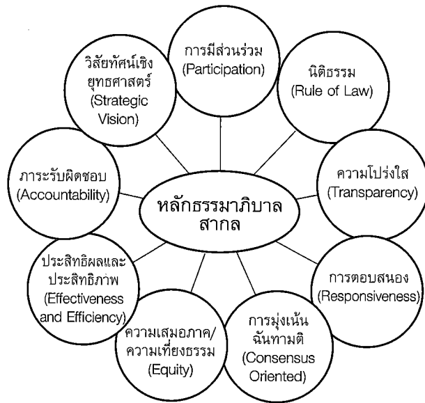
ภาพที่ 3 หลักธรรมาภิบาลสากล (UNDP, 1997)