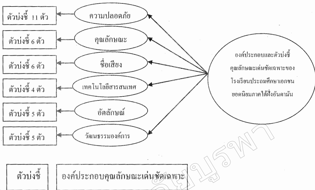
ภาพที่ 2 ผลของการวิจัย

สามารถอธิบายความแปรปรวนของตัวบ่งชี้ทั้ง 6 มีค่าไอเกน เท่ากับ 8.60 , 4.98 , 3.80 , 2.96 , 37 ตัวบ่งชี้ได้ร้อยละ 62.17 โดยองค์ประกอบที่ 1 ถึง 2.12 และ 1.77 ตามลำดับ ดังนี้